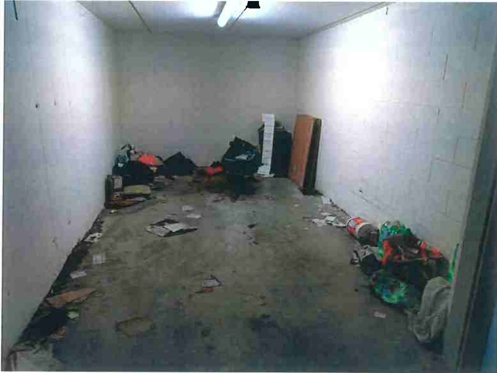
Foto 12 Scorcio del garage.