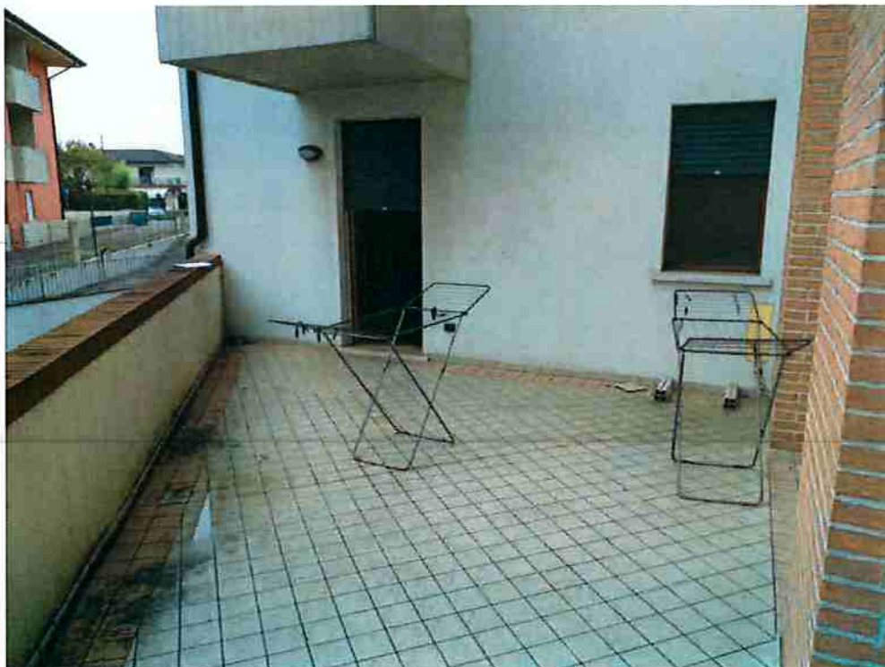
Foto 3 Scorcio della terrazza.