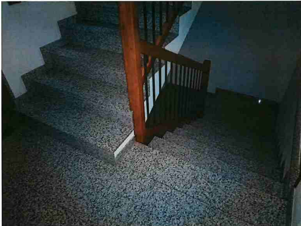
Foto 10 Scorcio del vano scale condominiale.