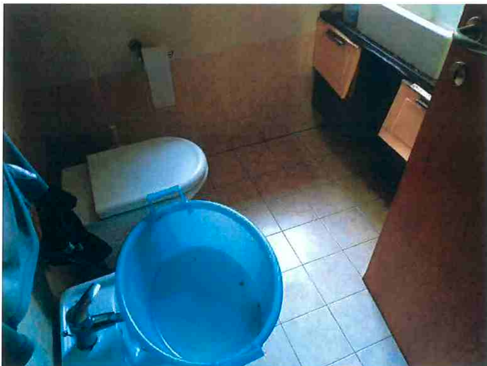
Foto 5 Scorcio del bagno.