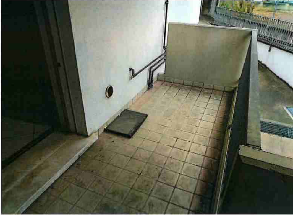
Foto 6 Vista del poggiolo.