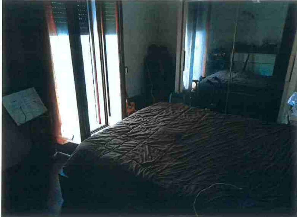
Foto 4 Vista della camera.