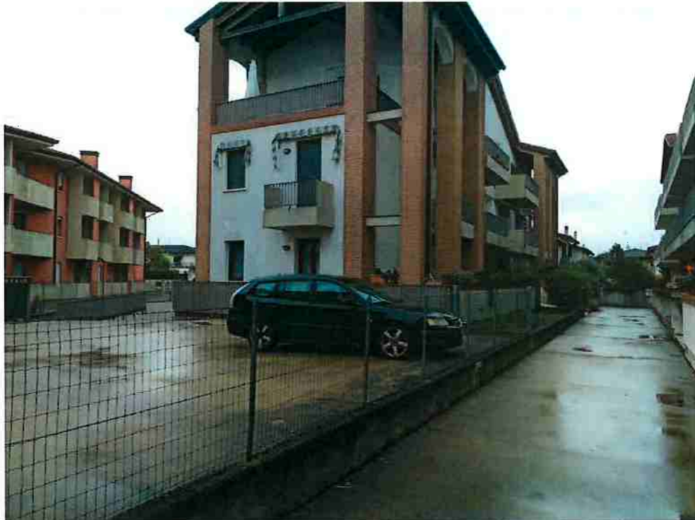
Foto n.2bis Vista del condominio.