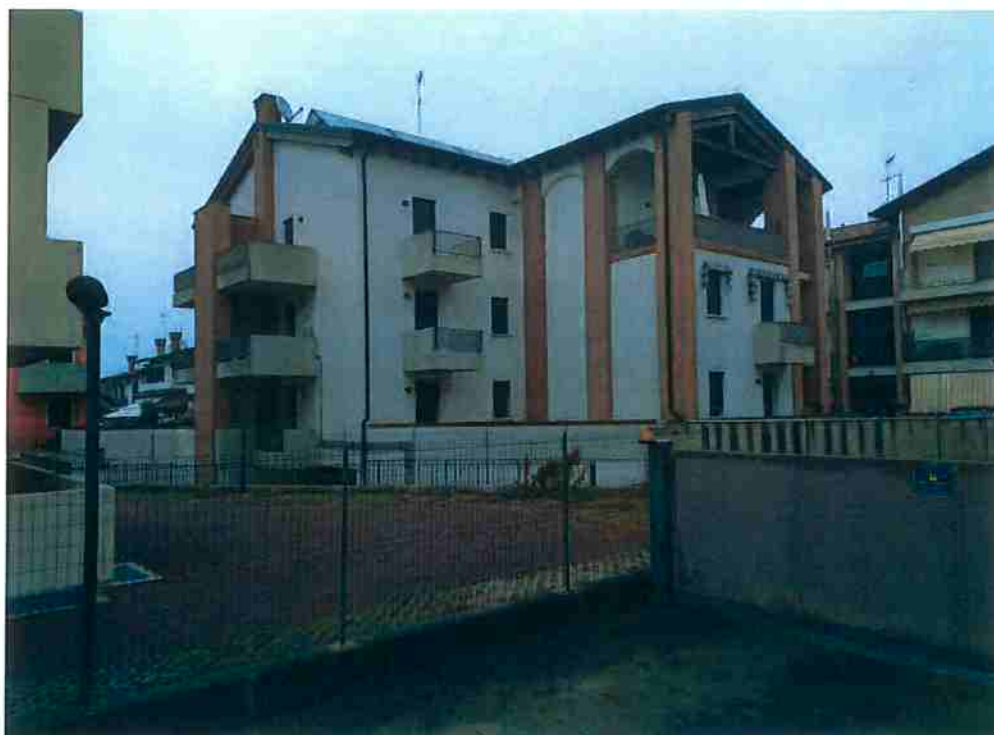
Foto 2 Vista del condominio.