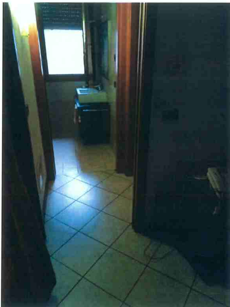
Foto 9 Vista del disimpegno.