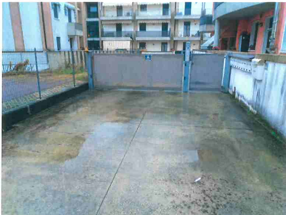
Foto 1 Vista del cancello di ingresso.