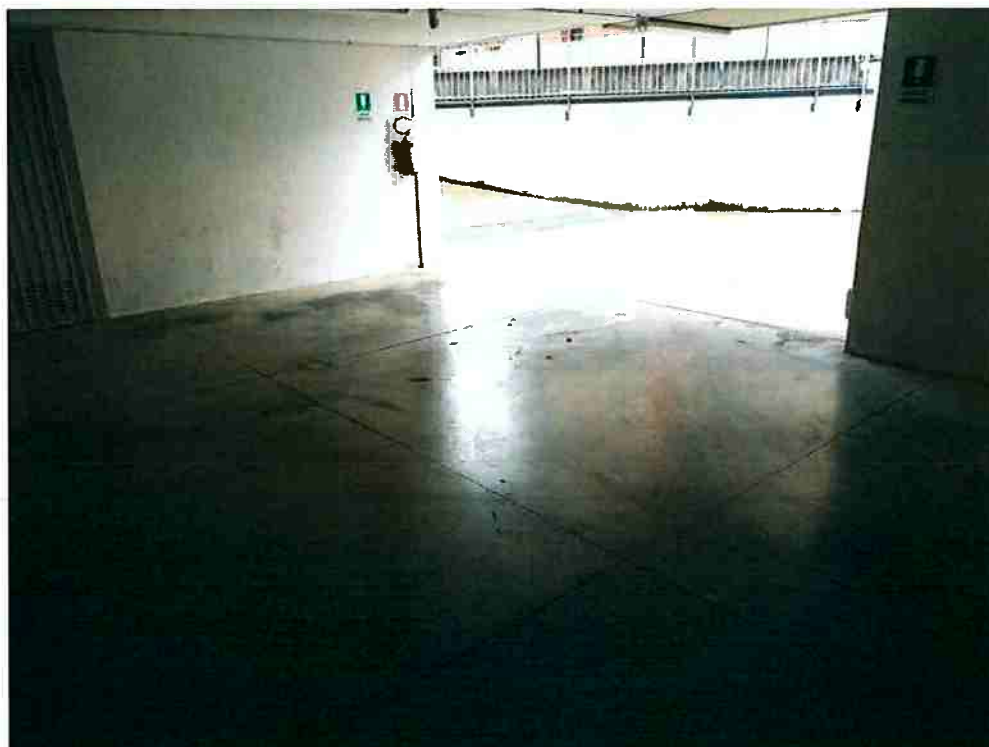
Foto 11 vista dell'ingresso all'autorimessa.