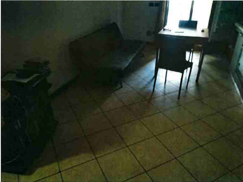
Foto 8 Scorcio del soggiorno.