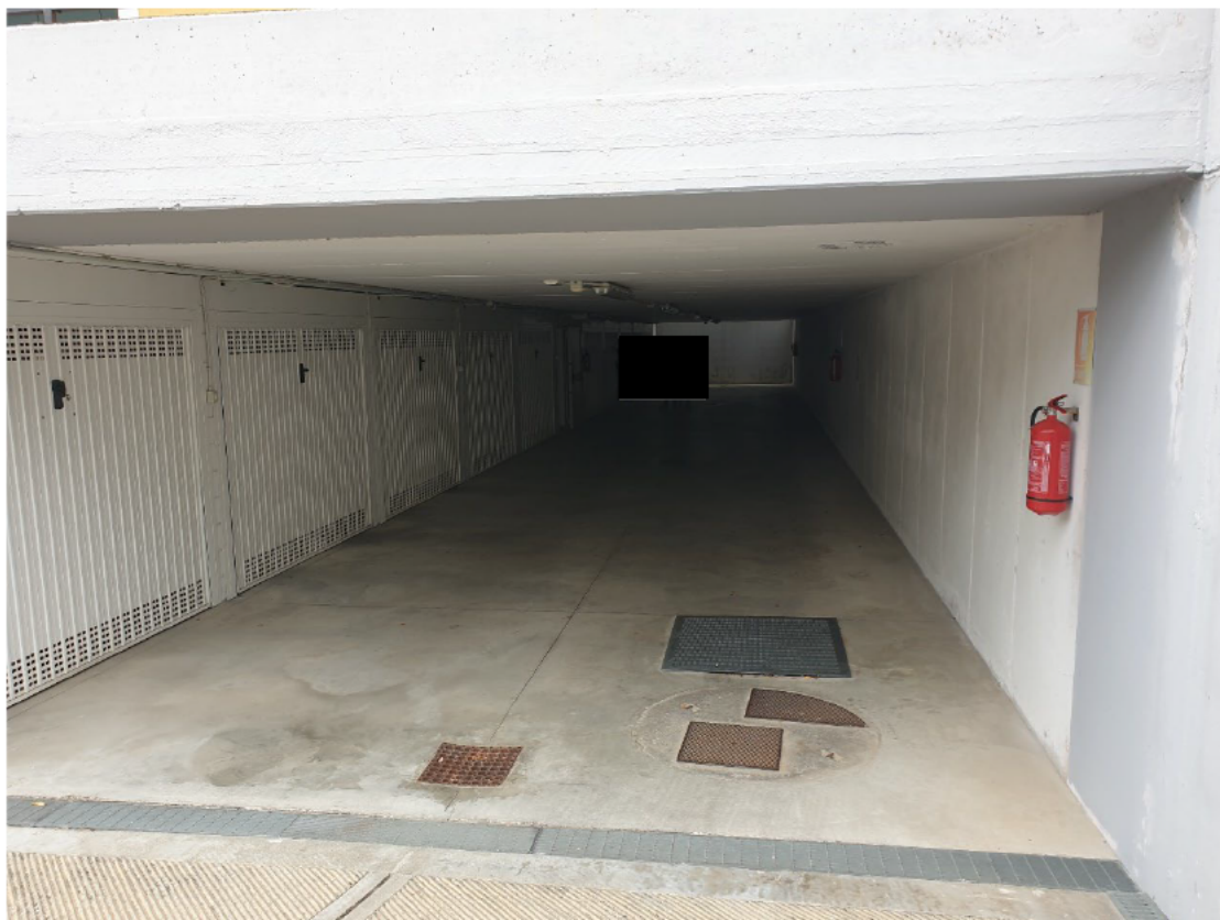
15.1 – ACCESSO ALL'INTERRATO GARAGE