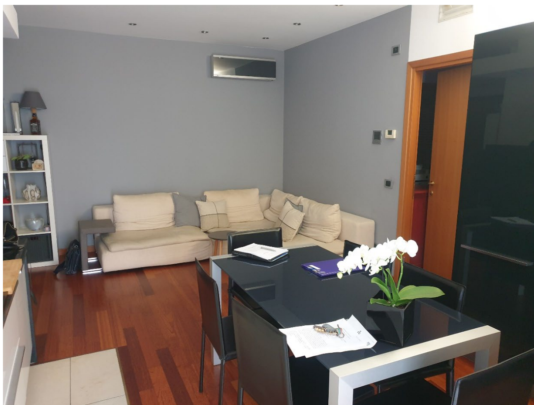
05 – ZONA GIORNO VEDUTA INVERSA