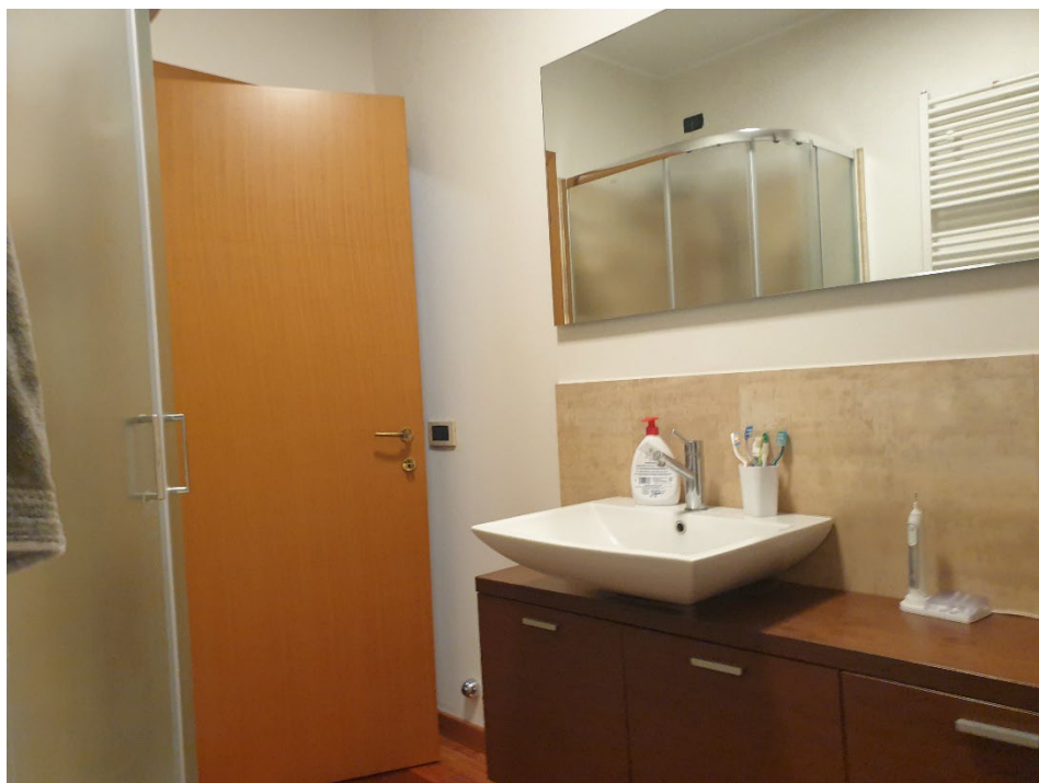
08 – BAGNO VEDUTA INVERSA