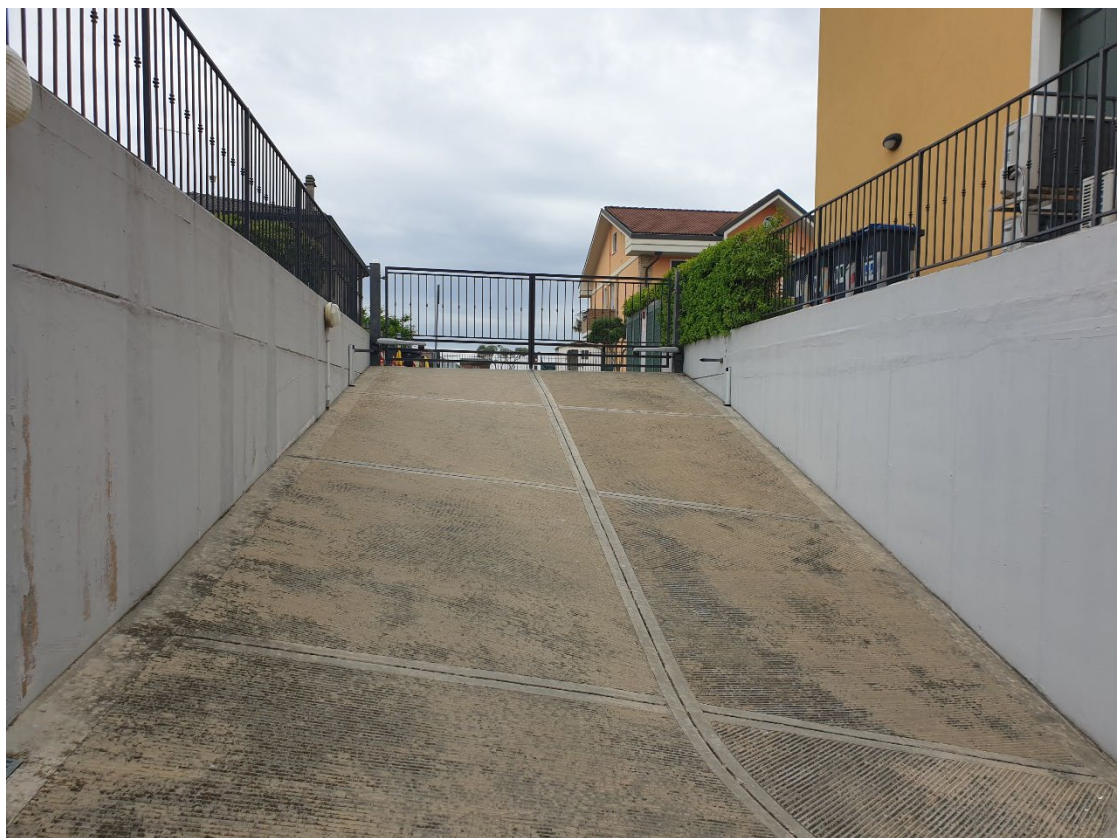
15 – RAMPA CARRABILE ACCESSO ALL'INTERRATO GARAGE DALLA PUBBLICA VIA