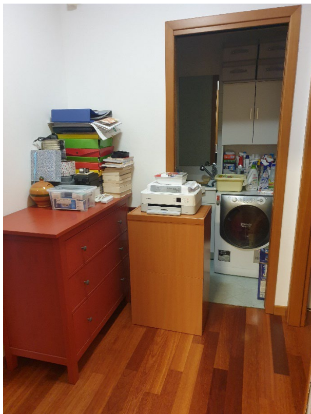
06 – DISIMPEGNO