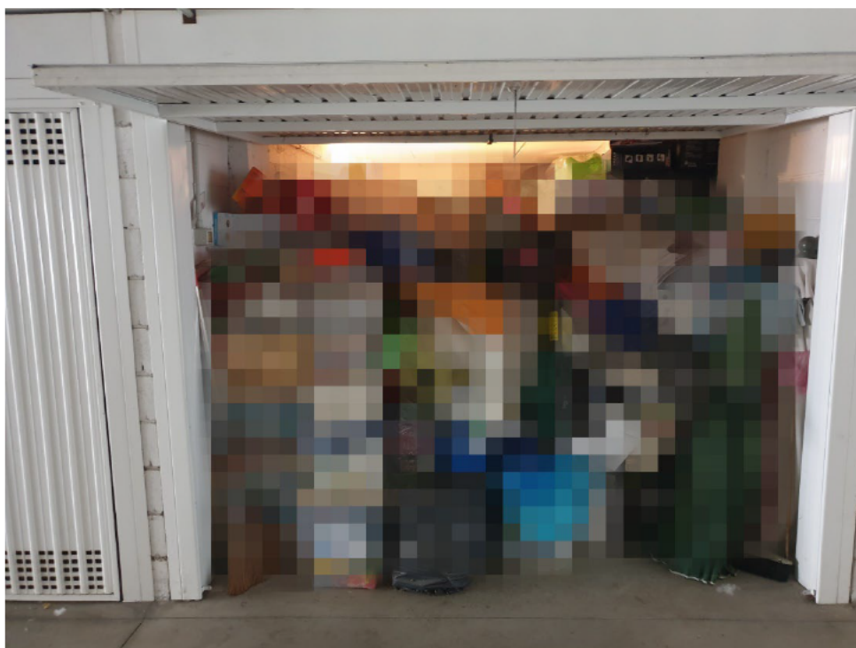
16 – BOX AUTO