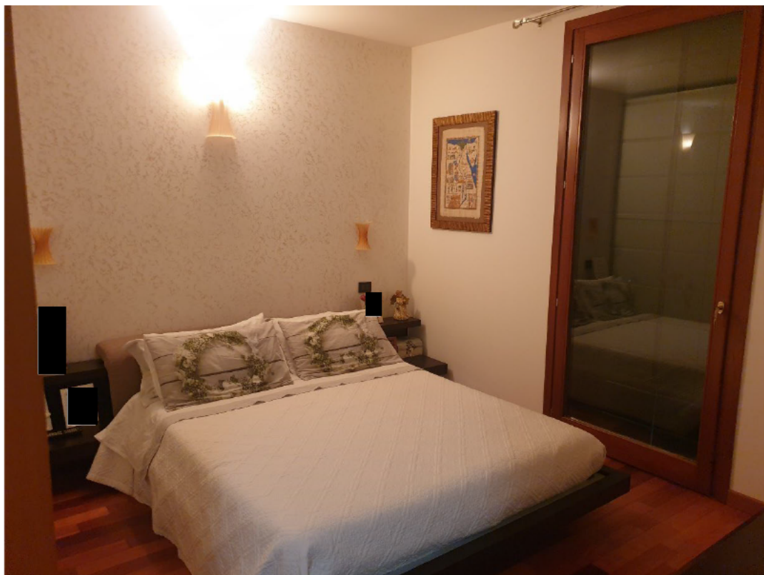
10 – CAMERA DA LETTO PADRONALE