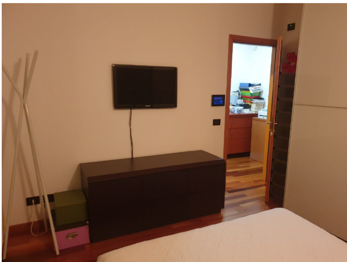
11 – CAMERA DA LETTO PADRONALE VISTA INVERSA