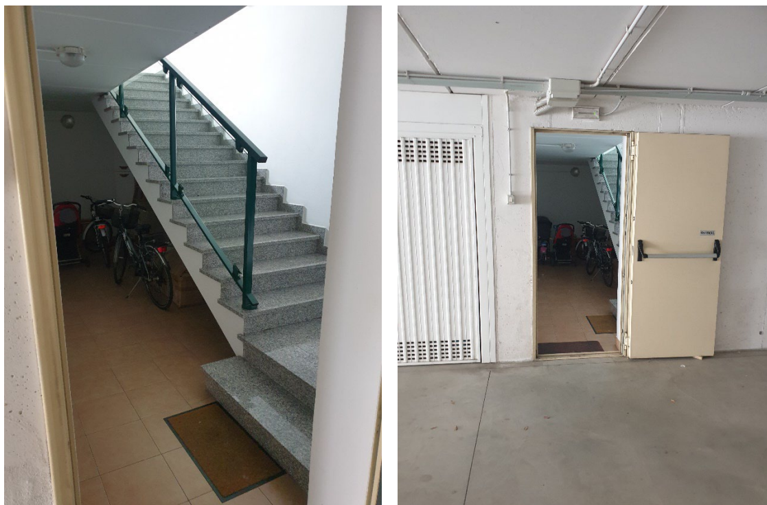
14.4 – ACCESSO INTERNO AL GARAGE INTERRATO