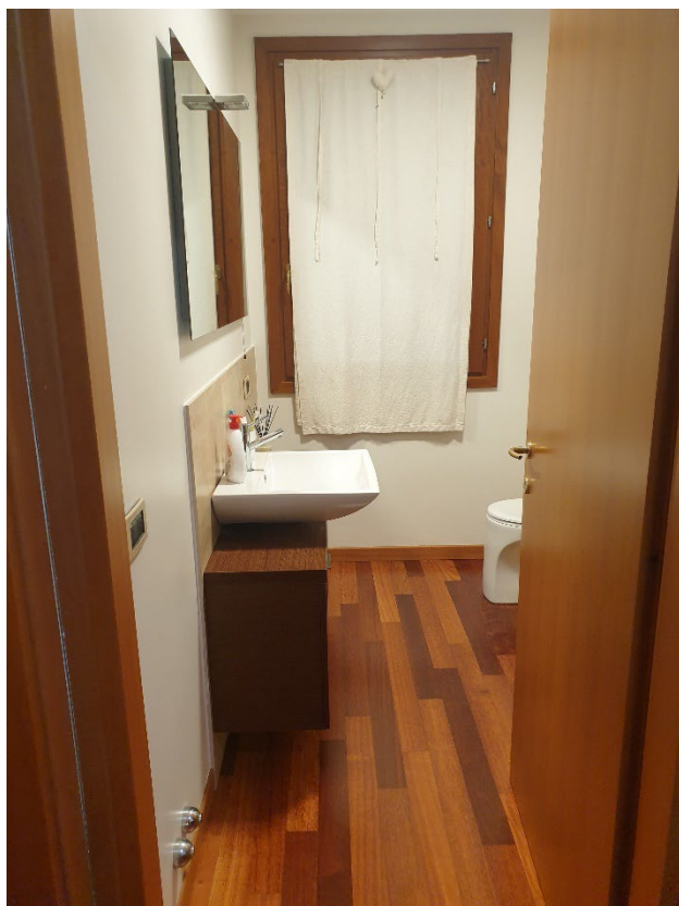
07 – BAGNO