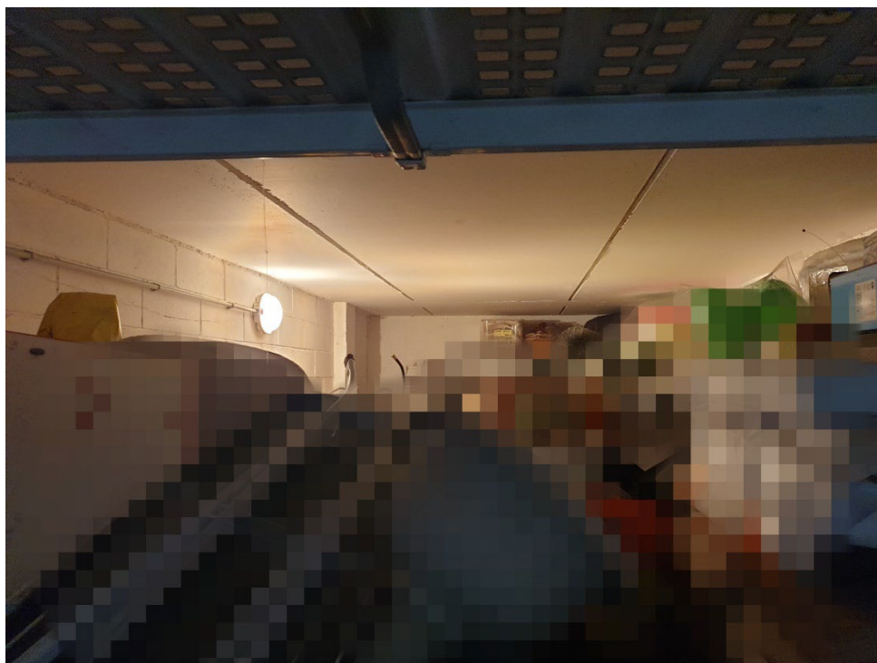
16.1 – BOX AUTO PARTICOLARE