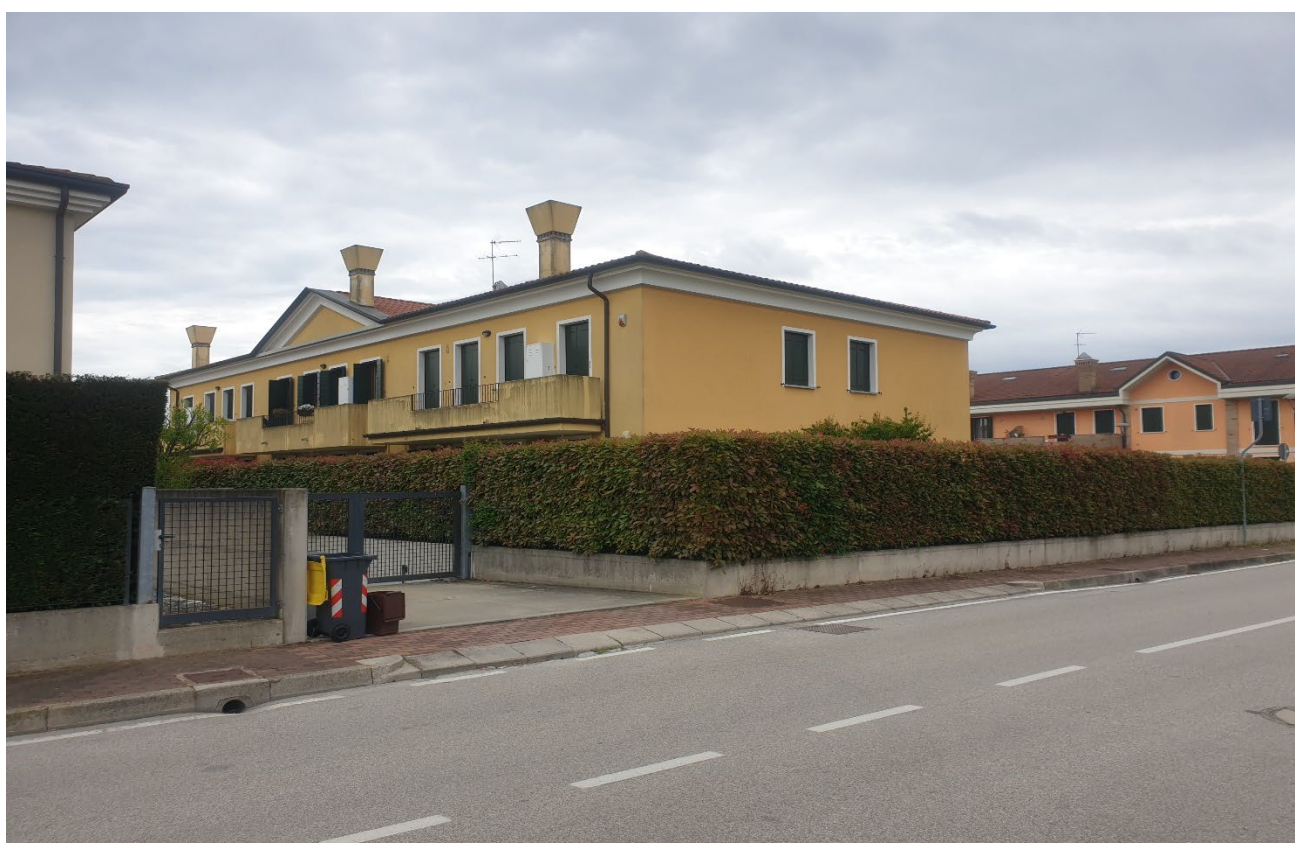
01 – VISUALE ESTERNA DELL'EDIFICIO