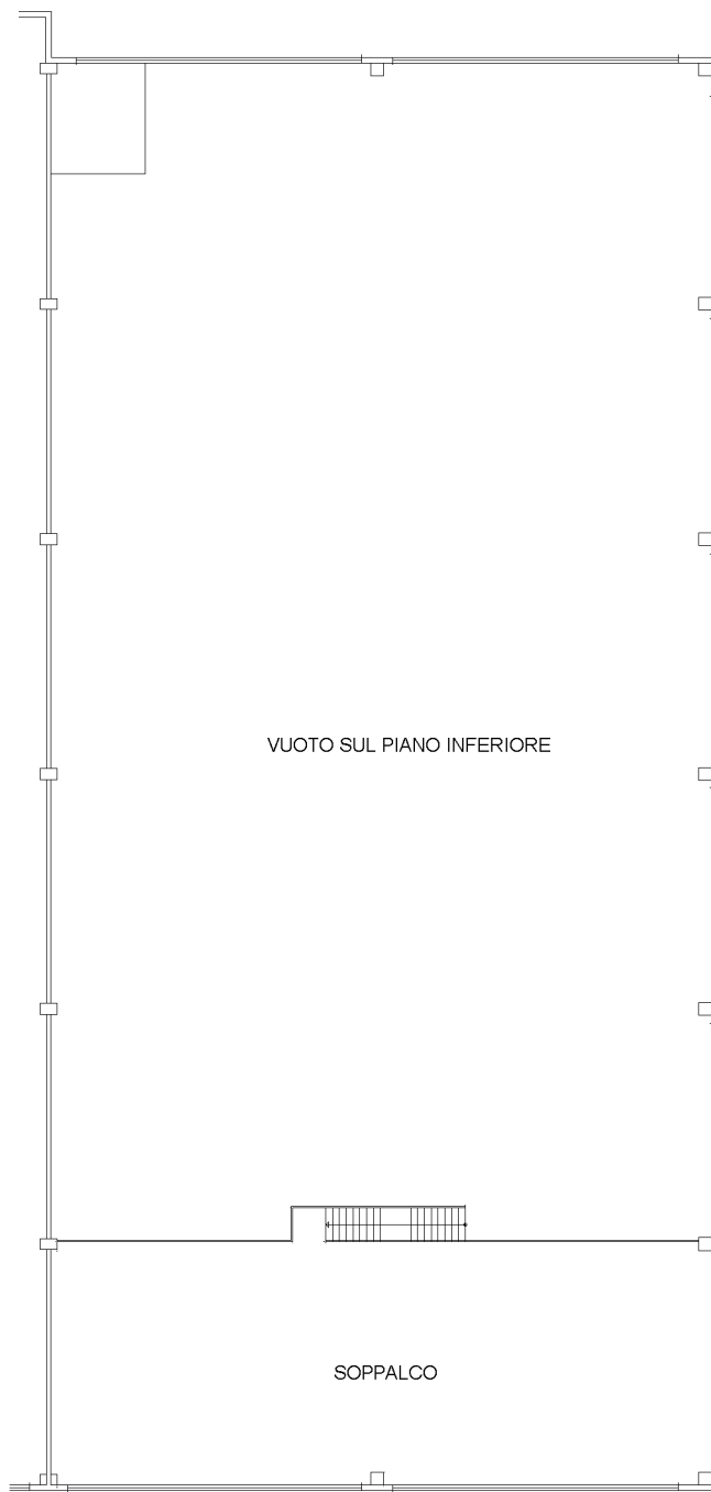
PIANTA PIANO PRIMO H=370