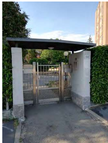
Vista ingresso complesso immobiliare, vista del contesto