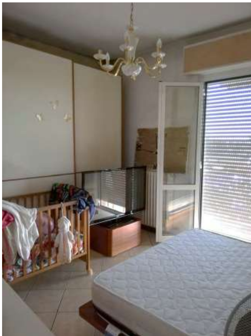
Camere e bagno