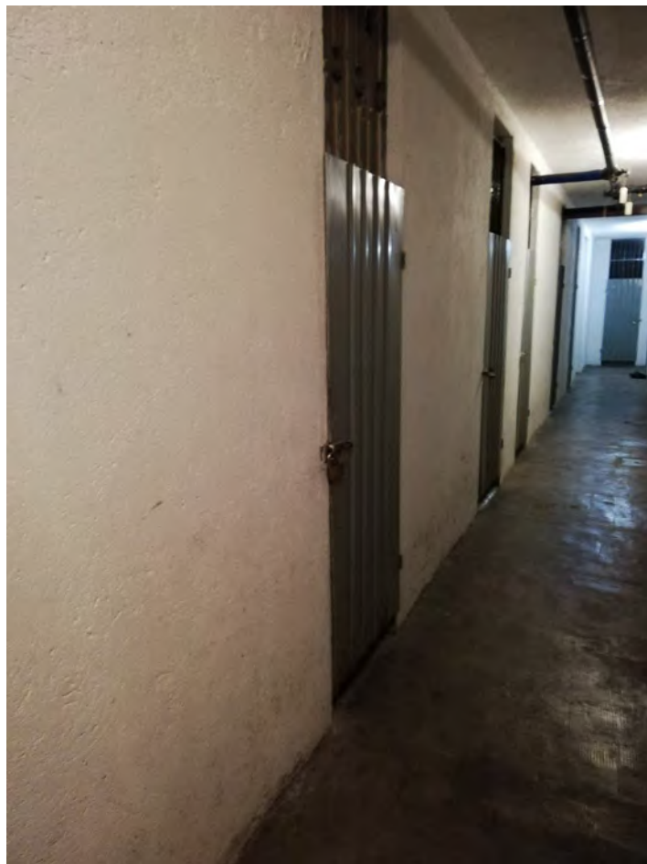
Cantina e box