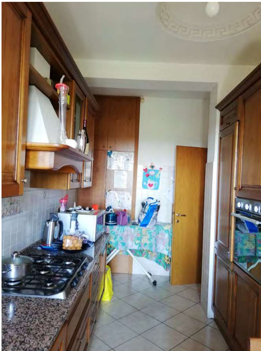
Cucina e balconi