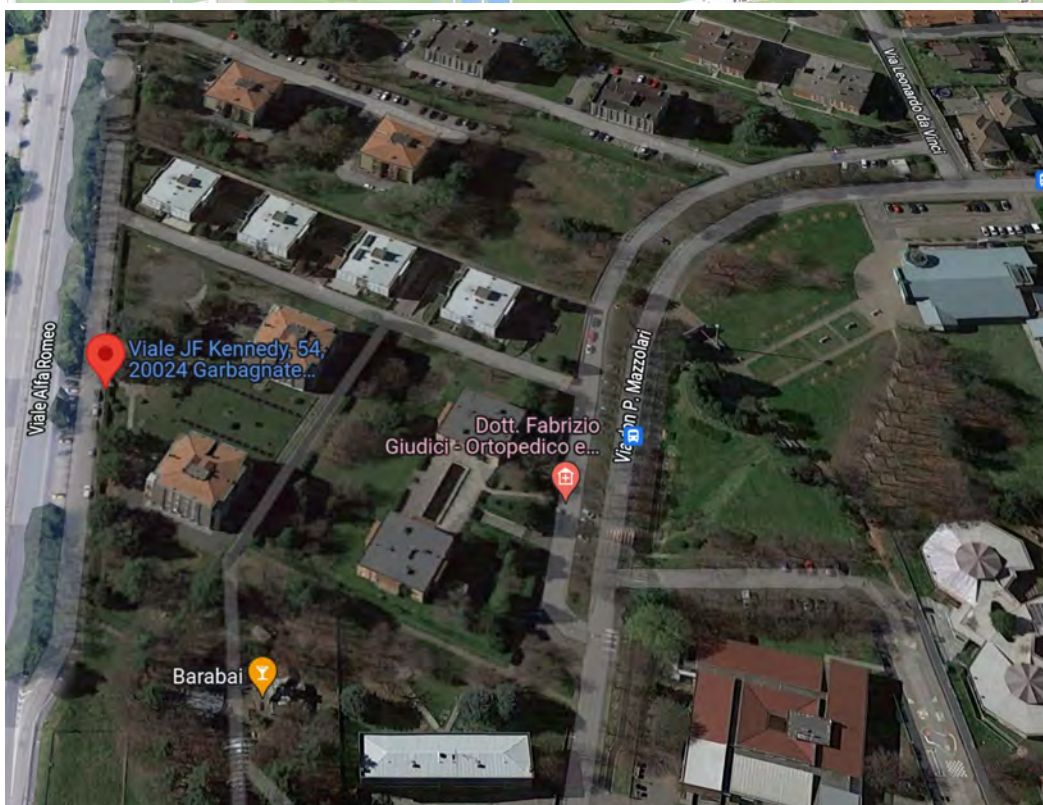
Inquadramento territoriale - vista aerea del fabbricato