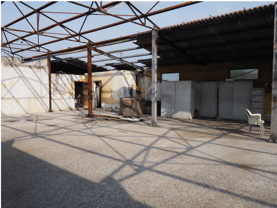
Caorle, strada Riello n. 2 – L'interno del capannone.