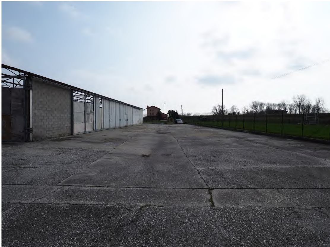
Caorle, strada Riello n. 2 – Lo scoperto - area di manovra.