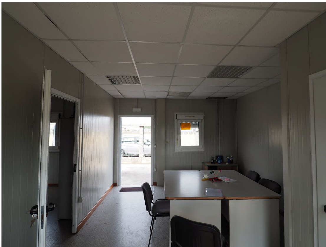
Caorle, strada Riello n. 2 - Il locale ufficio 1.