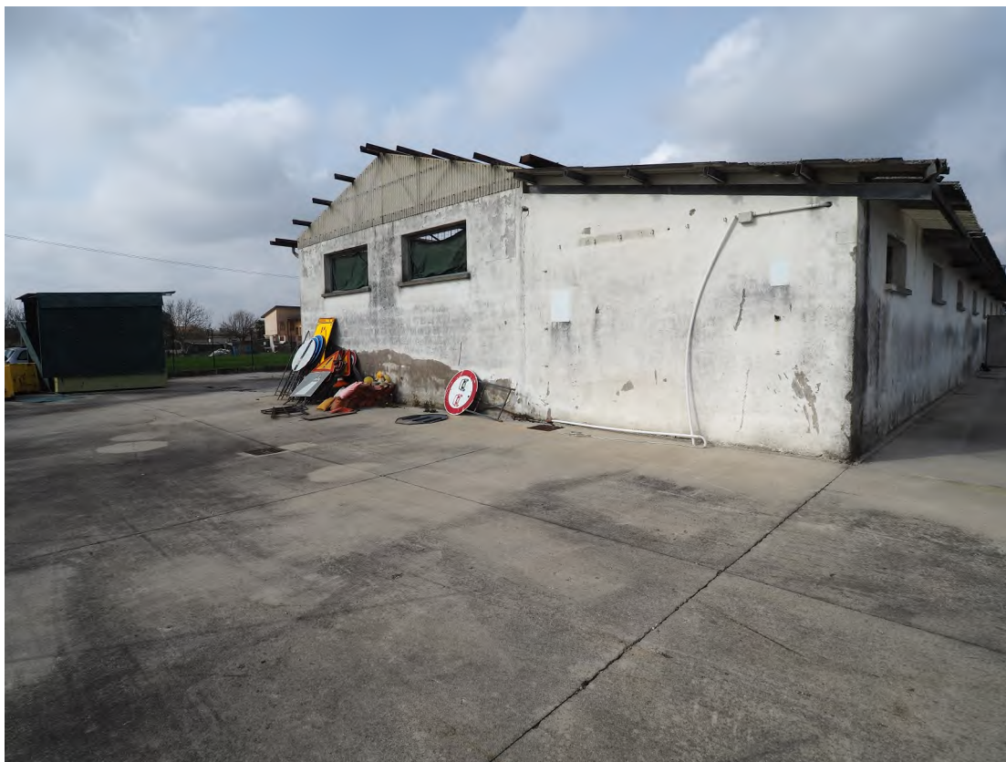
Caorle, strada Riello n. 2 – Il prospetto est del capannone industriale e lo scoperto - area di manovra.