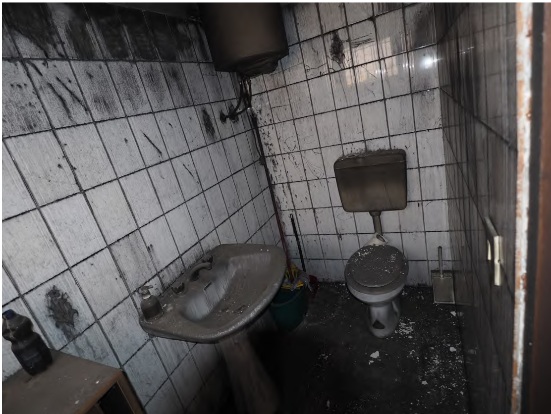
Caorle, strada Riello n. 2 - Il locale wc .