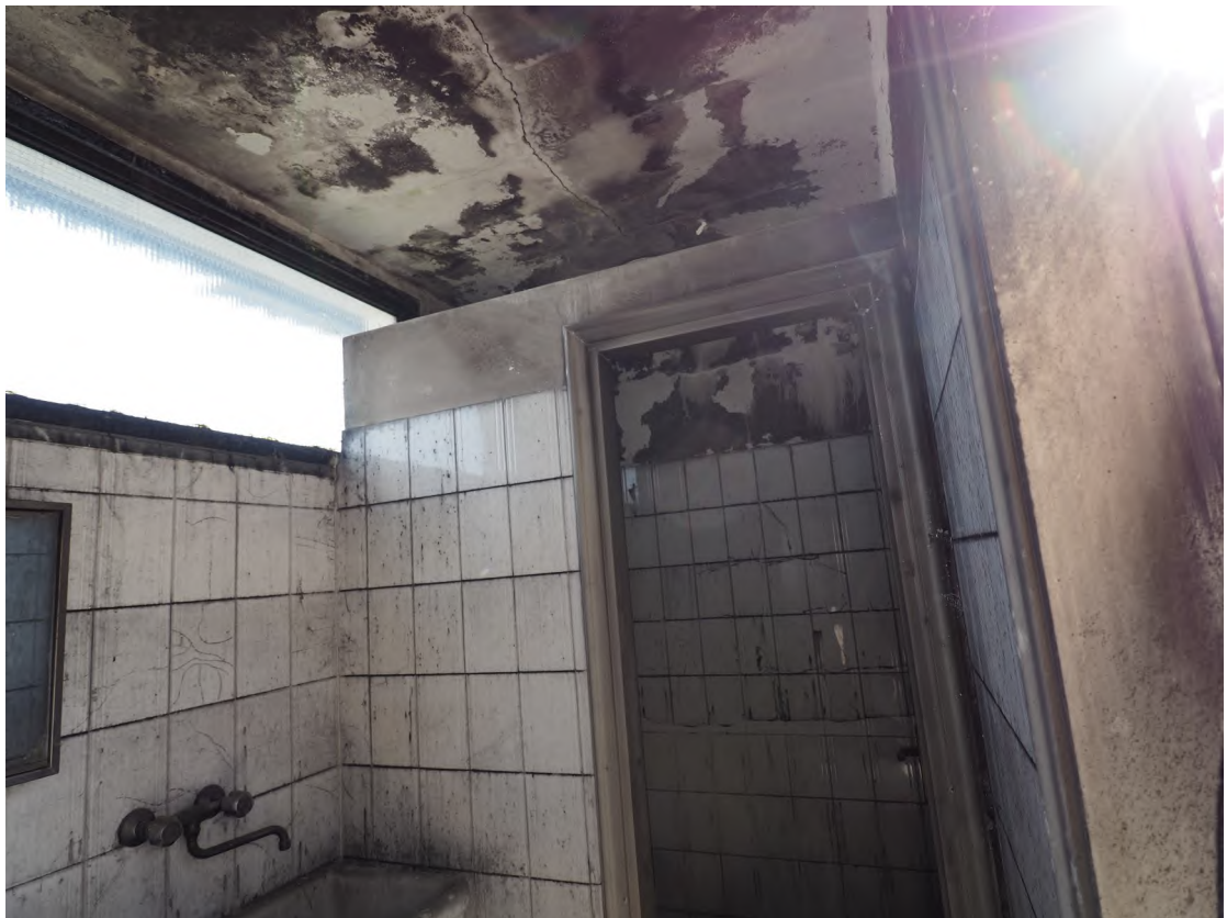
Caorle, strada Riello n. 2 - I locali wc e l'anti bagno.