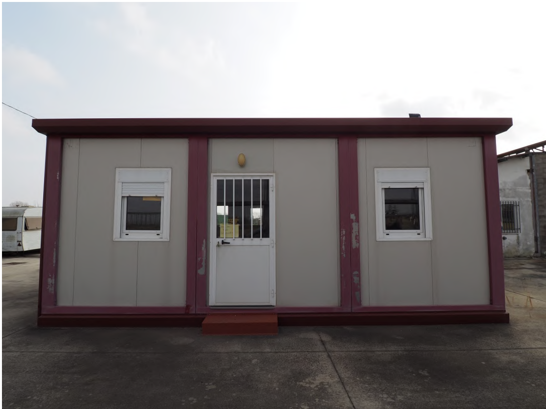
Caorle, strada Riello n. 2 - Il prefabbricato.