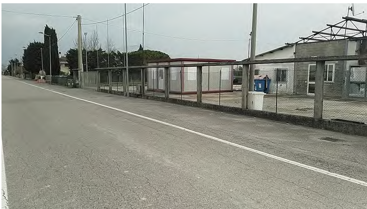
Caorle, strada Riello n. 2 - L'ingresso al capannone industriale.