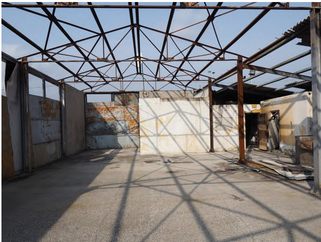
Caorle, strada Riello n. 2 – L'interno del capannone.