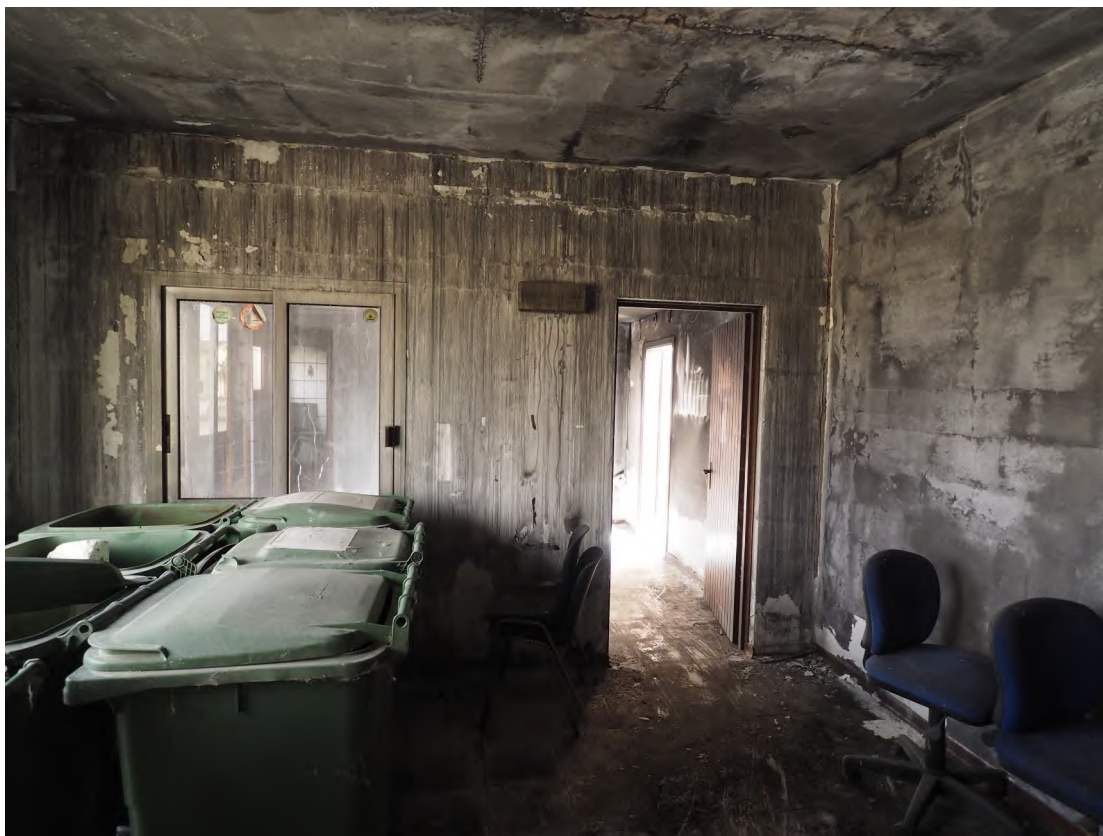
Caorle, strada Riello n. 2 - Il locale con destinazione ufficio.