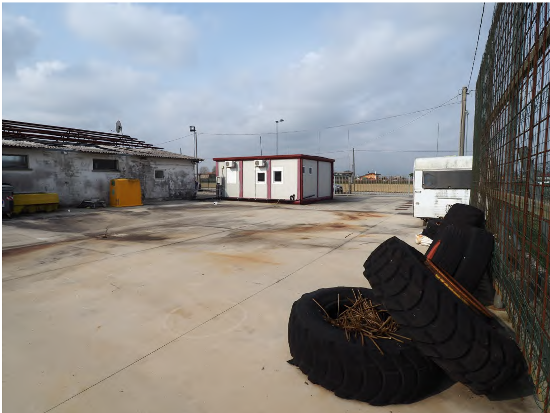
Caorle, strada Riello n. 2 – Il prospetto nord del capannone industriale, il prefabbricato e lo scoperto - area di manovra.