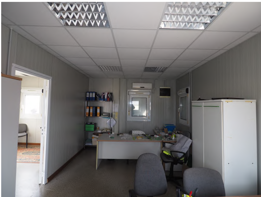
Caorle, strada Riello n. 2 - Il locale ufficio 2.