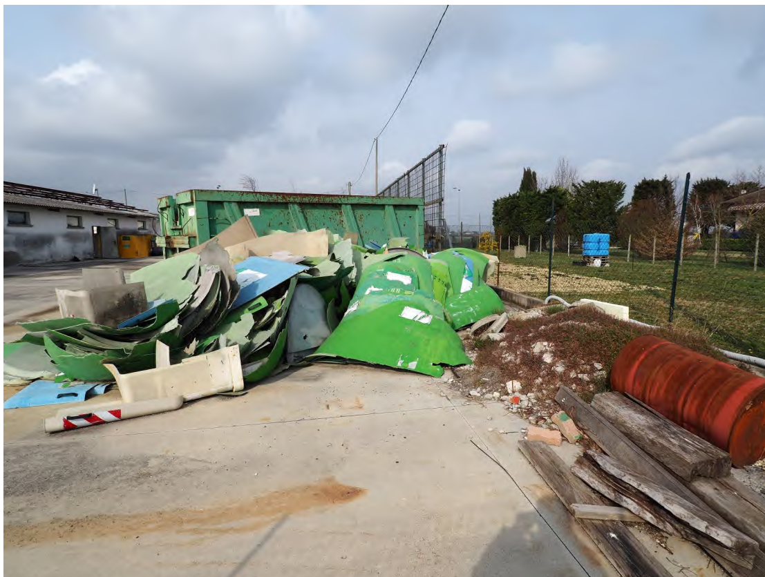
Caorle, strada Riello n. 2 – Lo scoperto - area di manovra.