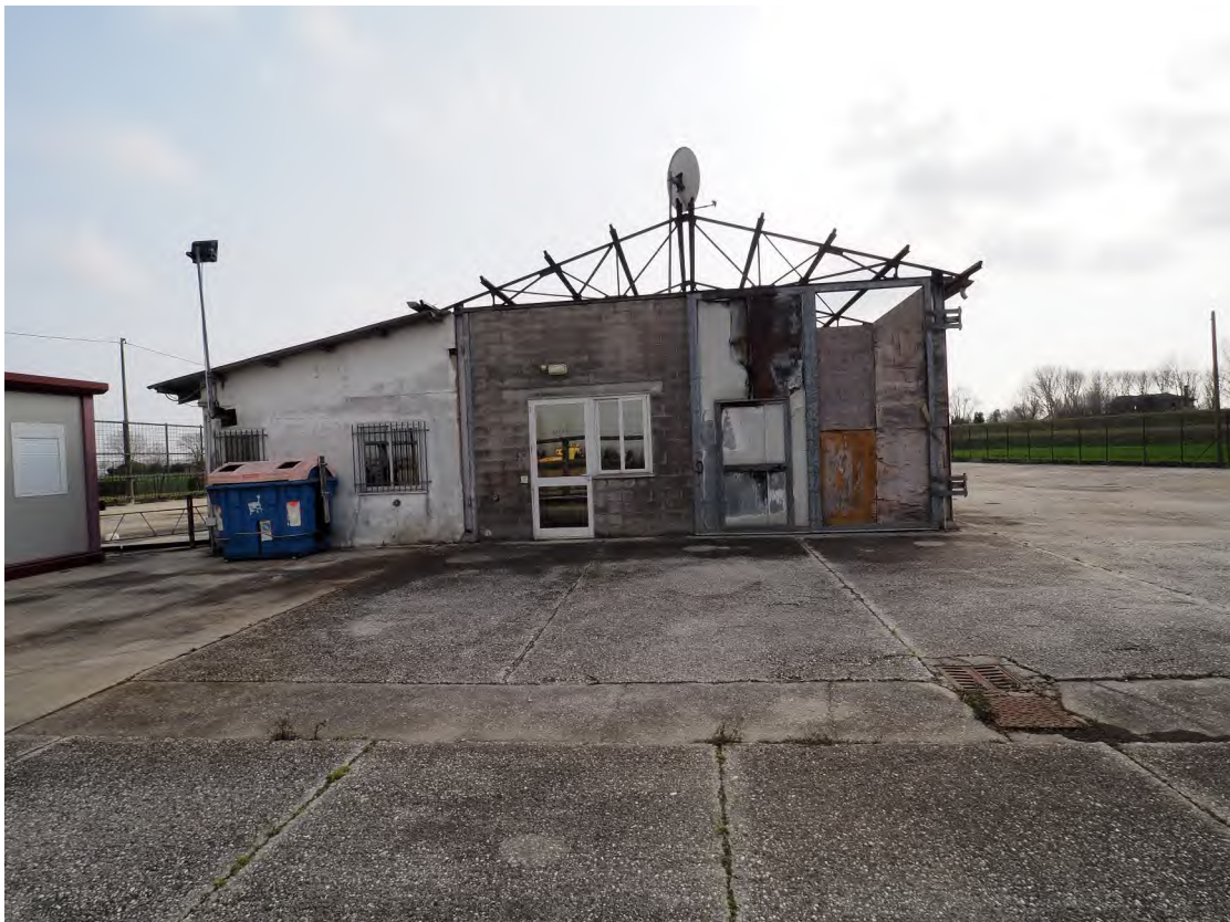
Caorle, strada Riello n. 2 - Sopra vista dall'alto del capannone industriale, sotto il prospetto ovest del fabbricato.