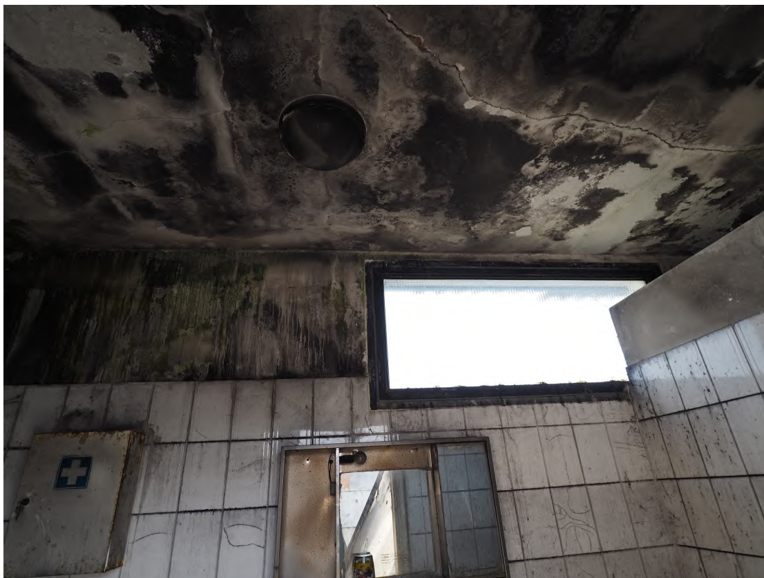
Caorle, strada Riello n. 2 - I locali wc e l'anti bagno.