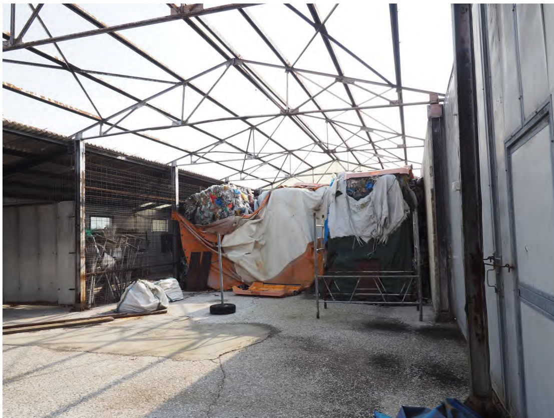
Caorle, strada Riello n. 2 – L'interno del capannone.