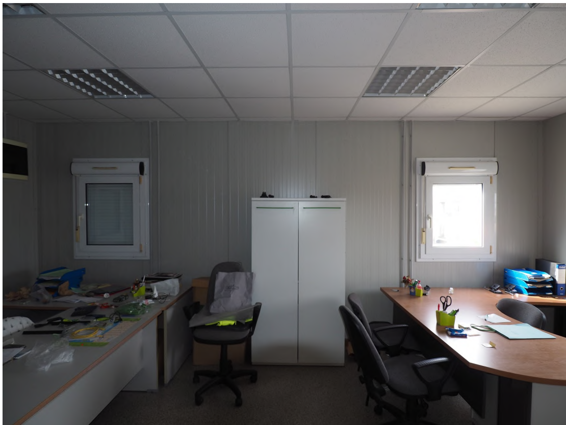
Caorle, strada Riello n. 2 - Il locale ufficio 2.