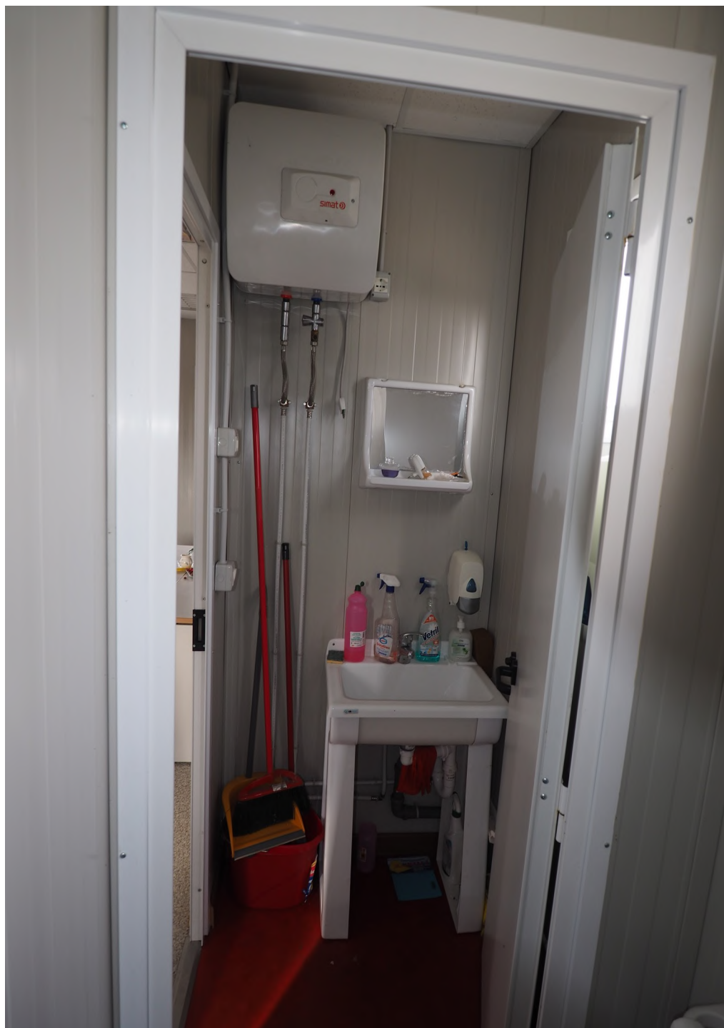
Caorle, strada Riello n. 2 - Il locale wc e l'anti bagno.