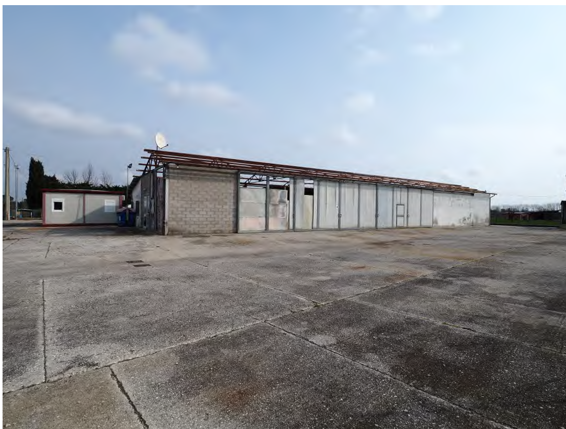
Caorle, strada Riello n. 2 – Il prospetto sud del capannone industriale e lo scoperto - area di manovra.