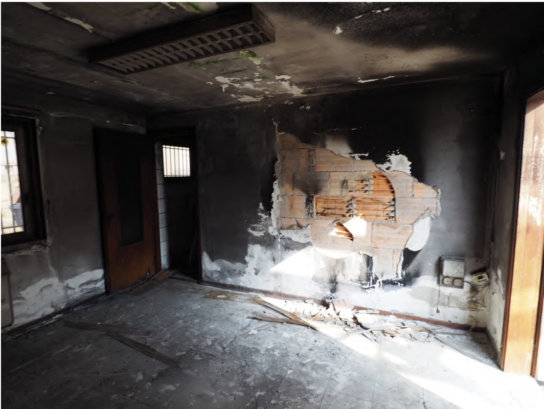
Caorle, strada Riello n. 2 - Il locale con destinazione ufficio.