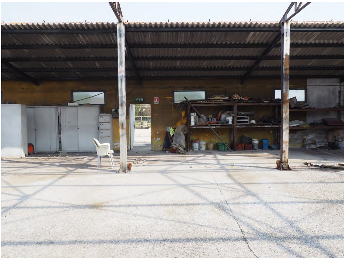
Caorle, strada Riello n. 2 – L'interno del capannone.