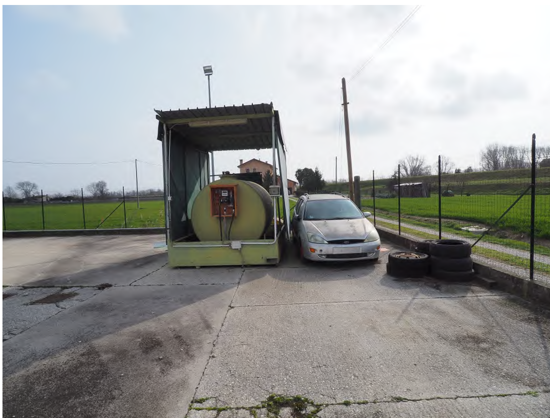
Caorle, strada Riello n. 2 – Lo scoperto - area di manovra.