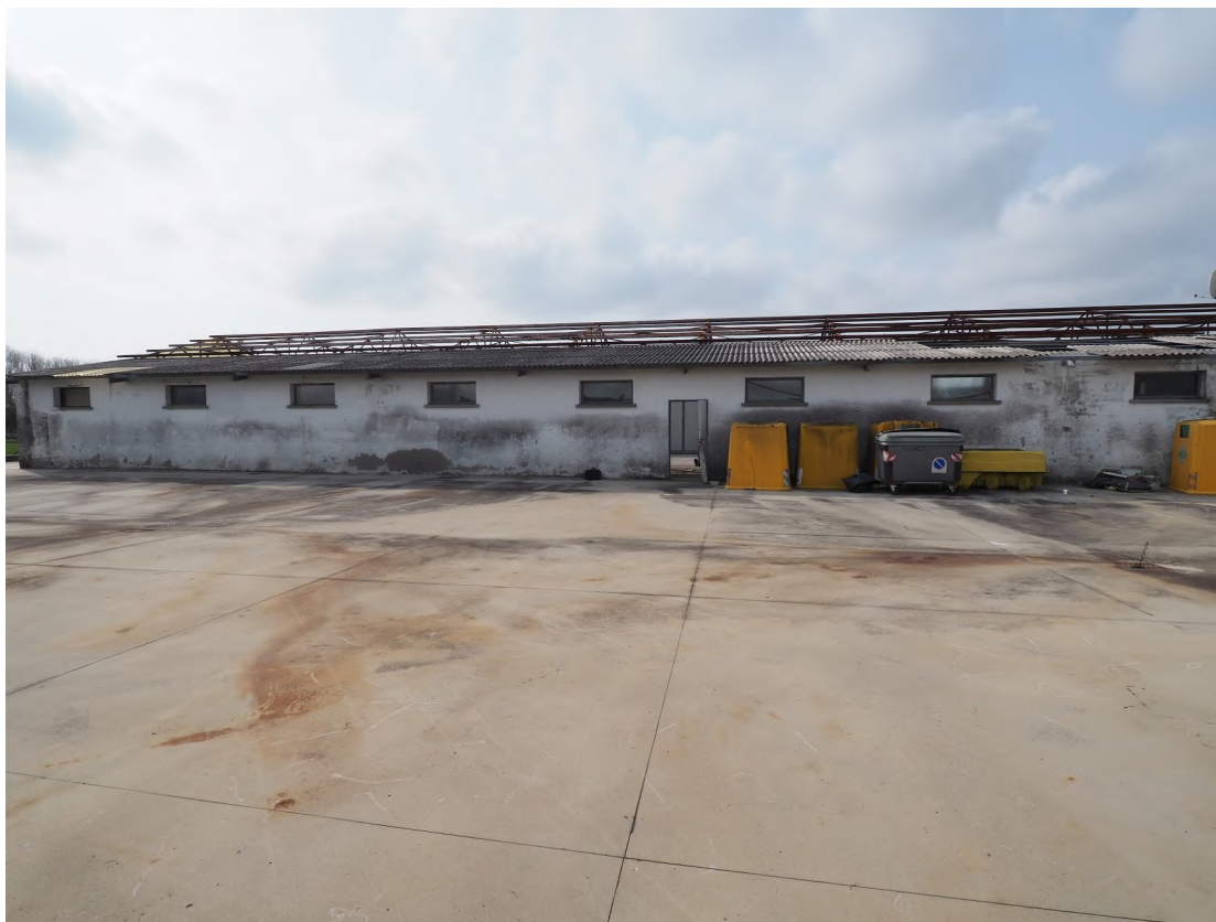
Caorle, strada Riello n. 2 – Il prospetto nord del capannone industriale e lo scoperto - area di manovra.