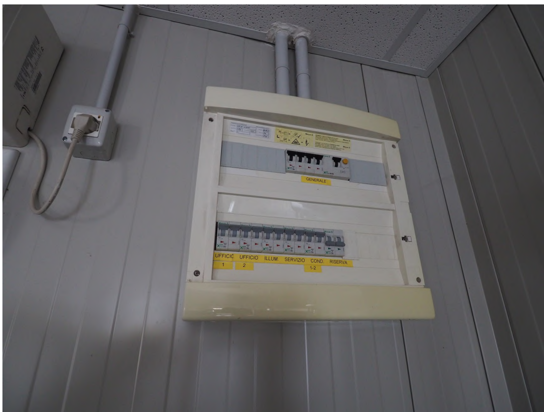
Caorle, strada Riello n. 2 – I particolari dell'impianto elettrico del prefabbricato.