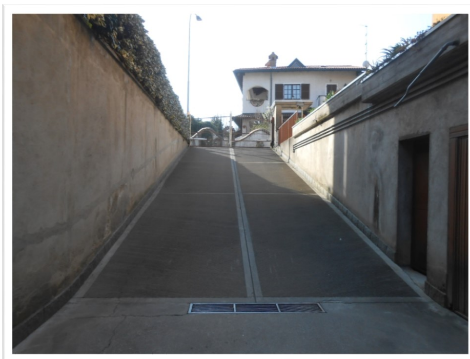
Foto 2 rampa di accesso ai box