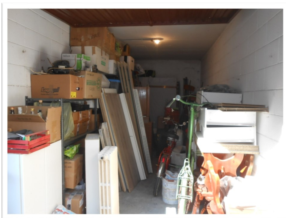
Foto 6 box