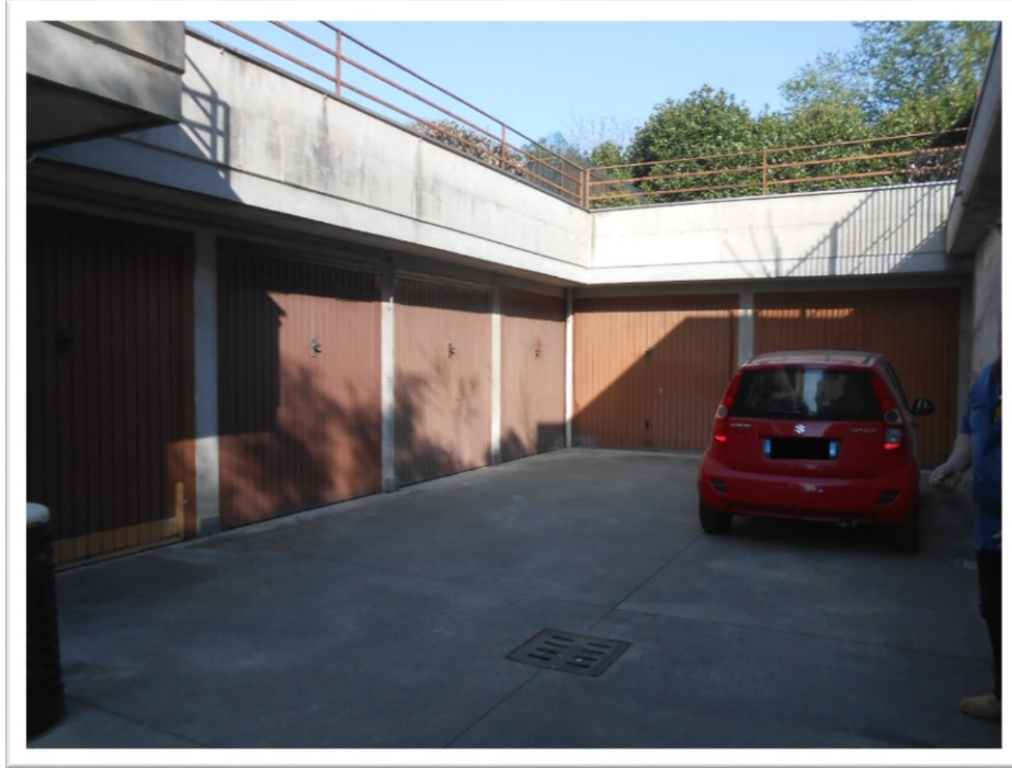
Foto 3 parti comuni box