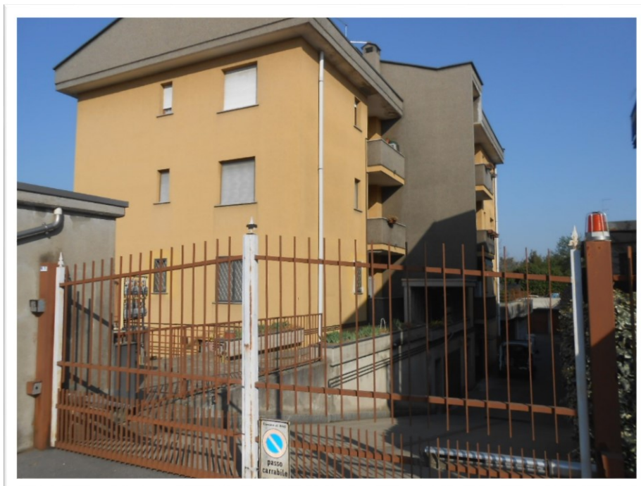
Foto 1 vista dell'edificio