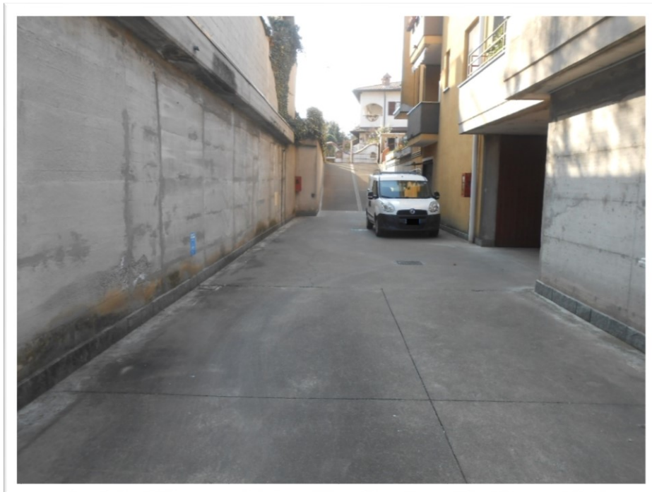
Foto 4 parti comuni box