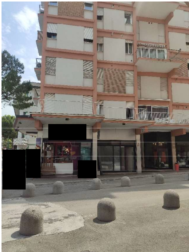
FOTO N. 4- prospetto ovest del condominio