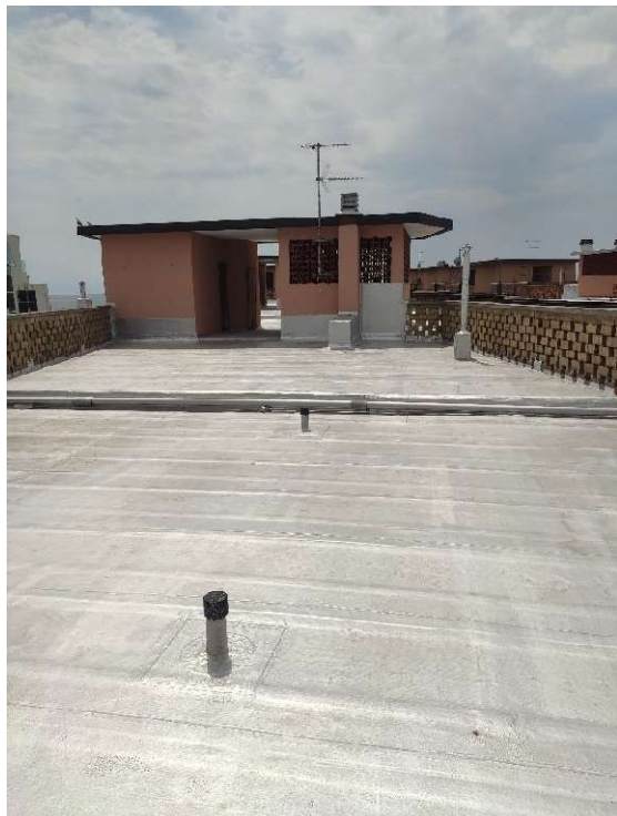
FOTO N. 22- copertura del condominio