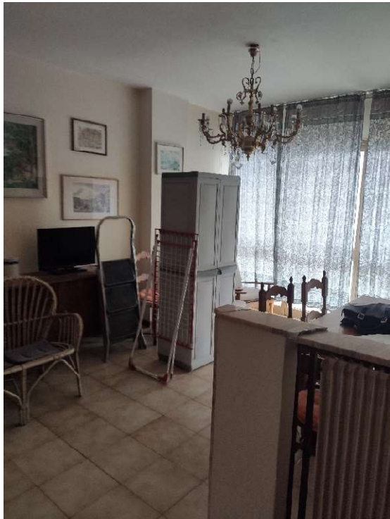
FOTO N. 11- vista interna dell'appartamento