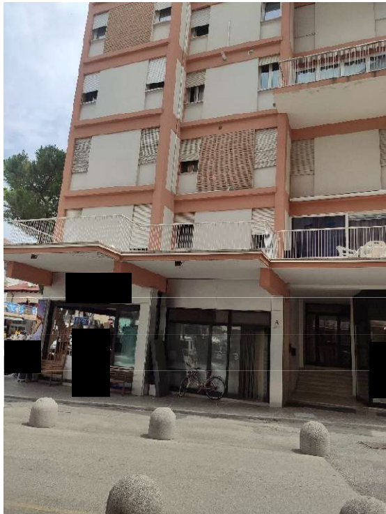
FOTO N. 5- prospetto ovest e ingresso del condominio