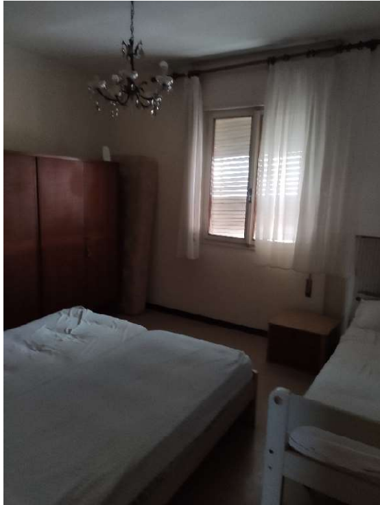
FOTO N. 15- vista interna dell'appartamento