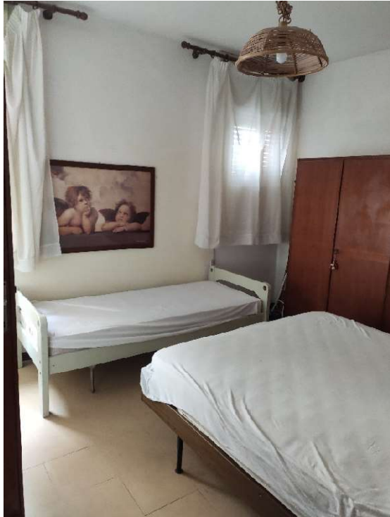
FOTO N. 17- vista interna dell'appartamento