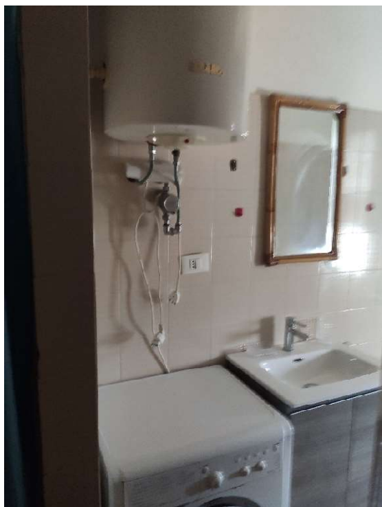
FOTO N. 19- vista interna dell'appartamento