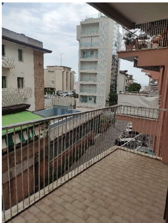
FOTO N. 21- vista dal poggiolo del soggiorno