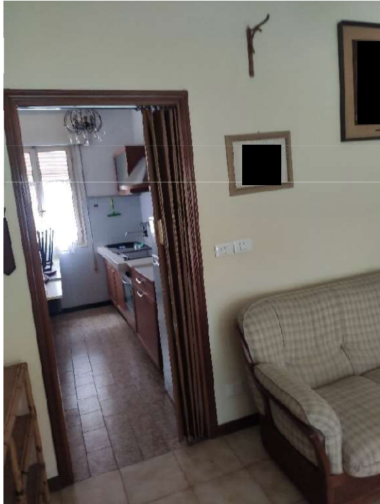
FOTO N. 13- vista interna dell'appartamento