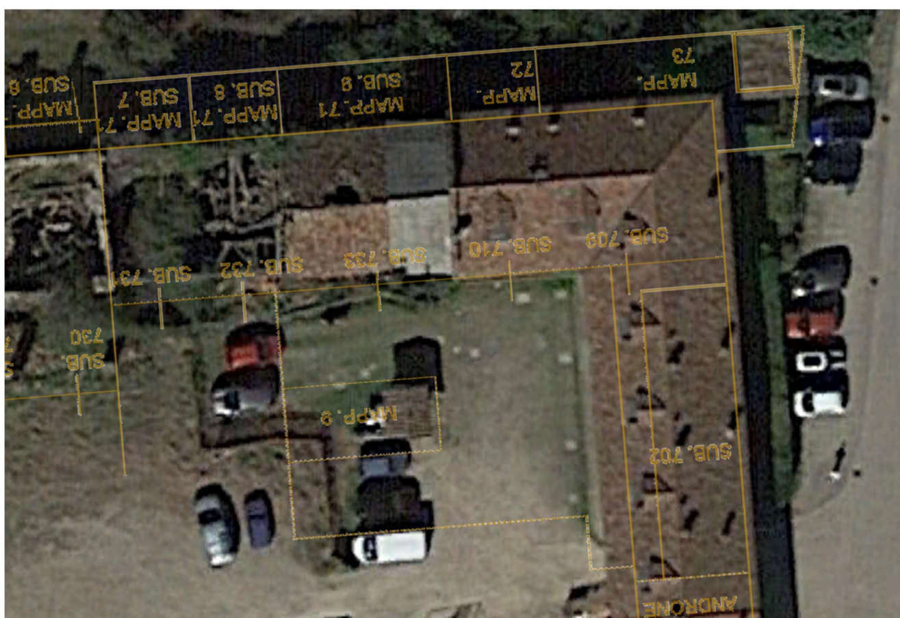
Foto n. 2 – Veduta satellitare con indicata la posizione del sub. 732 e sub. 8