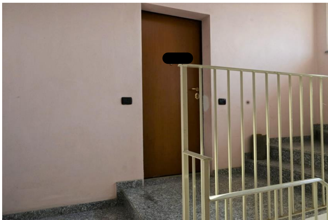
PIANEROTTOLO – INGRESSO APPARTAMENTO