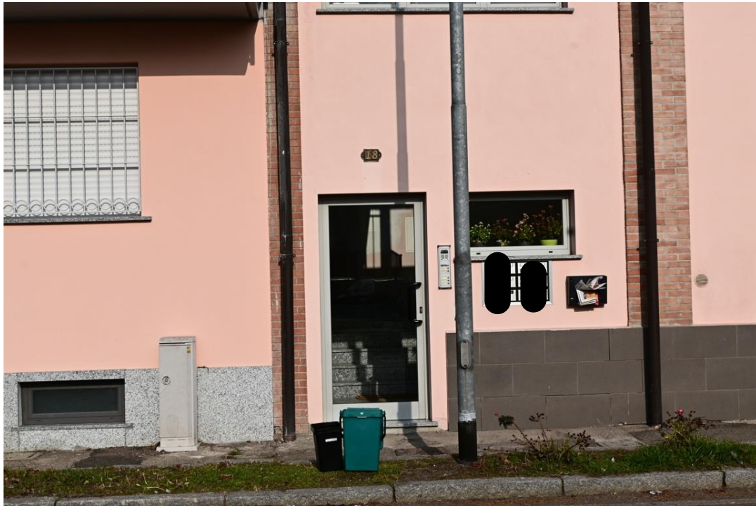
INGRESSO EDIFICIO n. civico 18

R.G.E. n°857/2021 ARLUNO (MI) Via Matteotti n°20 → (n°18) Appartamento piano primo + cantina S1