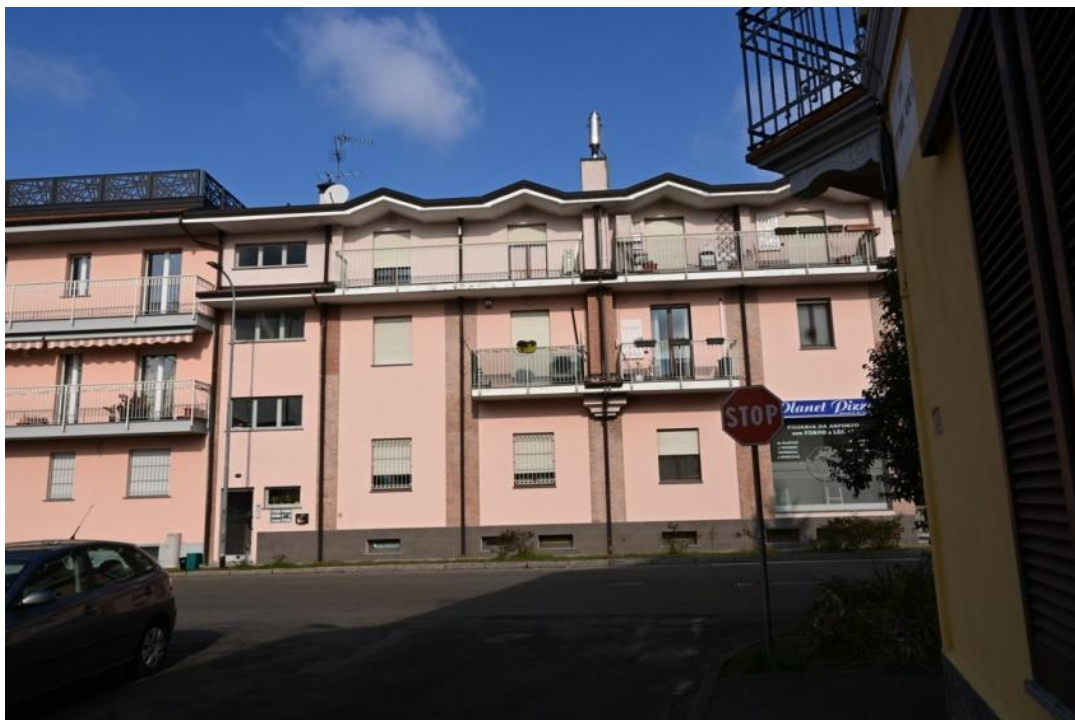
PROSPETTO ESTERNO SU VIA MATTEOTTI