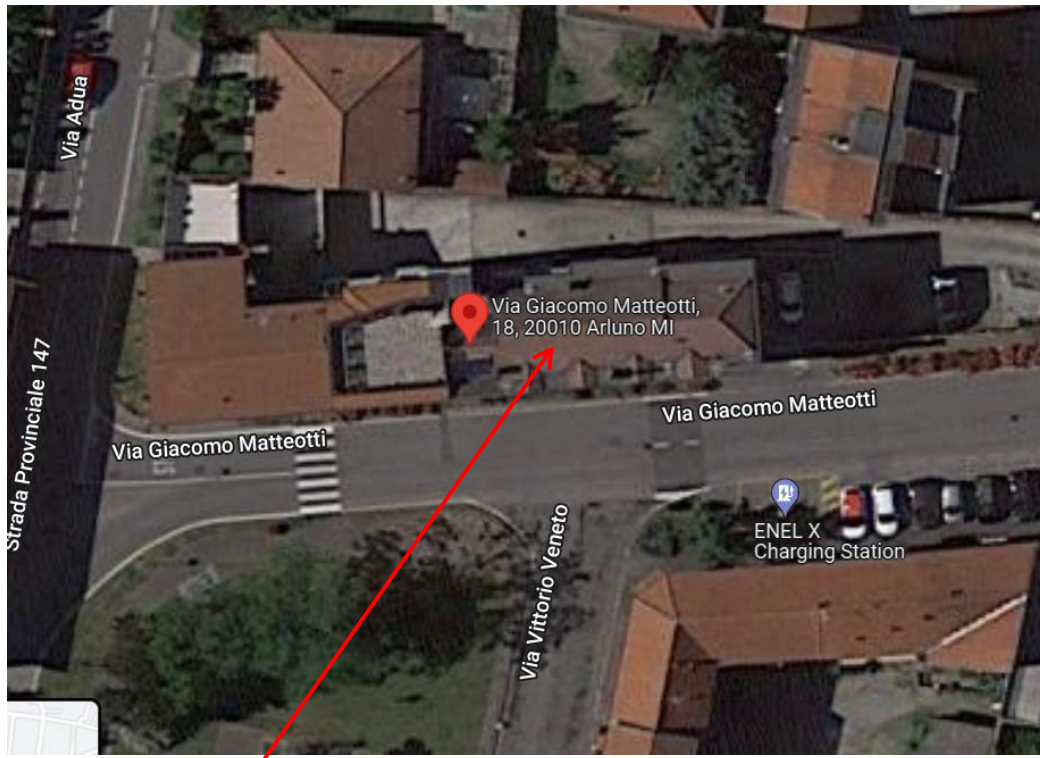
ARLUNO - VIA MATTEOTTI n°18

R.G.E. n°857/2021 ARLUNO (MI) Via Matteotti n°20 → (n°18) Appartamento piano primo + cantina S1