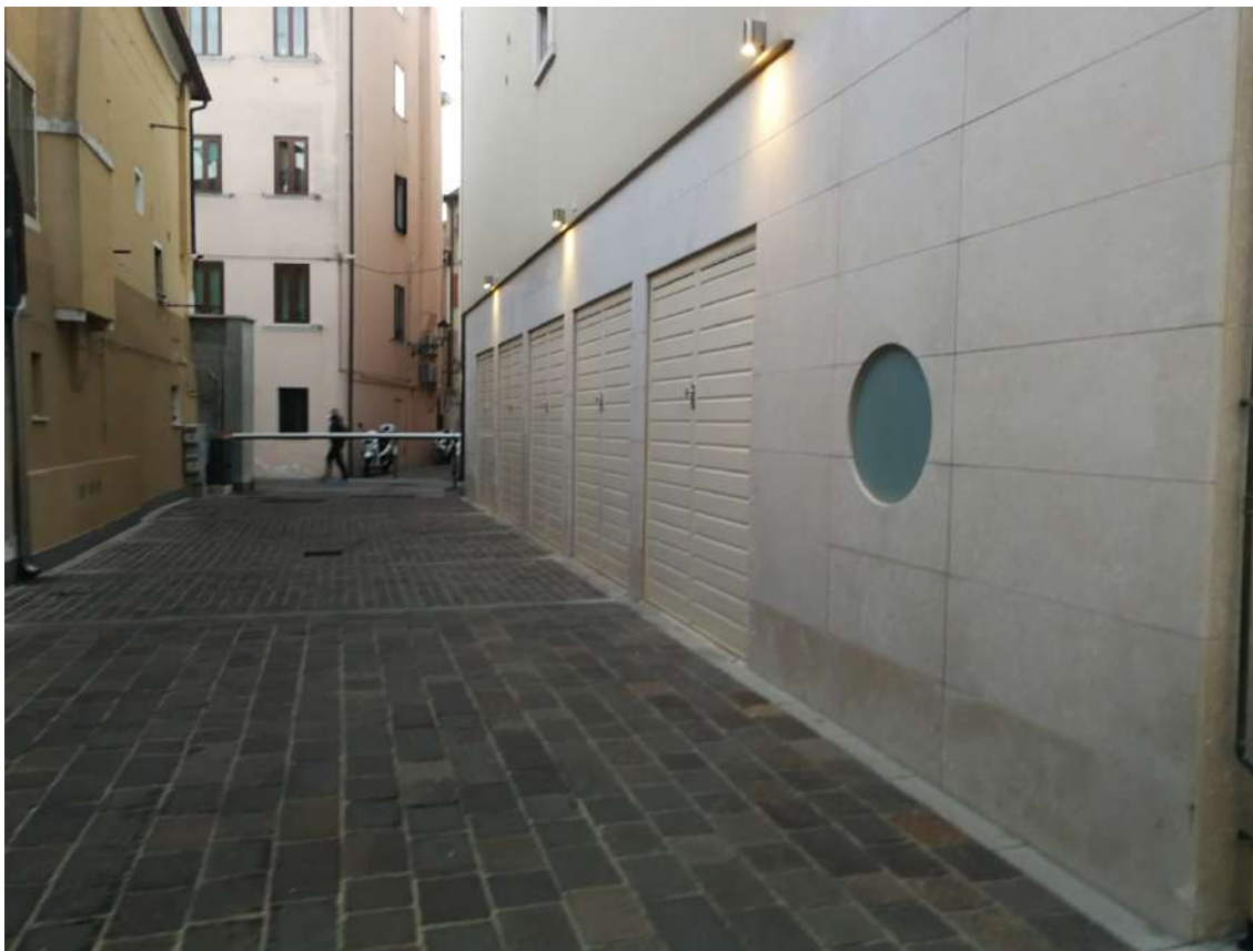
Fotografia n. 09 – Garages del primo edificio nel lato opposto a quello dei garages oggetto di stima (ripresa dal fondo della strada pavimentata)