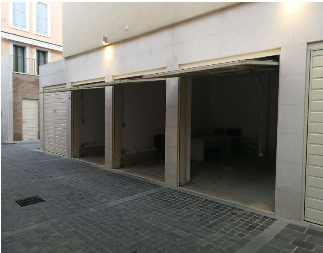
Fotografia n. 12 – Garages oggetto di stima