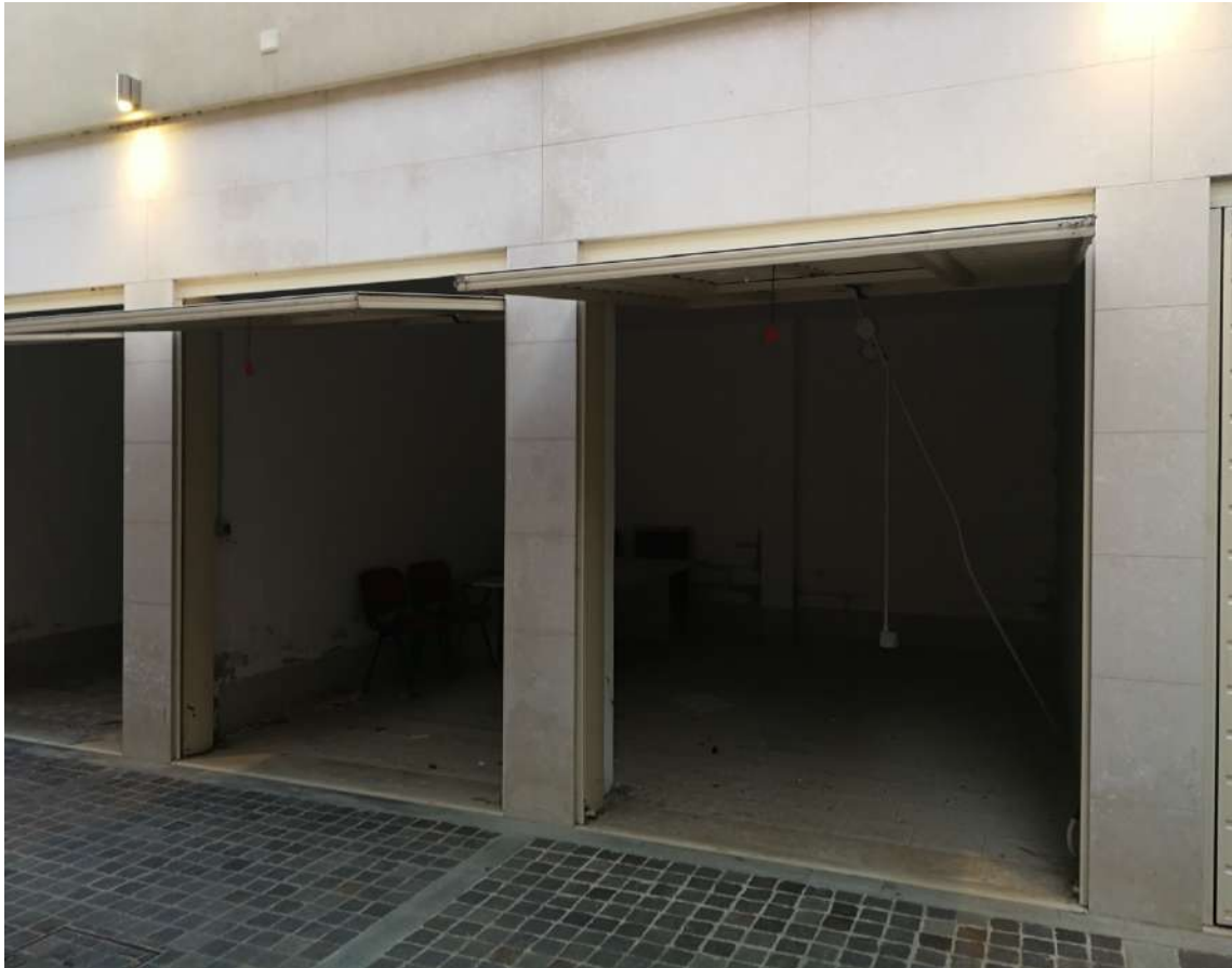
Fotografia n. 15 – Lotto n° 2 – Garages aperti