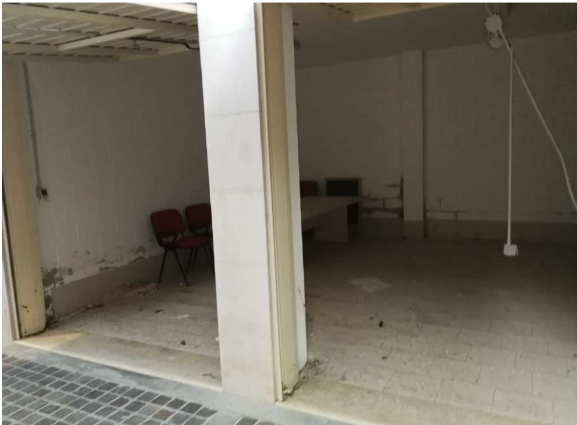
Fotografia n. 16 – Lotto n° 2 – Interno dei garages con evidente mancanza della parete divisoria tra le 2 unità immobiliari (abuso da ripristinare in status ante)