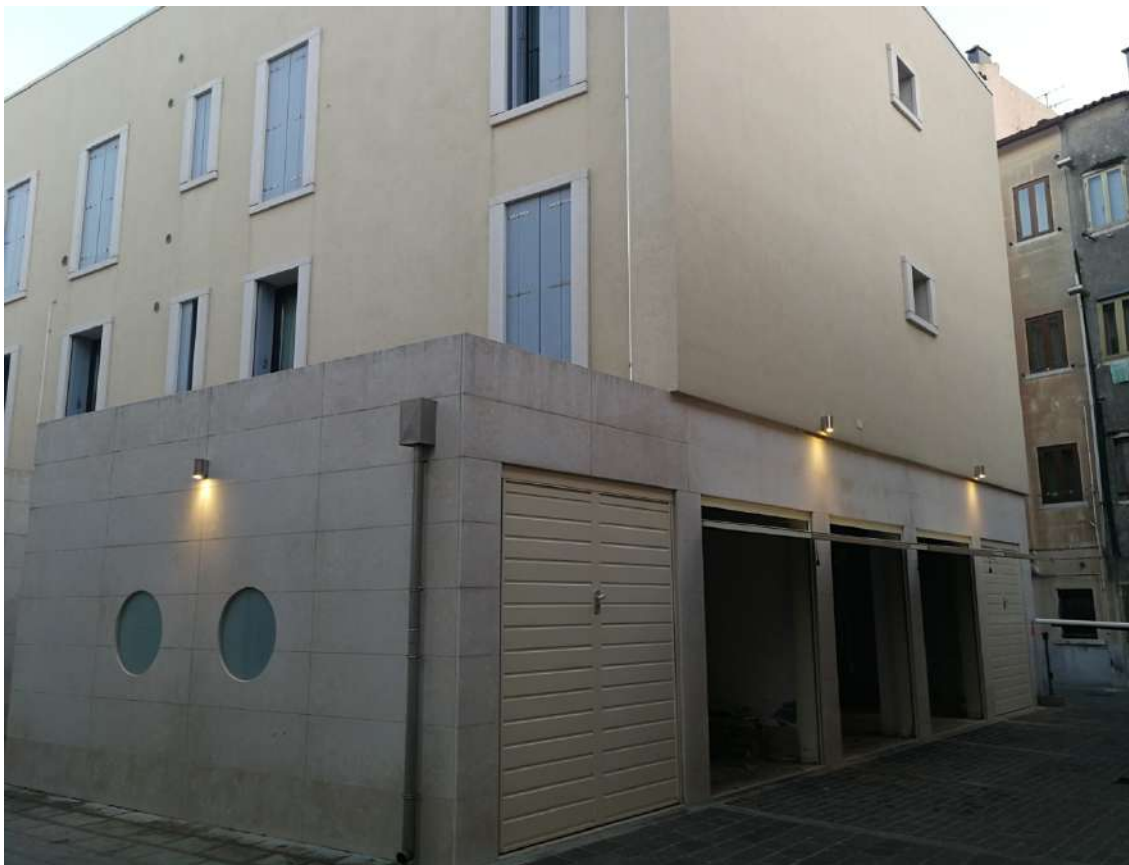
Fotografia n. 07 – Garages oggetto di stima (con portone ribaltabile aperto) nel primo edificio lungo Calle S. Croce