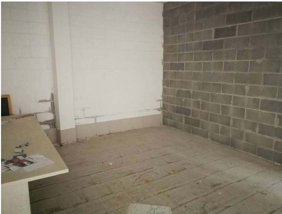
Fotografia n. 17 – Lotto n° 2 – Particolare della pavimentazione, della parete condominiale e della parete divisoria verso il primo garage dalla sbarra telecomandata