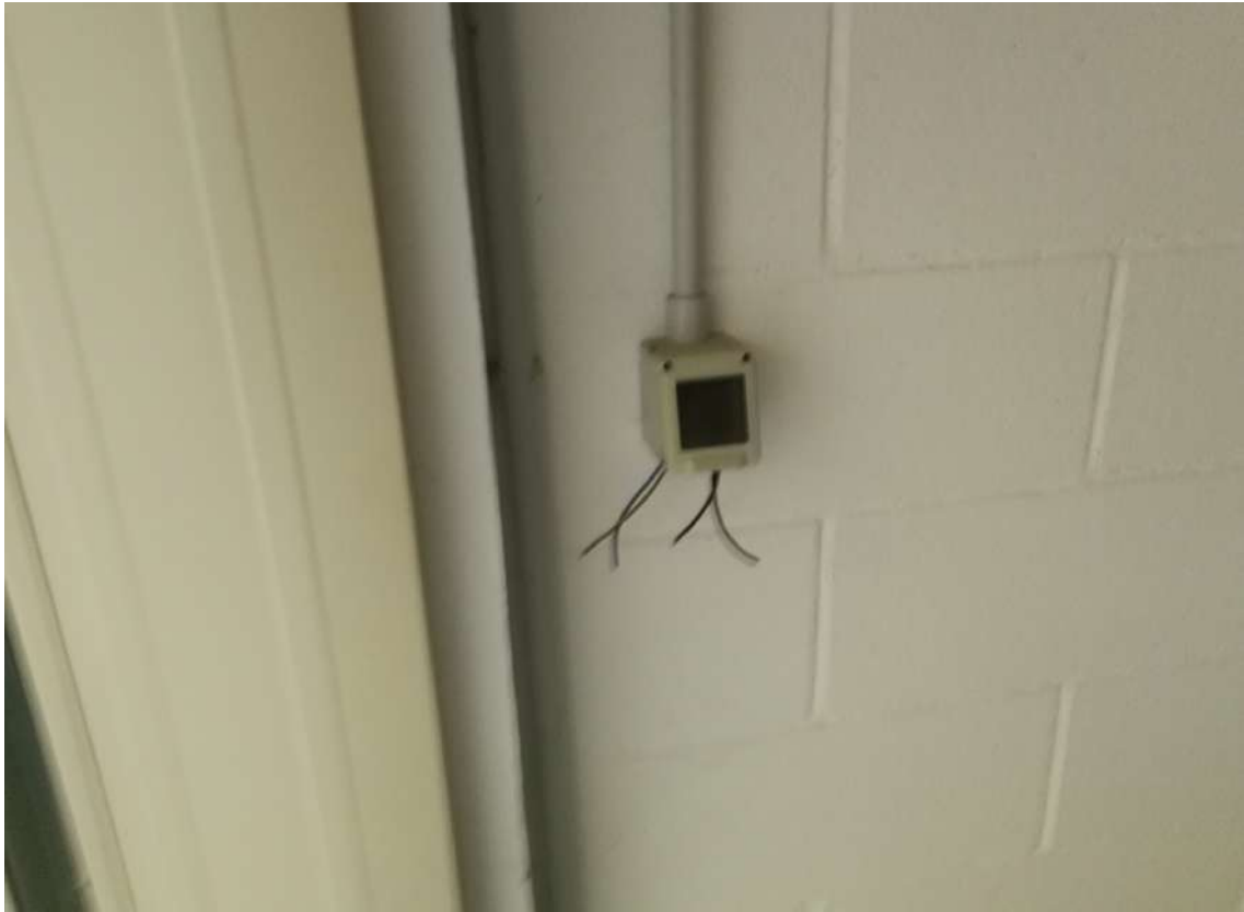
Fotografia n. 19 – Lotto n° 2 – Danneggiamento dell'impianto elettrico