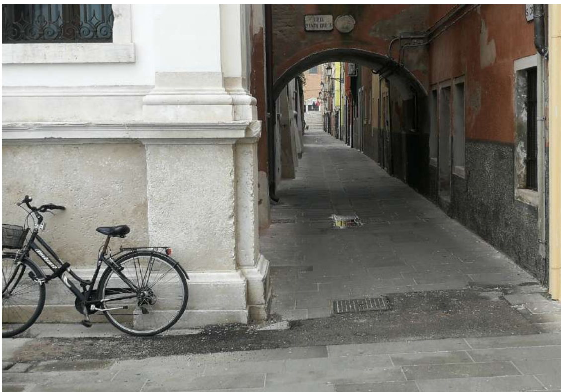
Fotografia n. 02 – Calle S. Croce vista da Ponte Vigo