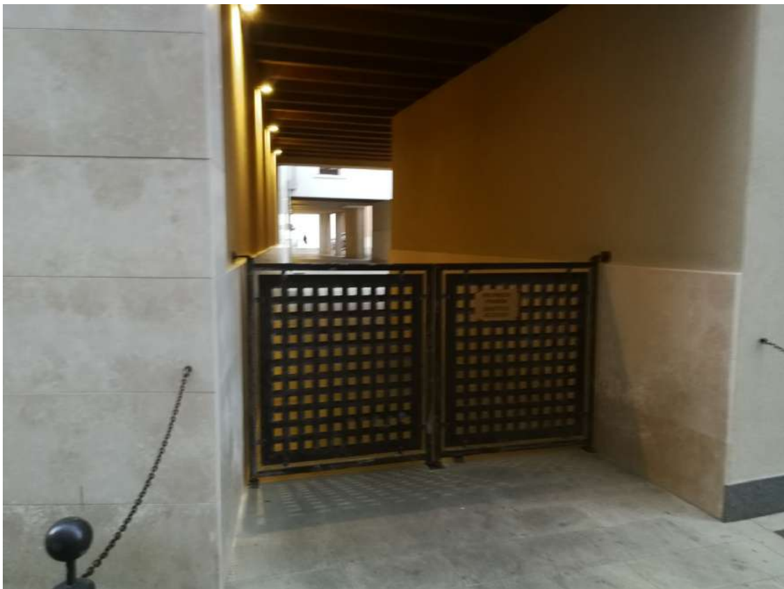
Fotografia n. 04 – Ingresso lungo Calle S. Croce all'edificio residenziale ove sono situati i garages