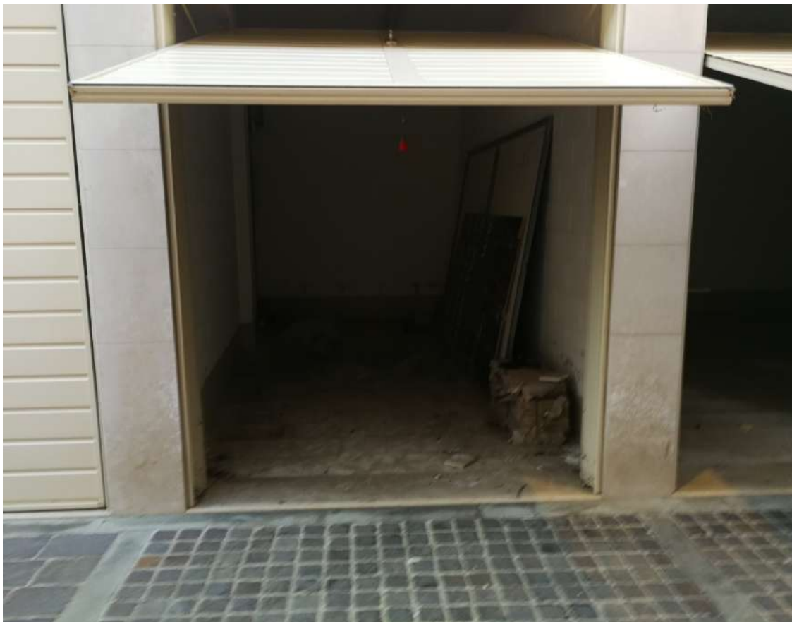
Fotografia n. 13 – Lotto n° 1 – Quarto garage a partire dalla sbarra telecomandata di ingresso