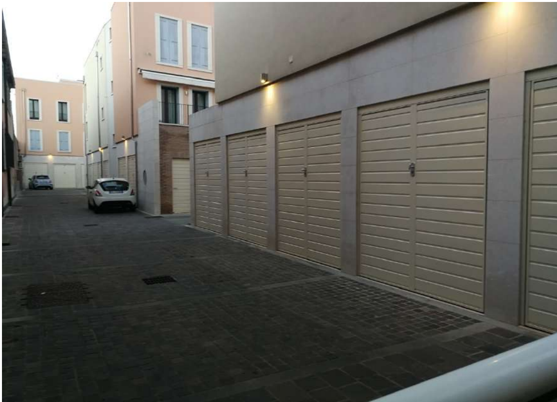
Fotografia n. 05 – Garages del primo edificio lungo Calle S. Croce nel complesso “Corte di Vigo”