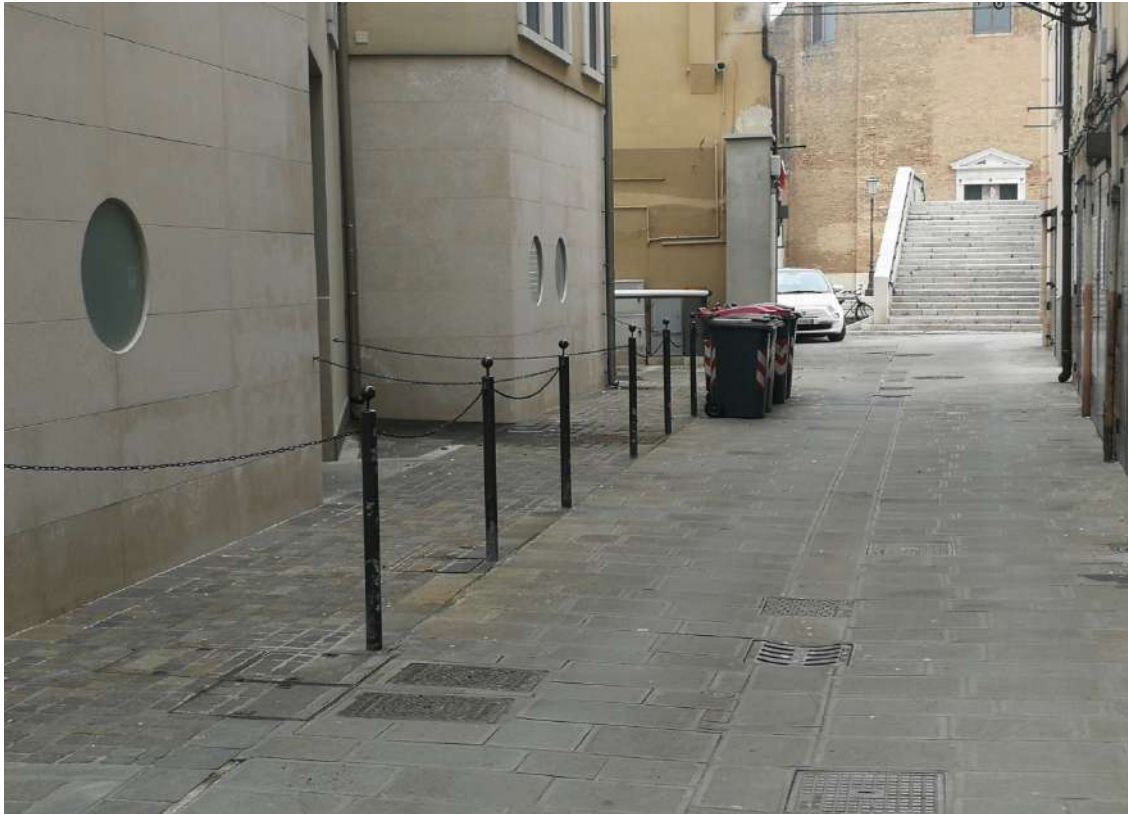
Fotografia n. 03 – Complesso “Corte di Vigo” lungo Calle S. Croce verso ponte S. Domenico