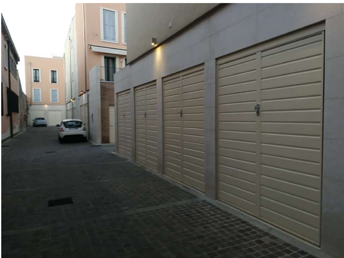
Fotografia n. 10 – Garages oggetto di stima