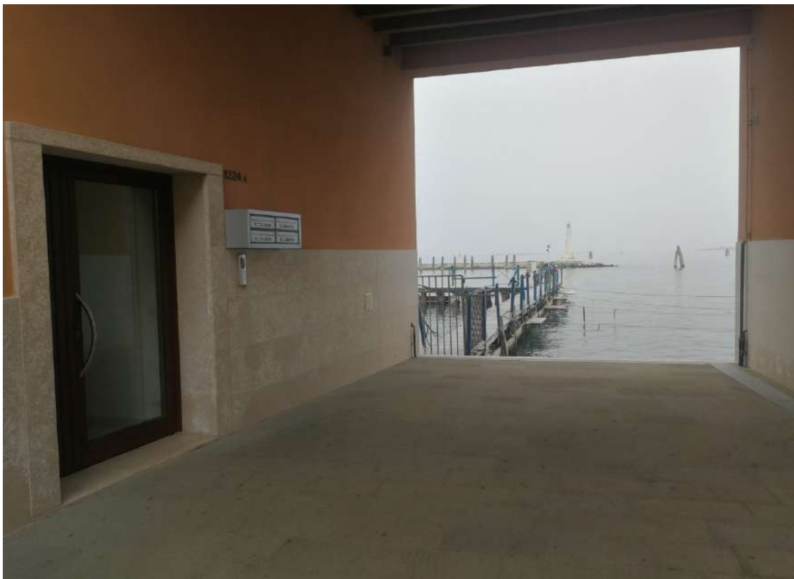
Fotografia n. 06 – Complesso “Corte di Vigo”, edificio fronte laguna