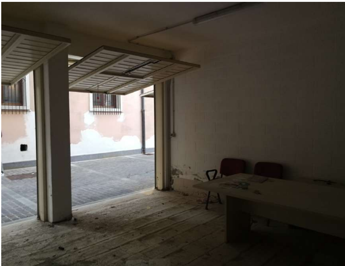
Fotografia n. 21 – Lotto n° 2 – Locale unico derivato dalle 2 unità immobiliari (secondo e terzo garage dalla sbarra telecomandata), con ripresa dall'interno dello stesso