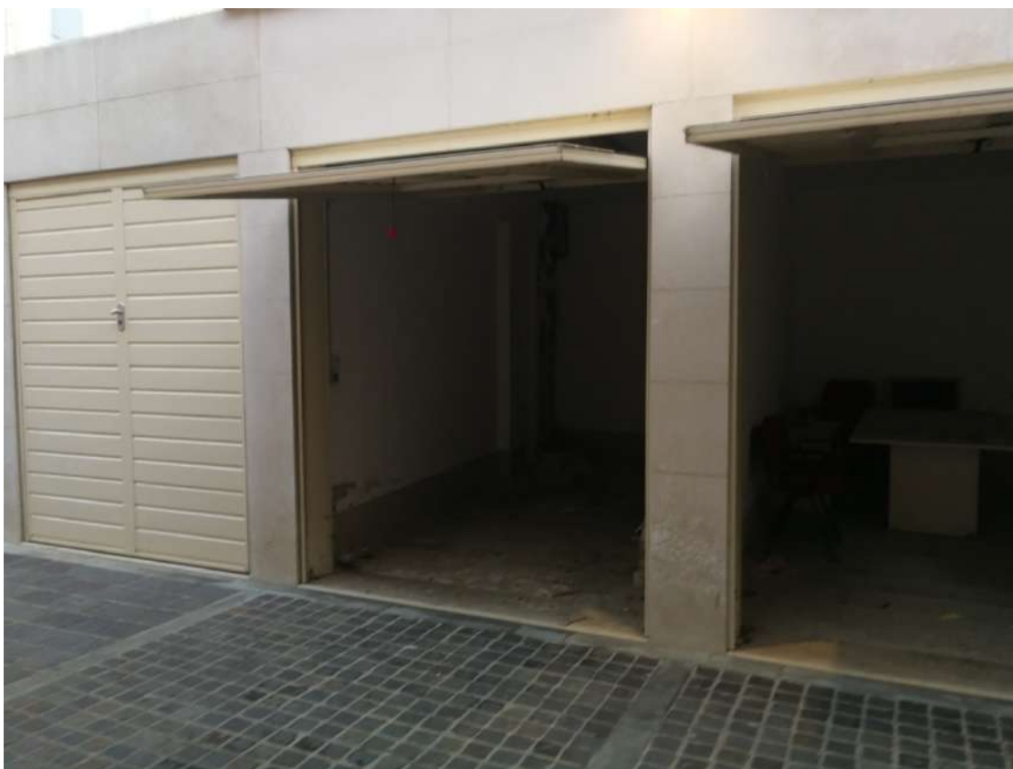
Fotografia n. 14 – Lotto n° 1 – Garage aperto, affiancato sulla destra da garages del lotto n° 2