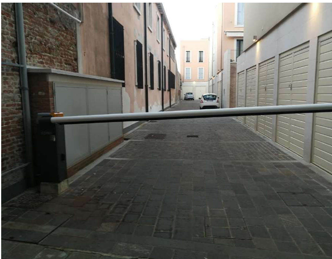
Fotografia n. 08 – Sbarra telecomandata di accesso ai garages con strada interna pavimentata