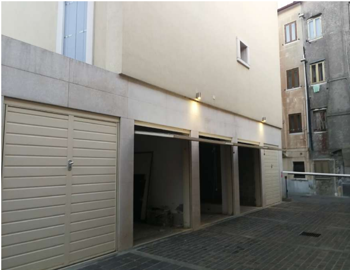
Fotografia n. 11 – Garages oggetto di stima con portone ribaltabile sollevato