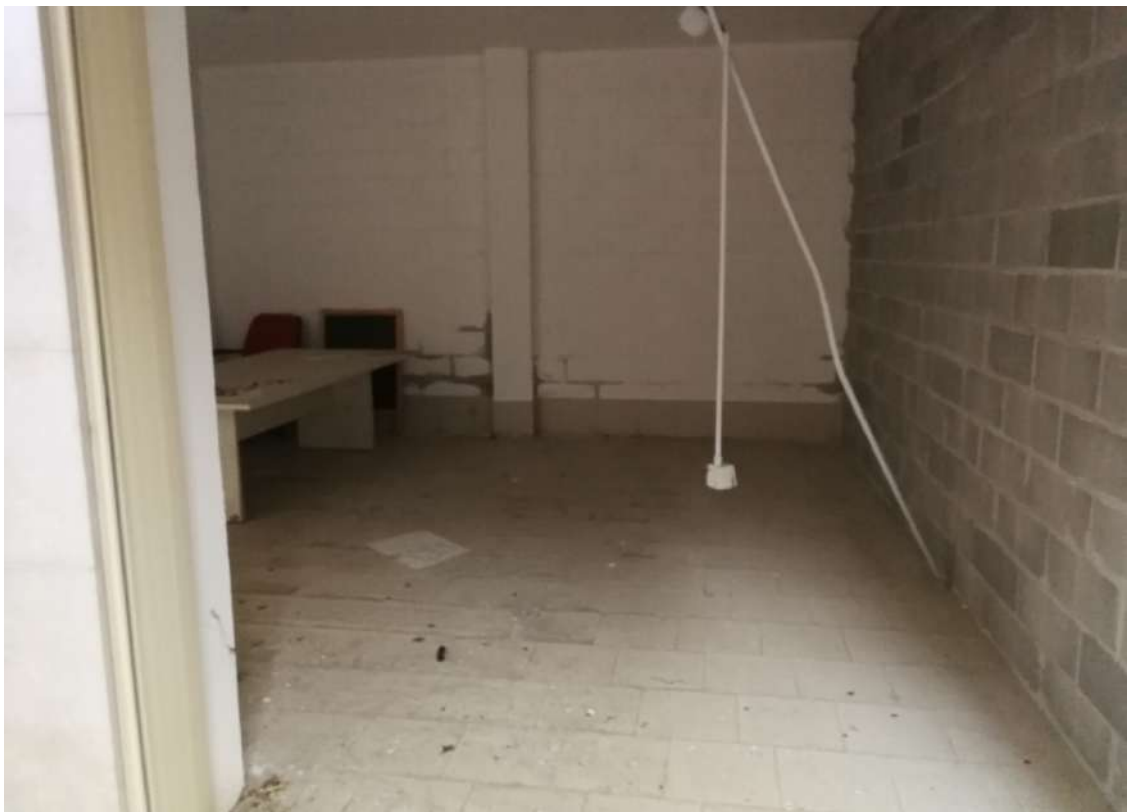
Fotografia n. 20 - Lotto n° 2 – Danneggiamento dell'impianto elettrico