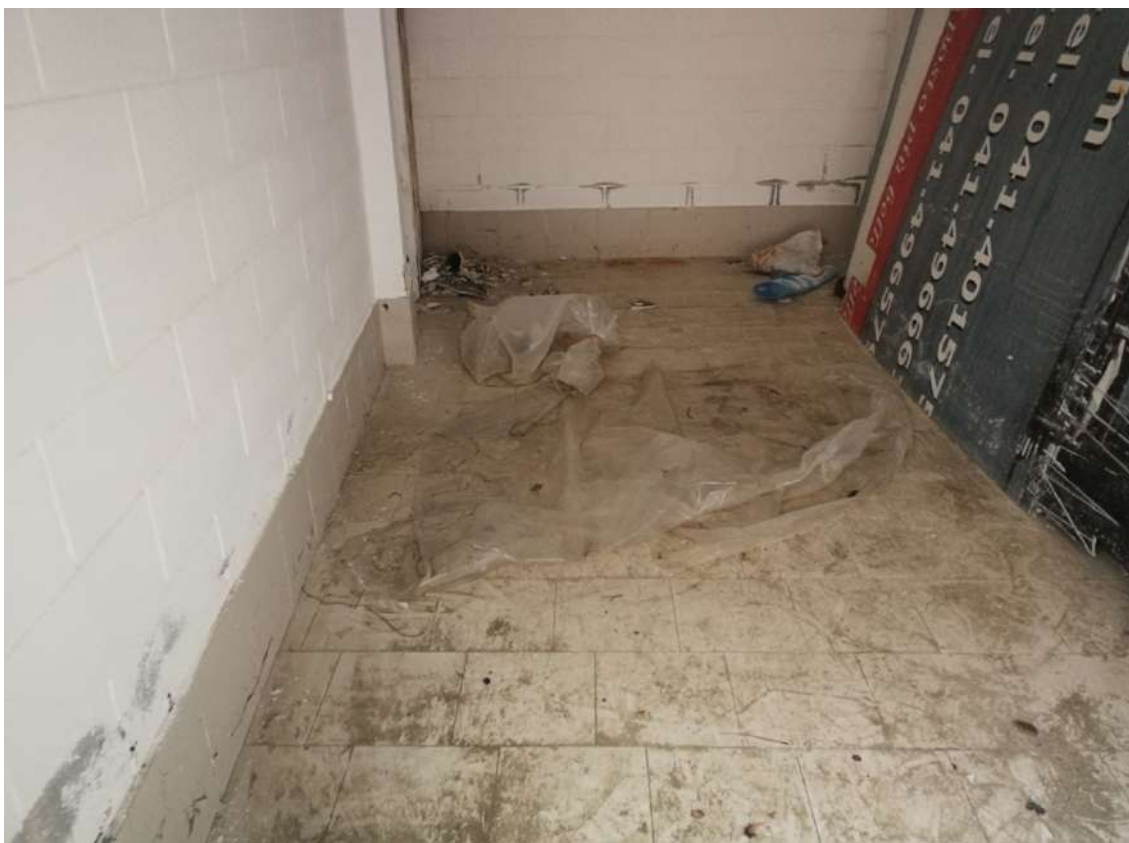
Fotografia n. 18 – Lotto n° 2 – Pavimentazione (molto sporca e trascurata)