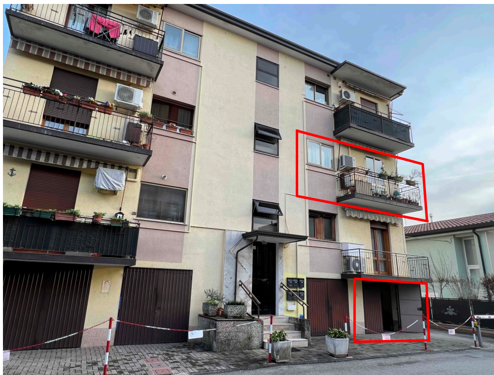
Foto 2 - veduta esterna dell'edificio con evidenziati l'appartamento al piano secondo (corpo A) e il garage al piano terra (corpo B)

tel 041-7241027 C.F GLL CRL 58L19 L736O - P.I.: 02230210276