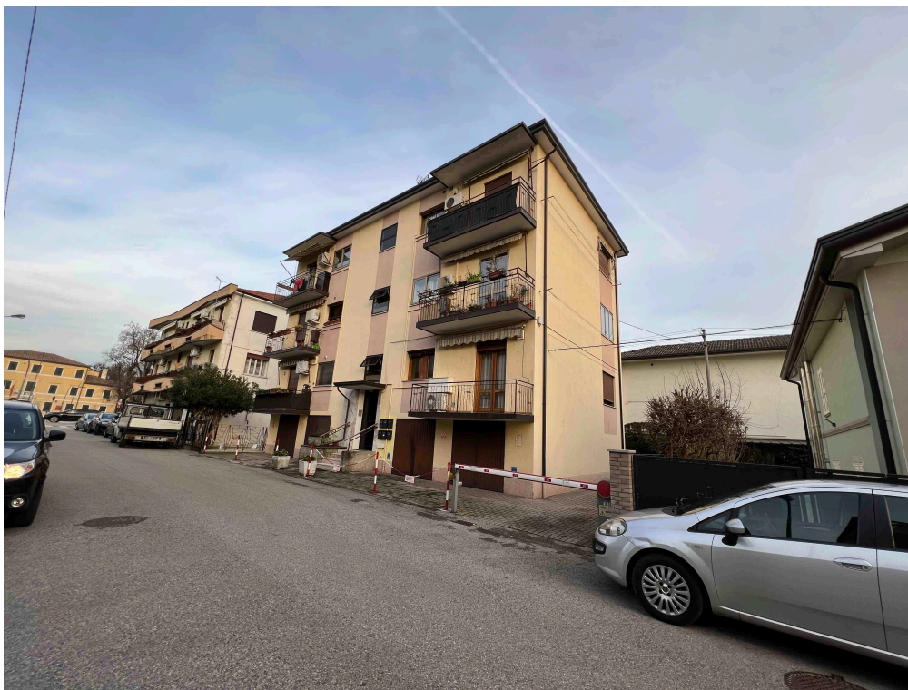
Foto 1 - veduta esterna da via Andrea Mantegna dell'edificio ove ubicati l'appartamento al piano secondo (corpo A) e il garage al piano terra (corpo B)