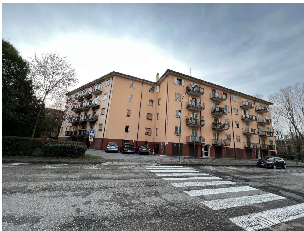
Foto 1 - veduta esterna da via Tevere dell'edificio ove ubicati l'appartamento al piano terzo (corpo A) e il garage al piano terra (corpo B)