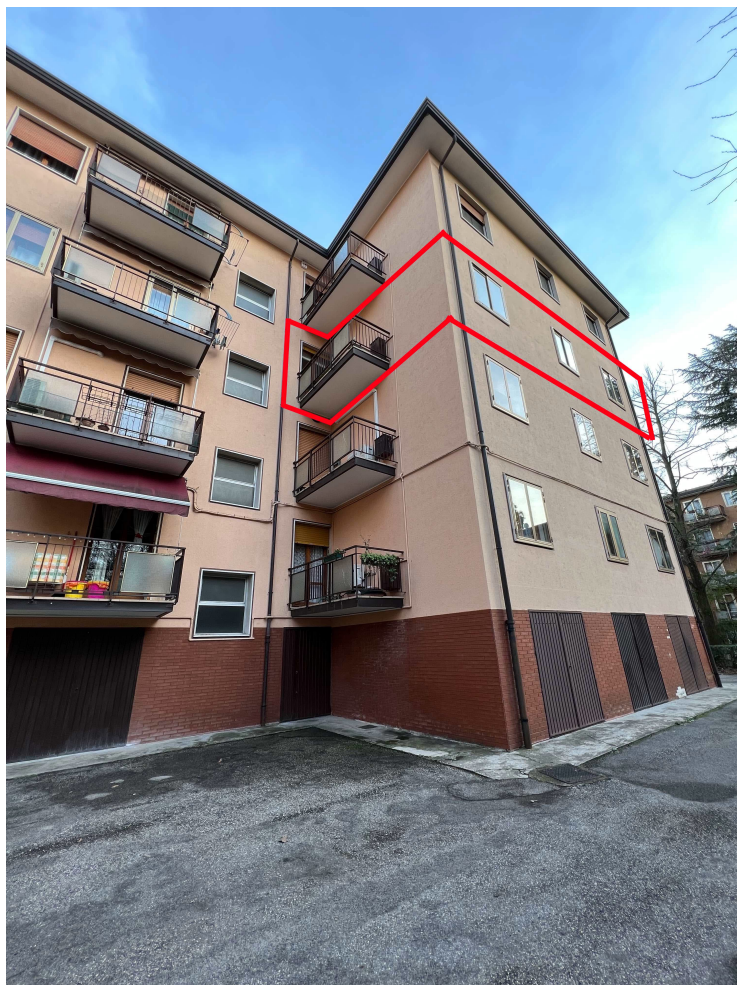
Foto 2 - veduta esterna dell'edificio con evidenziato l'appartamento al piano quarto (corpo A)

tel 041-7241027 C.F GLL CRL 58L19 L736O - P.I.: 02230210276