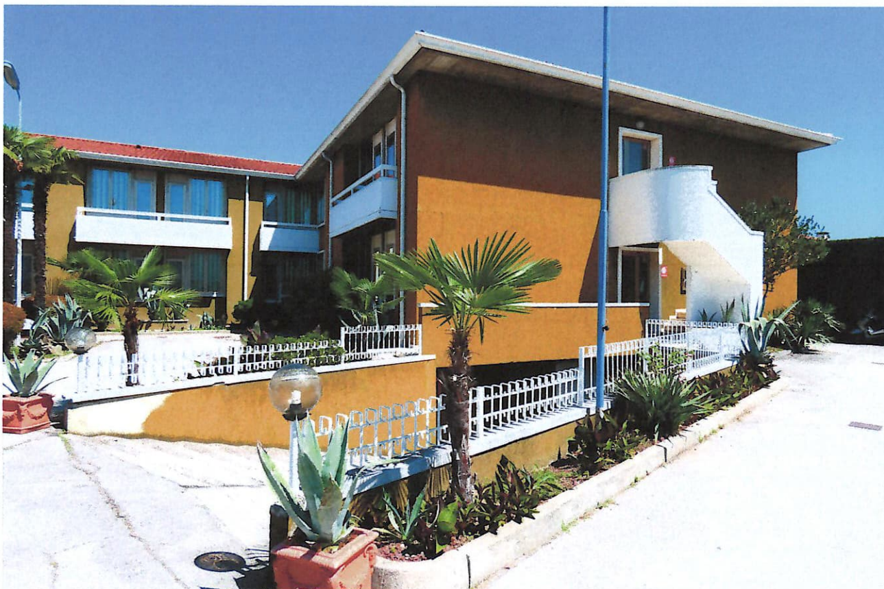
3 in primo piano la rampa verso il garage interrato vista dal piazzale su Via Venezia