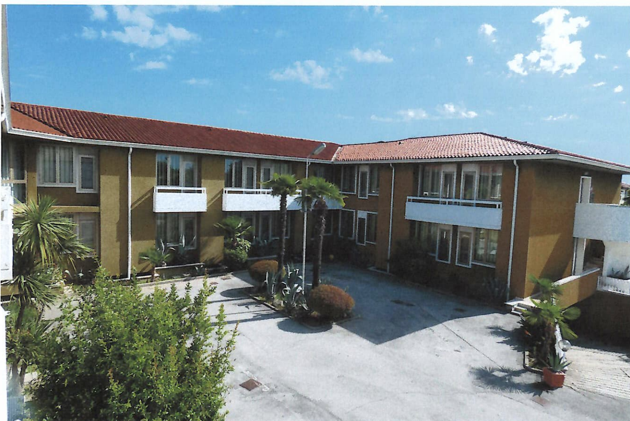
4 il piazzale visto dal piano primo stanza 151