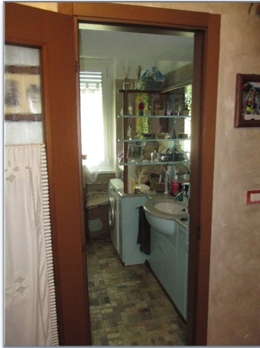
Foto 15 bagno