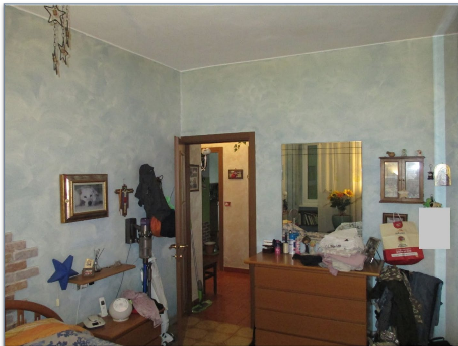
Foto 12 camera