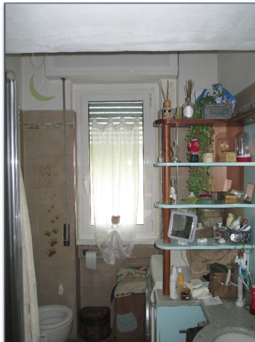
Foto 14 bagno