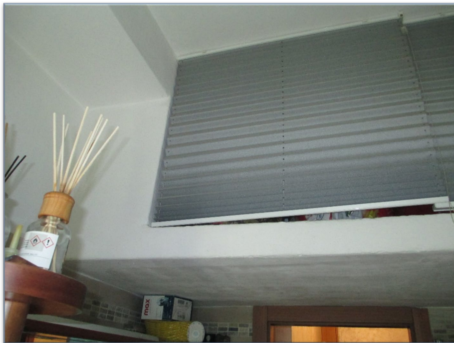
Foto 16 ripostiglio in quota