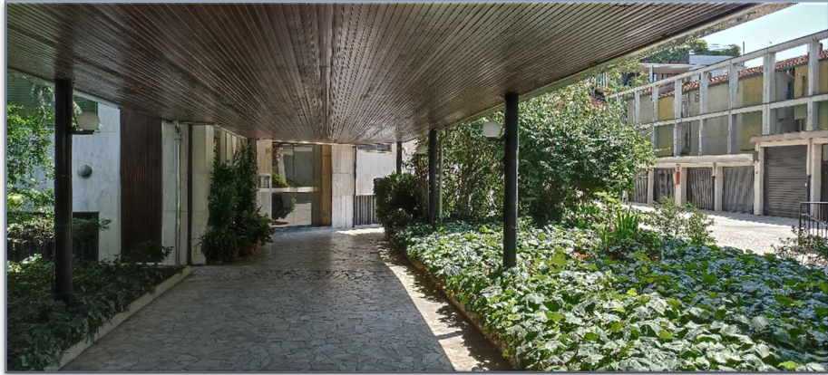
Foto 1 parti comuni