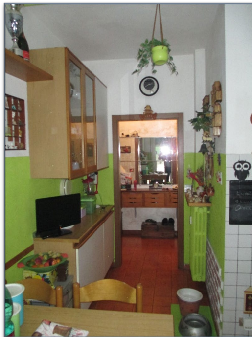
Foto 10 cucina