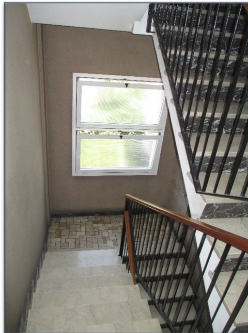
Foto 4 parti comuni