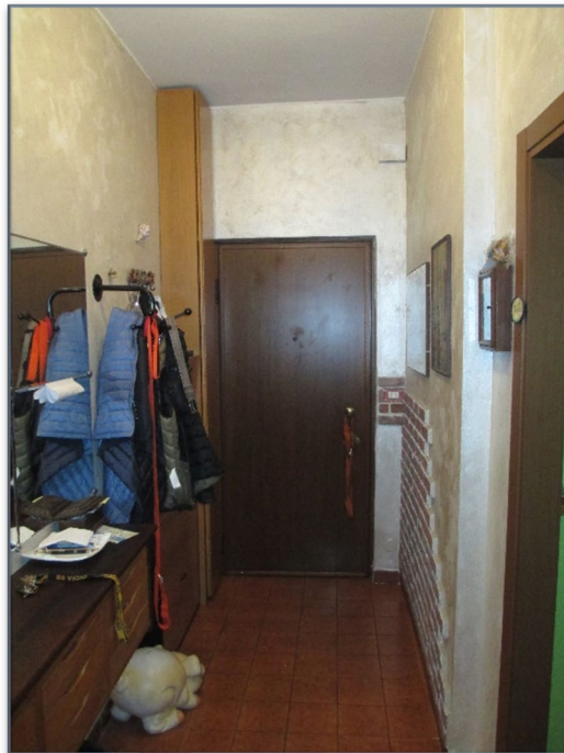
Foto 8 corridoio