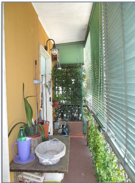
Foto 18 balcone