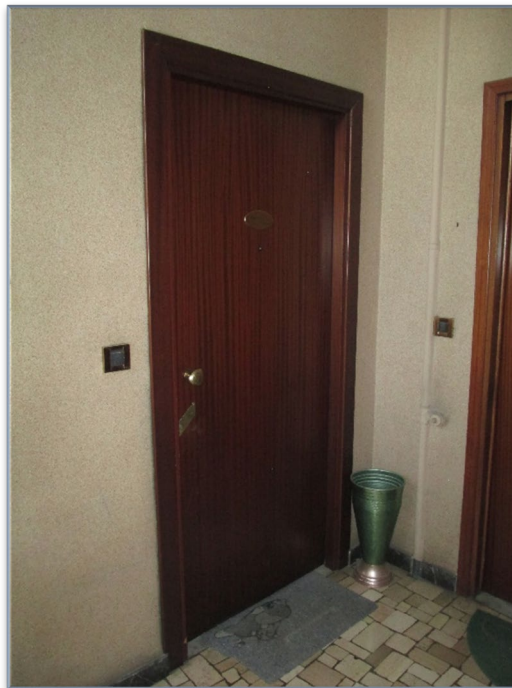
Foto 6 porta d'ingresso