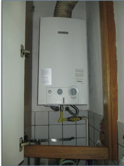
Foto 13 caldaia