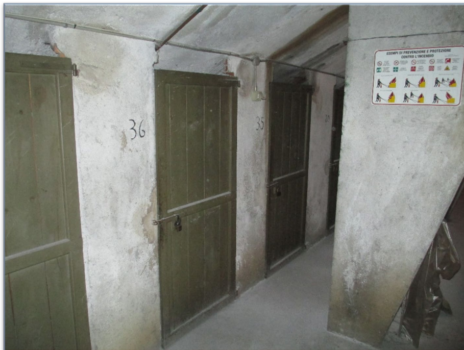
Foto 20 porta ingresso solaio