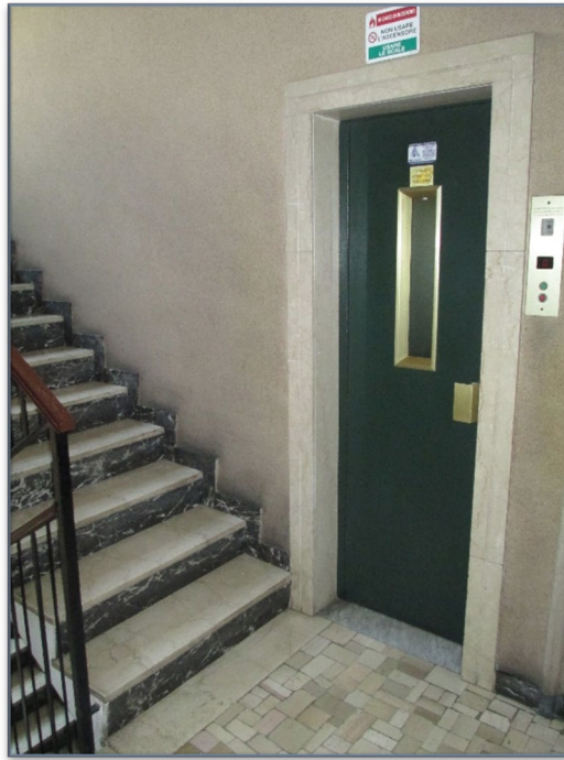
Foto 5 parti comuni