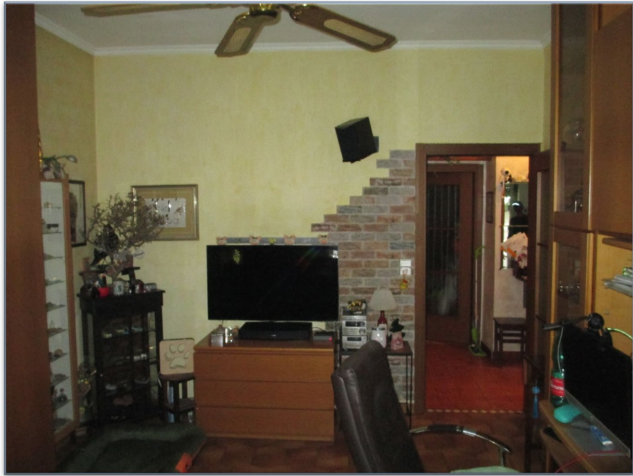
Foto 7 soggiorno