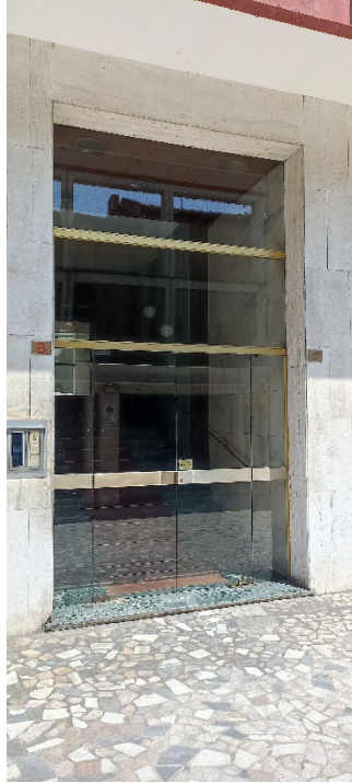
Foto 3 parti comuni