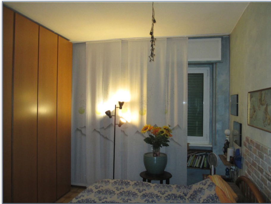
Foto 11 camera