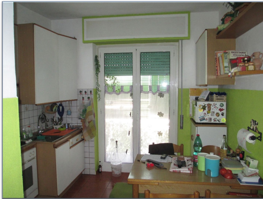
Foto 9 cucina