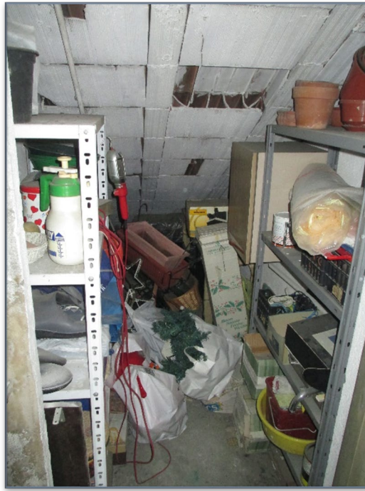
Foto 21 solaio