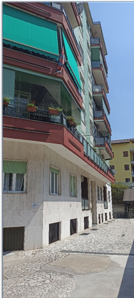
Foto 2 parti comuni