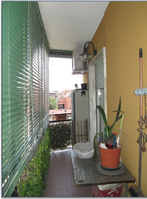
Foto 17 balcone