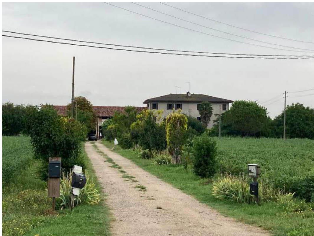
Foto n. 2: strada sterrata di accesso, insiste una servitù di passaggio pedonale, carraio e per mezzi agricoli