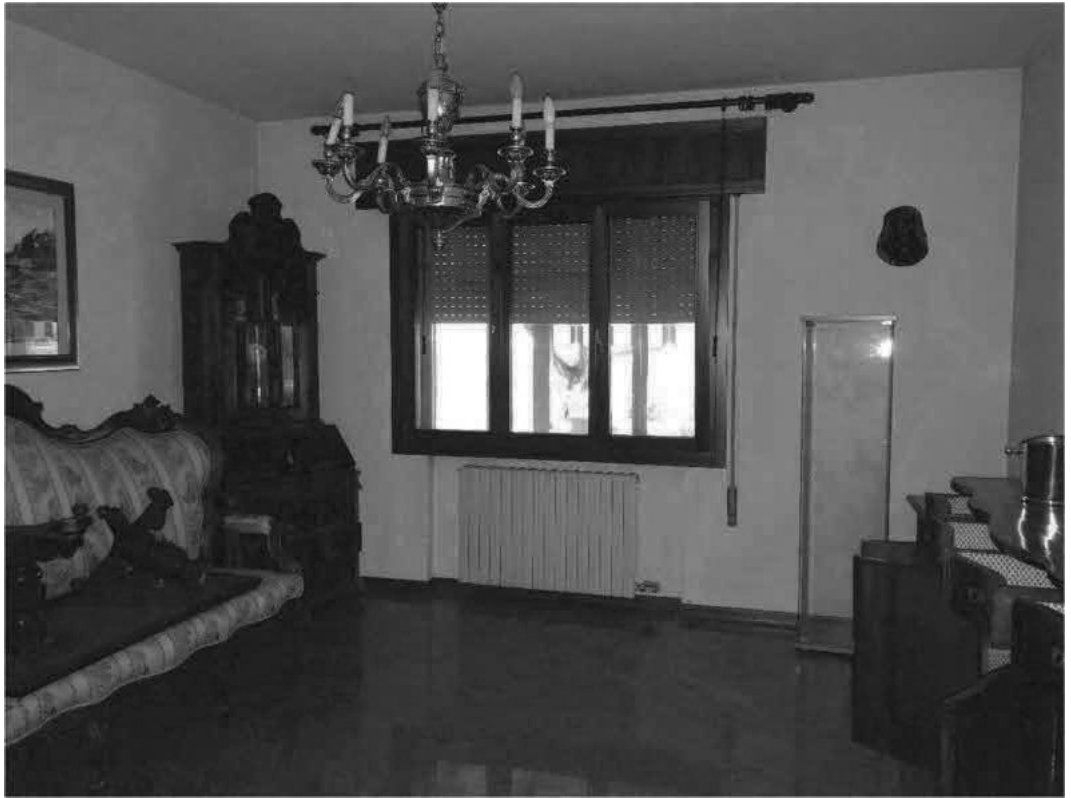
SOGGIORNO E ZONA PRANZO