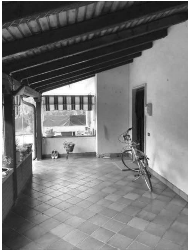
PORTICO E INGRESSO