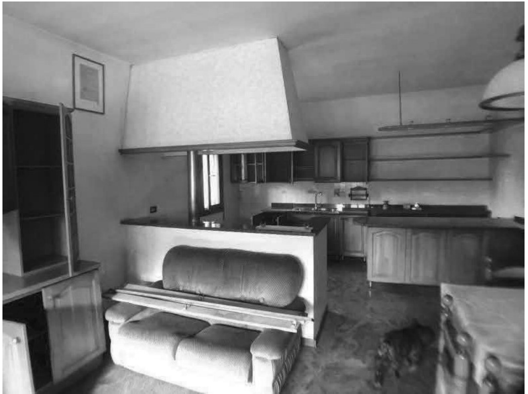
CUCINA E CAMERA