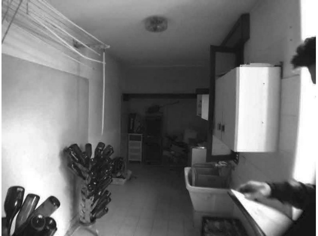
C.T. E DEPOSITO