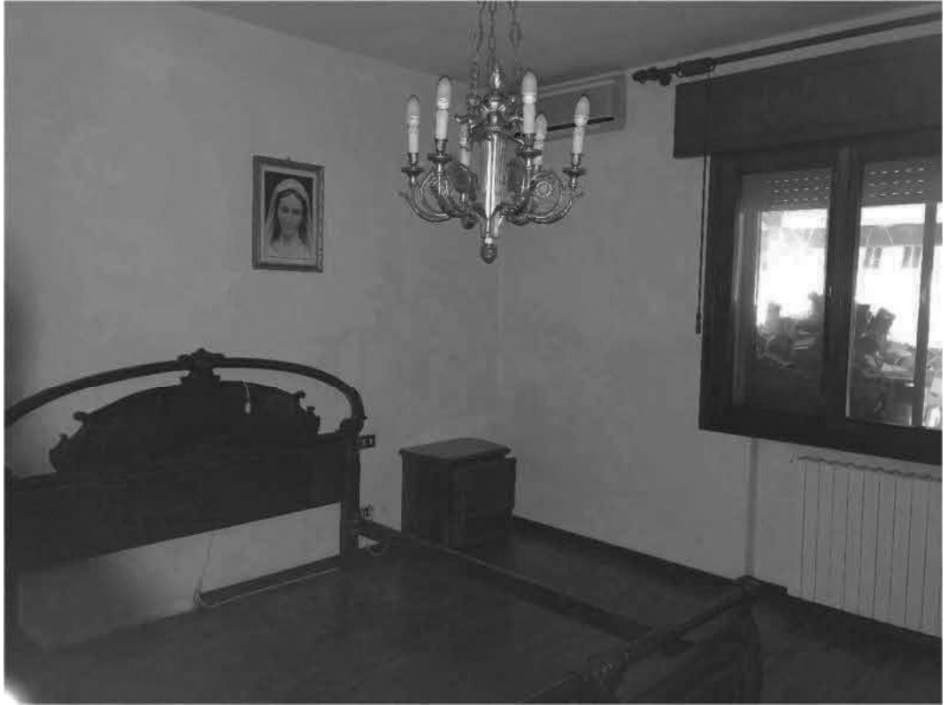
CAMERA E BAGNO