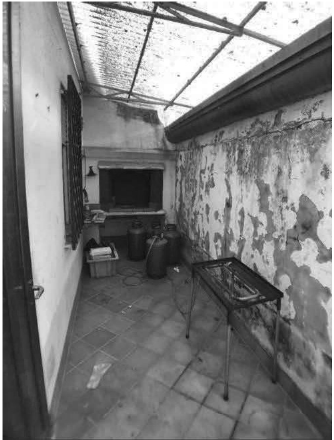
PORTICO E CANTINA