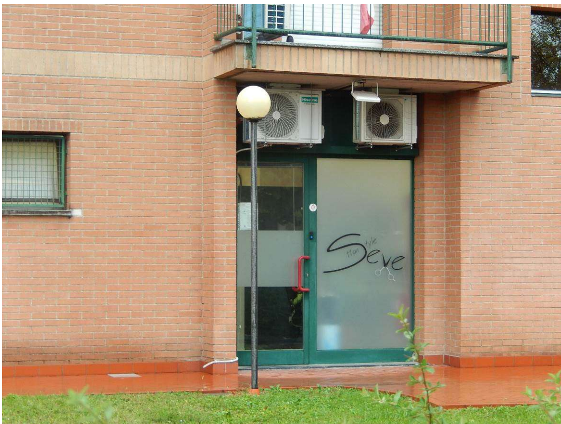
Foto 4 – Vista ravvicinata della vetrina su strada del negozio in esame.