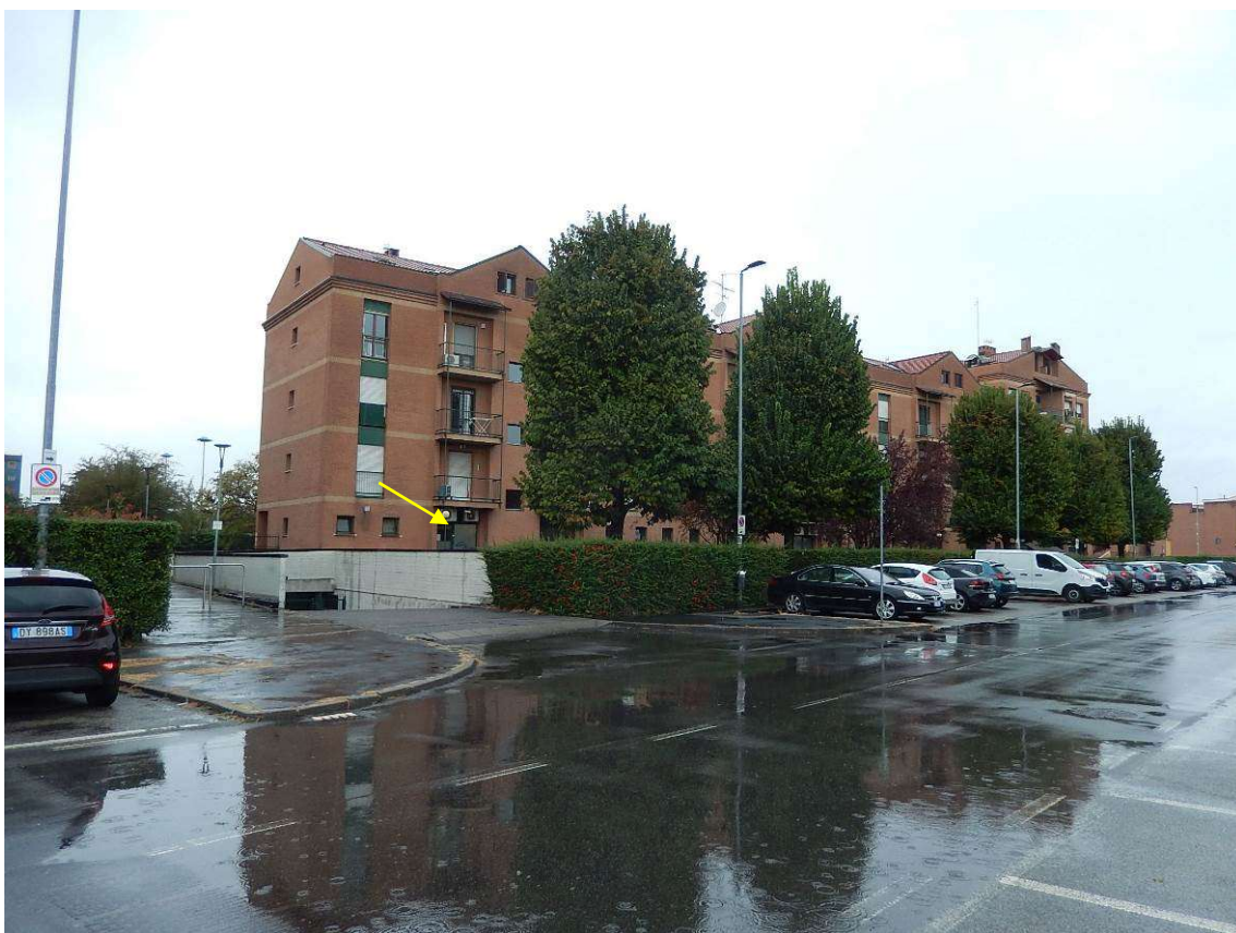
Foto 3 – Vista da est del complesso. Indicata dalla freccia l'unità in esame.