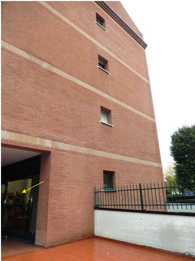
Foto 5 – Vista della facciata sud. La vetrina interna indicata dalla freccia.