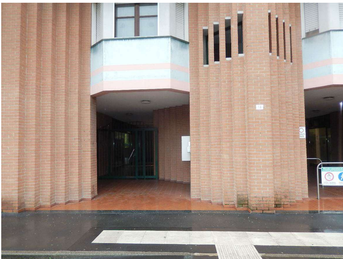
Foto 2 – L'ingresso pedonale sulla via Pellico del condominio in esame.