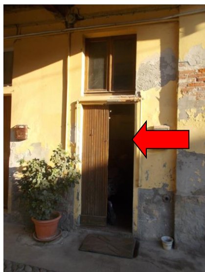
5. Ingresso all'immobile pignorato