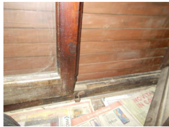
22. Dettaglio serramento esterno