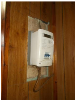
21. Contatore elettrico con salvavita