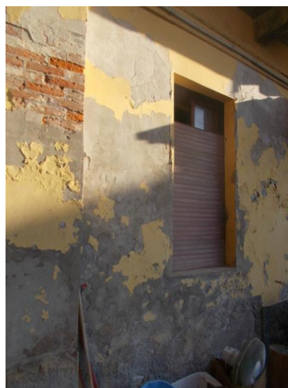
6. Facciata esterna con finestra del bagno