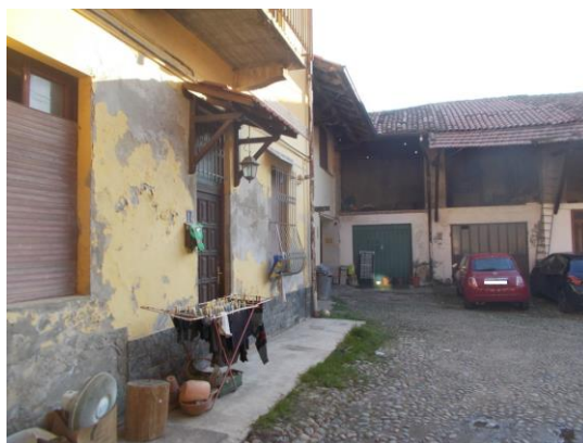
4. Corte interna