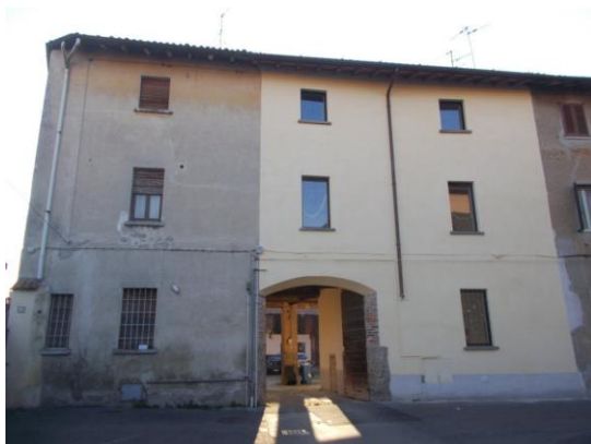
1. Ingresso alla corte da via Crotta