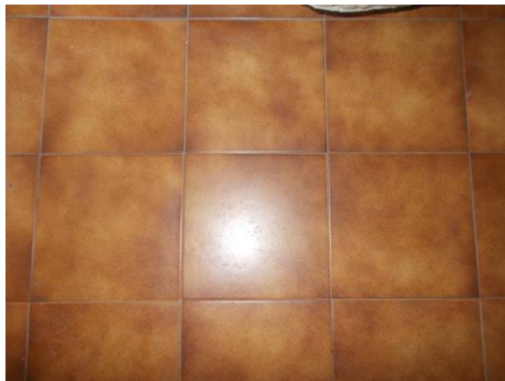
13. Dettaglio pavimento del monolocale