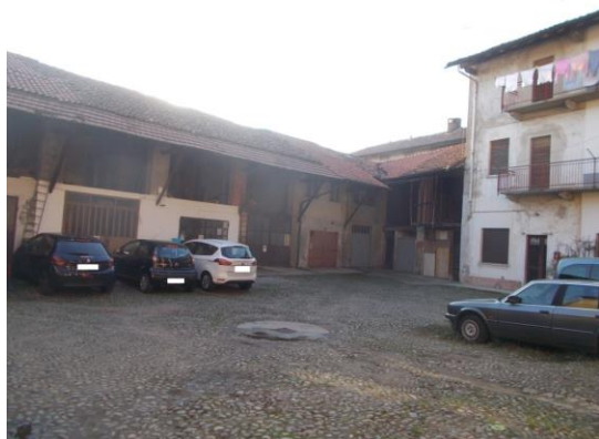
3. Corte interna