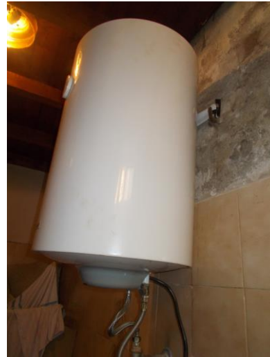
18. Boiler elettrico nel bagno