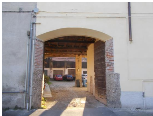
2. Androne di ingresso alla corte