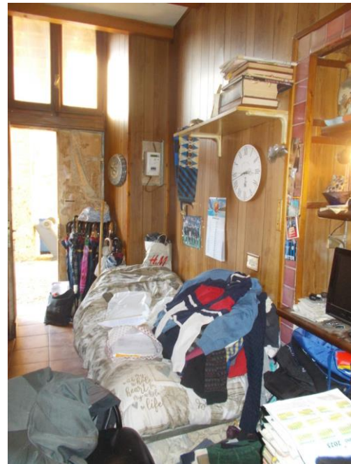
10. Vista verso l'ingresso