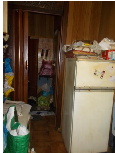
12. Vista verso l'antibagno