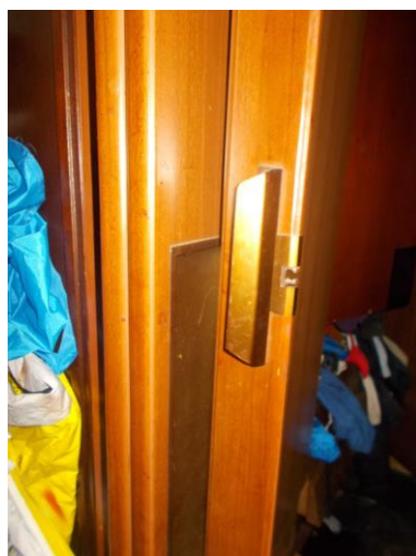
15. Porta interna a soffietto