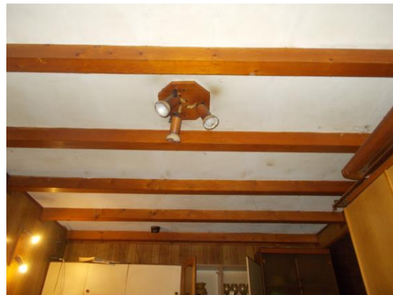
14. Dettaglio soffitto del monolocale