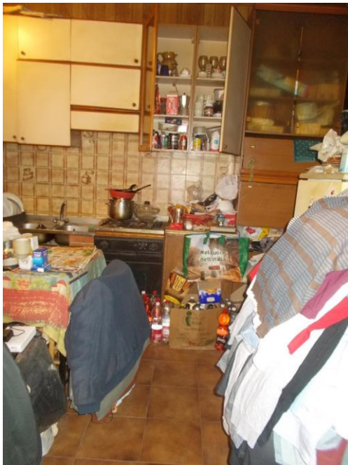
9. Panoramica del monolocale