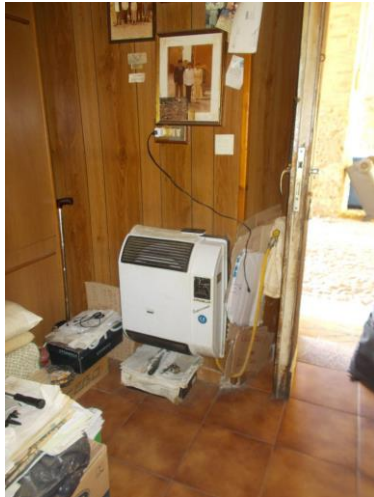
11. Stufa elettrica per riscaldamento