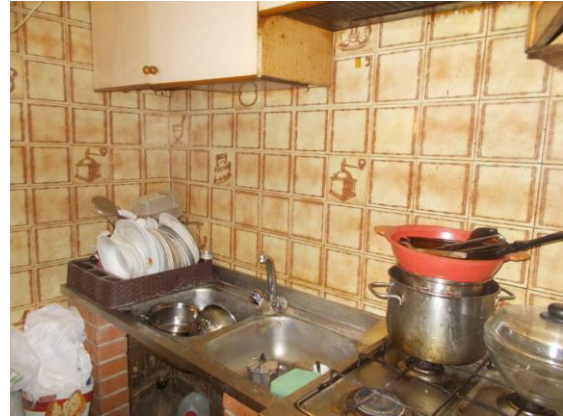
8. Dettaglio zona cucina