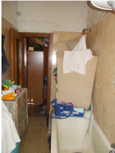
17. Interno del bagno