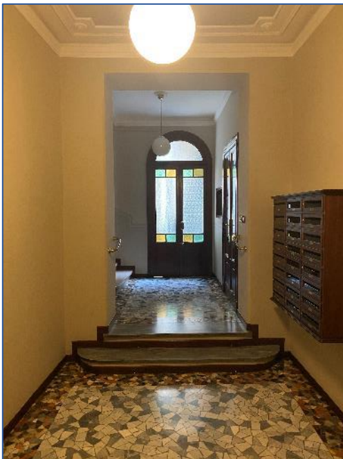
Foto 3 - androne comune