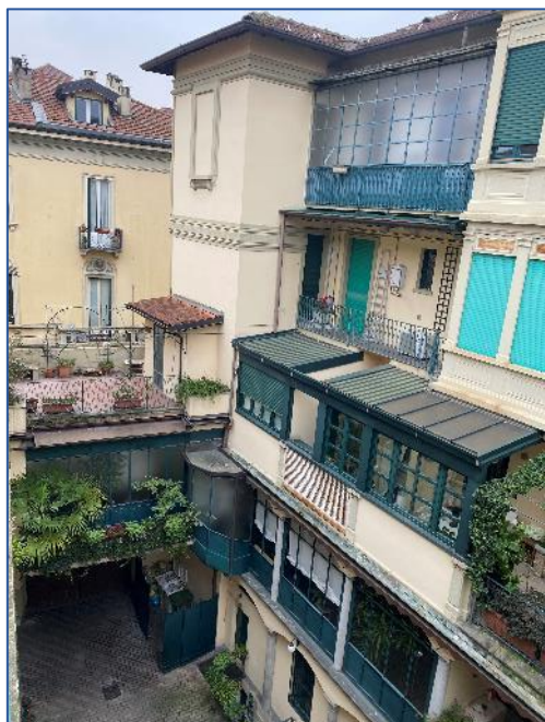
Foto 13 - affaccio su corte interna comune