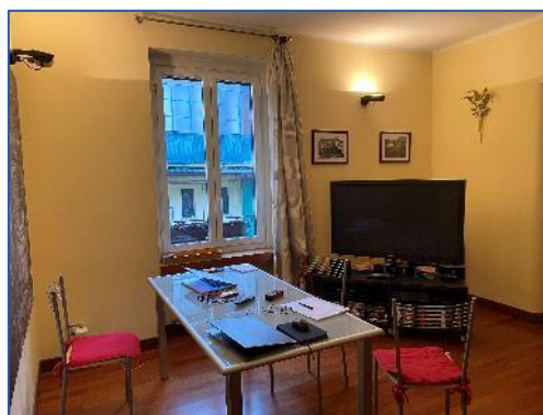
Foto 30 - soggiorno