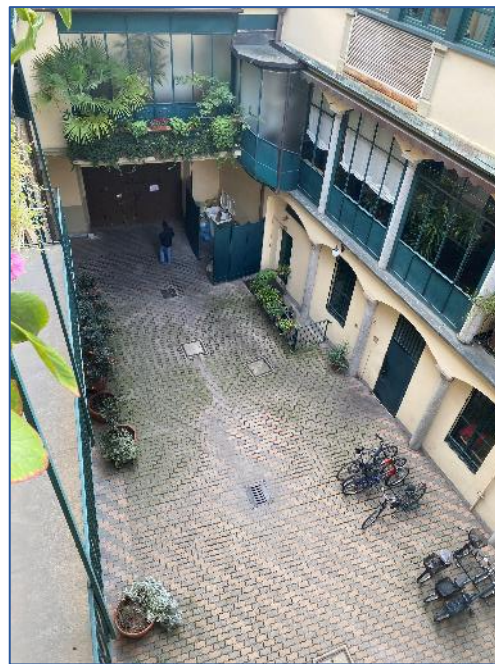
Foto 12 - affaccio su corte interna comune