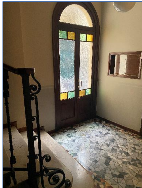
Foto 4 - spazi interni comuni