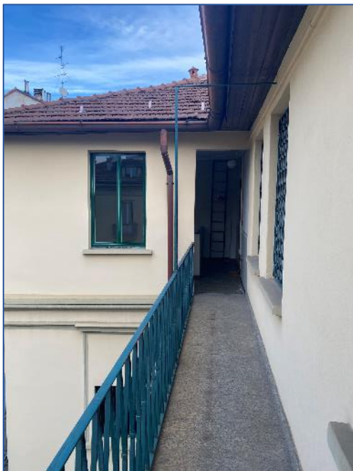
Foto 9 - ballatoio comune