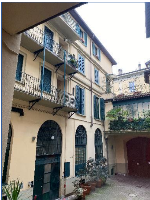
Foto 11 - corte interna comune