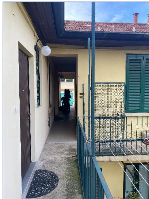
Foto 10 - ballatoio comune