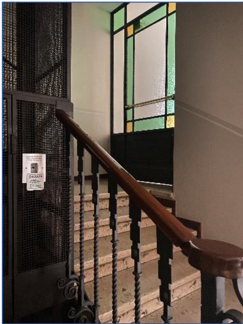
Foto 5 - vano scala comune