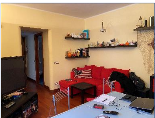
Foto 29 - soggiorno