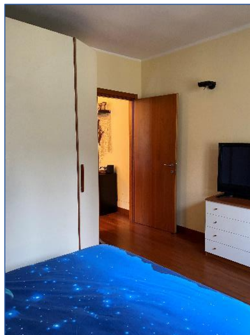
Foto 32 - camera