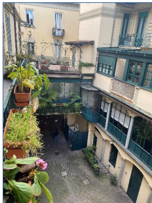
Foto 14 - affaccio su corte interna comune