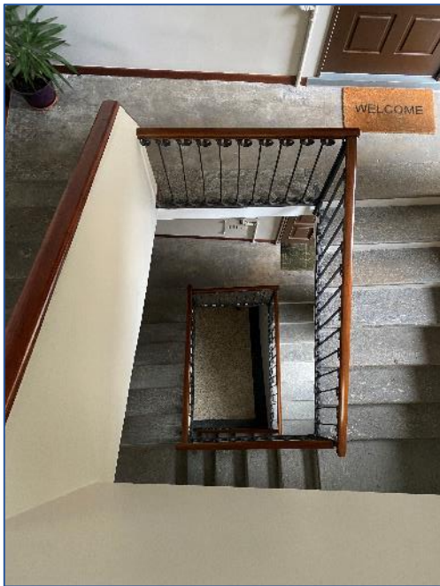
Foto 7 - vano scala comune