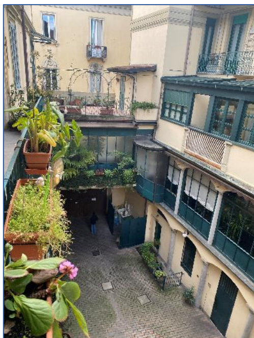
Foto 15 - affaccio su corte interna comune