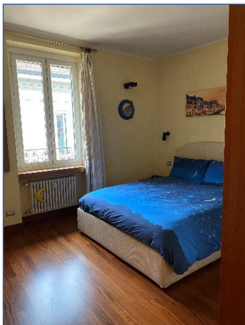
Foto 31 - camera