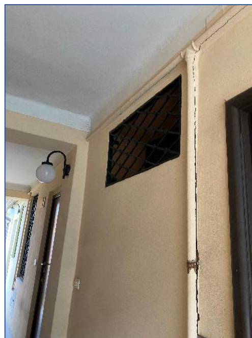
Foto 16 - dettaglio serramento bagno su spazi comuni