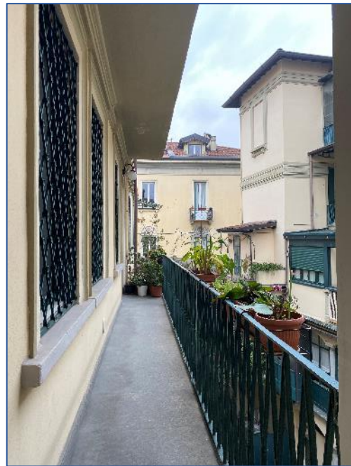
Foto 8 - ballatoio comune