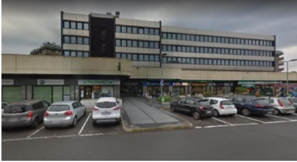
PROSPETTO VERSO VIA GANDHI