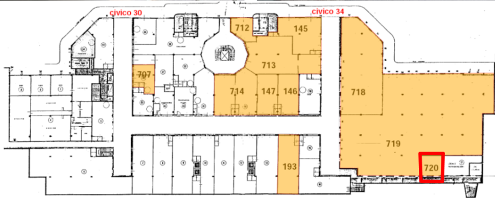
PLANIMETRIA CENTRO COMMERCIALE – PIANO S1 / localizzazione unità sub 720