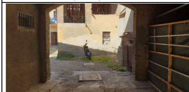
Immobile in via Magenta, 4 Vaprio D'Adda (MI): portico di ingresso