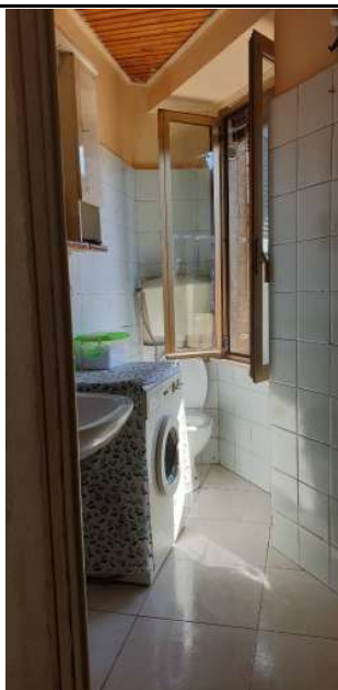
Appartamento pignorato in via Magenta, 4 Vaprio D'Adda (MI): bagno