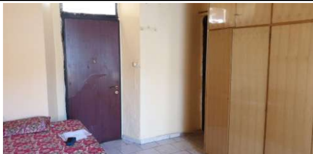
Appartamento pignorato in via Magenta, 4 Vaprio D'Adda (MI): prima camera con evidenziata la porta di ingresso del precedente monocale