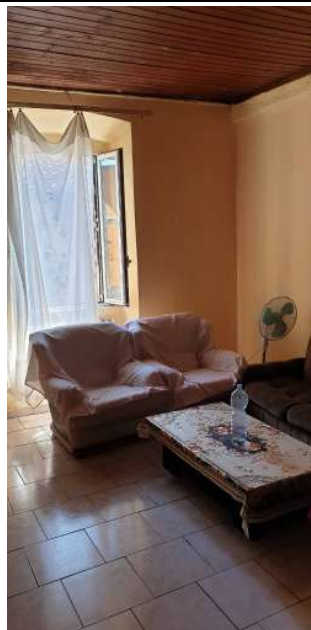
Appartamento pignorato in via Magenta, 4 Vaprio D'Adda (MI): prima camera