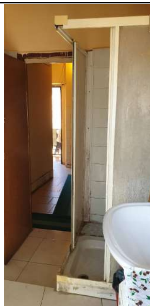
Appartamento pignorato in via Magenta, 4 Vaprio D'Adda (MI): bagno - altra foto