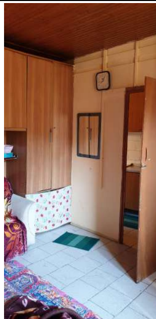
Appartamento pignorato in via Magenta, 4 Vaprio D'Adda (MI): seconda camera (altra foto)