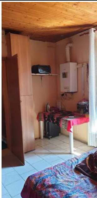
Appartamento pignorato in via Magenta, 4 Vaprio D'Adda (MI): seconda camera