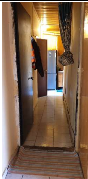
Appartamento pignorato in via Magenta, 4 Vaprio D'Adda (MI): corridoio con porta che unisce i precedenti due monocali