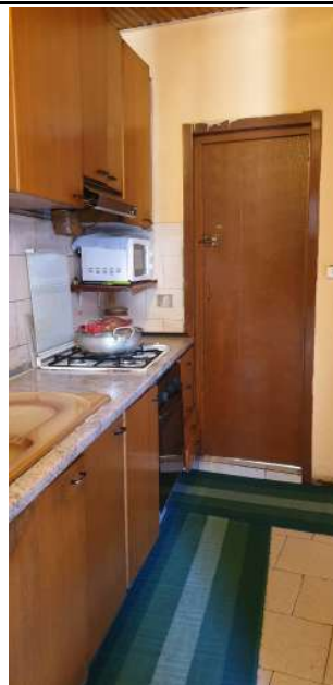
Appartamento pignorato in via Magenta, 4 Vaprio D'Adda (MI): angolo cottura con immagine della porta di ingresso al bagno