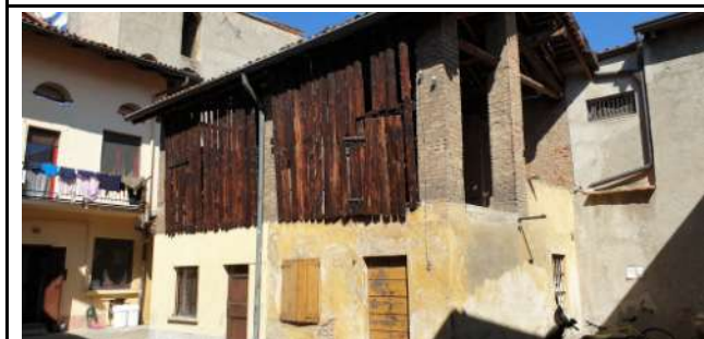
Immobile in via Magenta, 4 Vaprio D'Adda (MI): interno corte