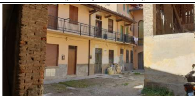
Immobile in via Magenta, 4 Vaprio D'Adda (MI): interno corte