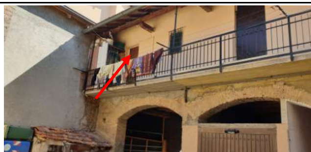
Immobile in via Magenta, 4 Vaprio D'Adda (MI): interno corte con indicato porta di ingresso appartamento pignato