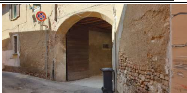
Immobile in via Magenta, 4 Vaprio D'Adda (MI): ingresso alla corte