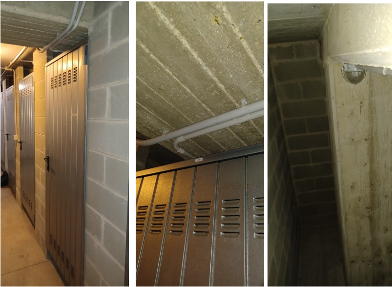
progetto autorizzato rif cantina n.30

presenza di pilastratura in cantina non rilevata sul