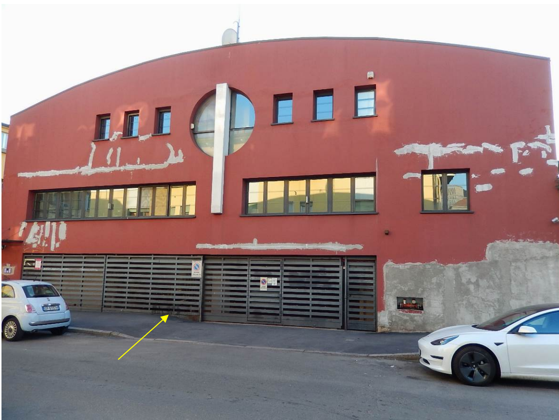
Foto 2 - Indicato dalla freccia il portone di accesso alle autorimesse.