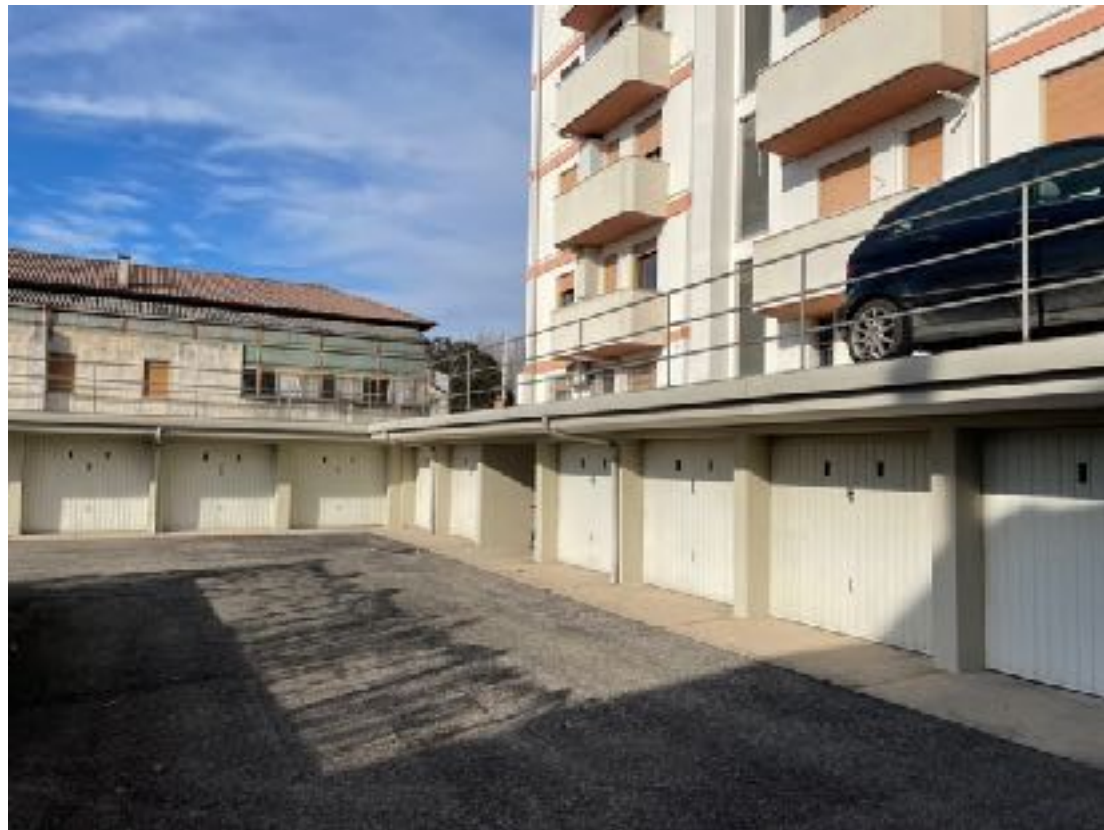
Vista esterna del palazzo, facciata fronte via Luigi Cadorna