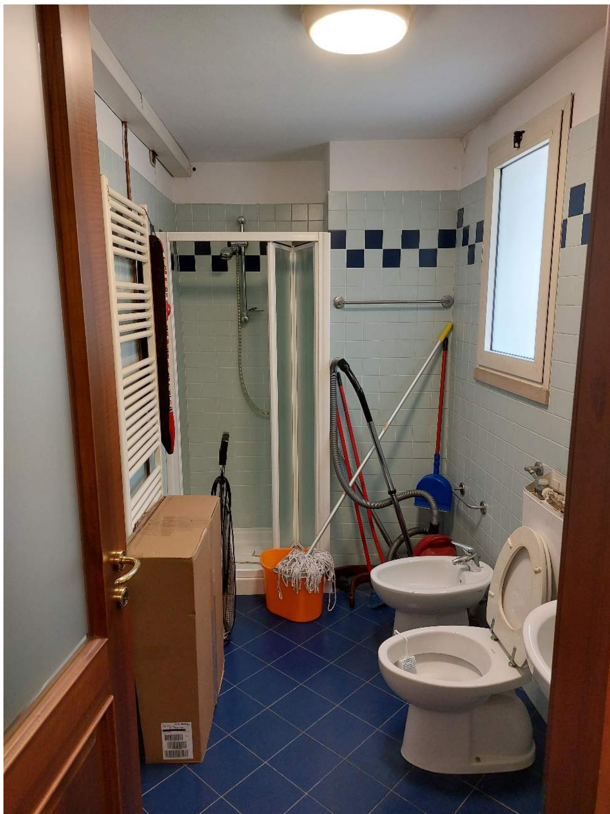
Foto n° 3 - Comune di Porcia, foglio 2, part.291, sub.13 + part.616 sub.1 – Stanza wc.