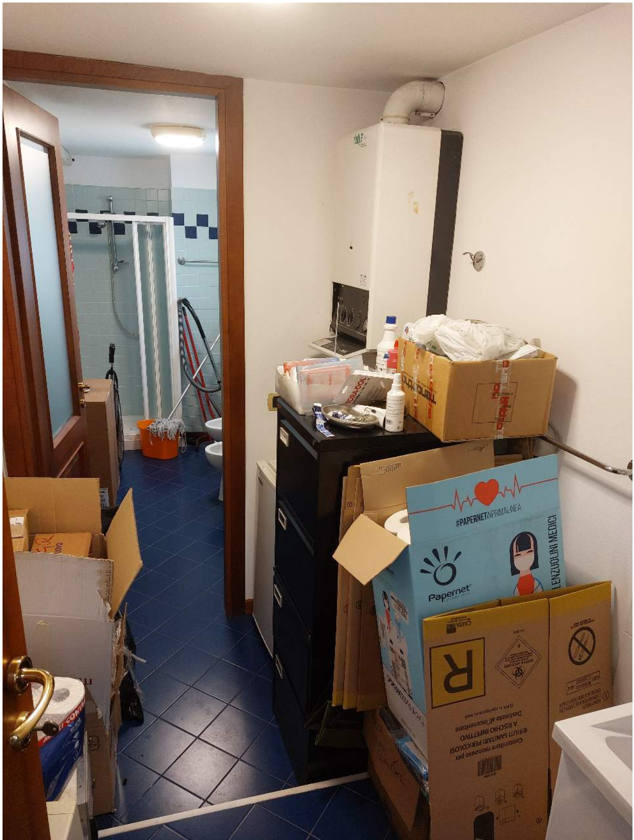
Foto n° 2 - Comune di Porcia, foglio 2, part.291, sub.13 + part.616 sub.1 – Antiservizi.