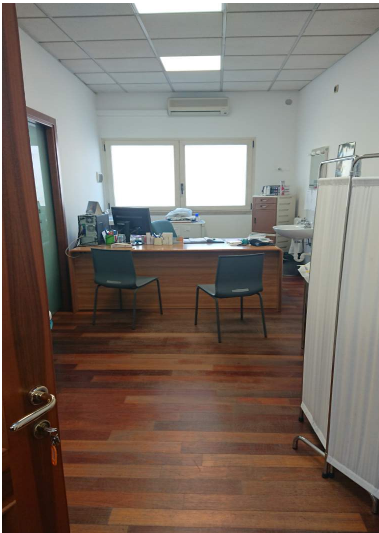
Foto n° 4 - Comune di Porcia, foglio 2, part.291, sub.13 + part.616 sub.1 – Visione interna del bene pignorato.