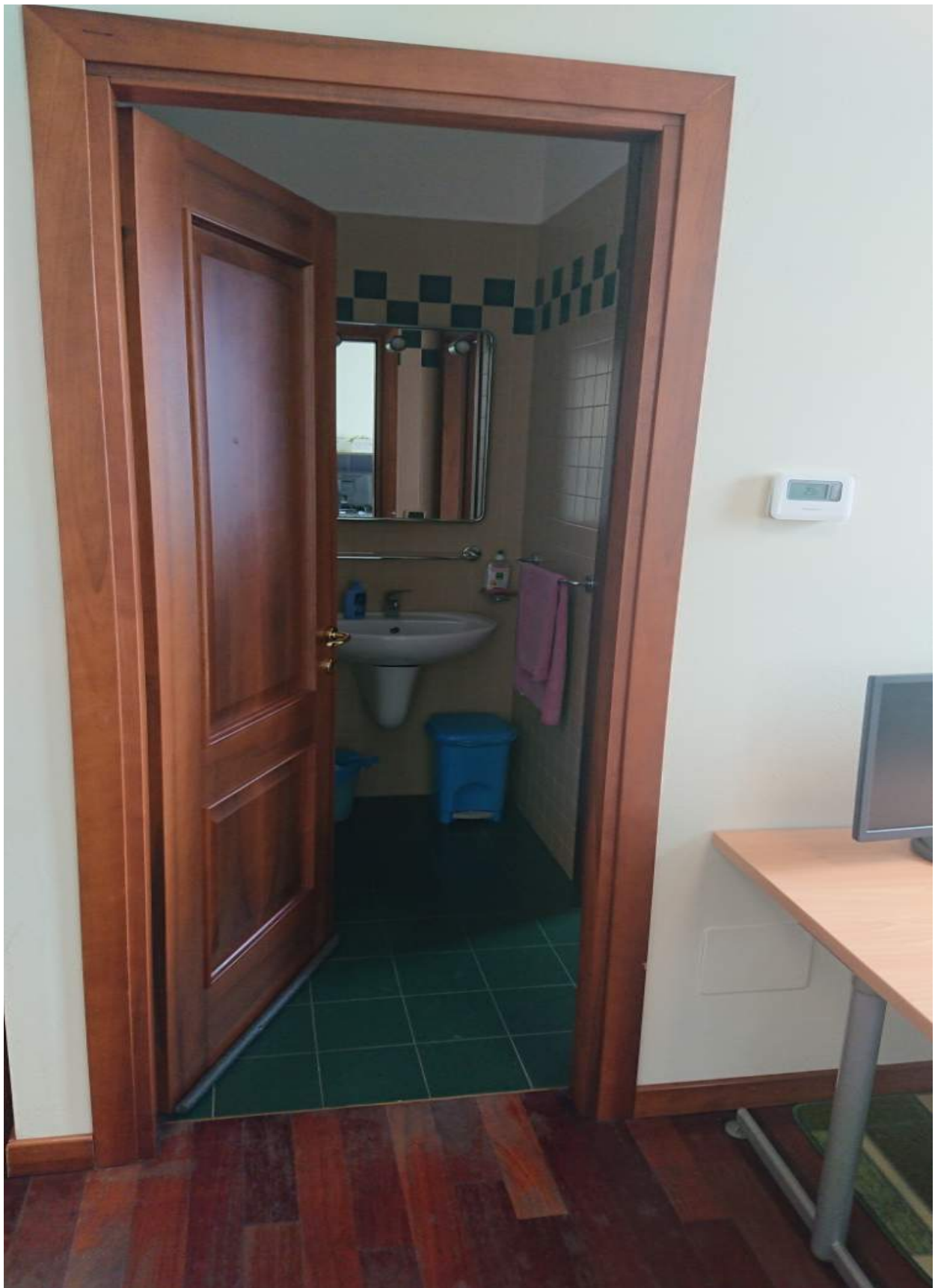
Foto n° 3 - Comune di Porcia, foglio 2, part.291, sub.18 + part.616 sub.8 – Anti servizi.