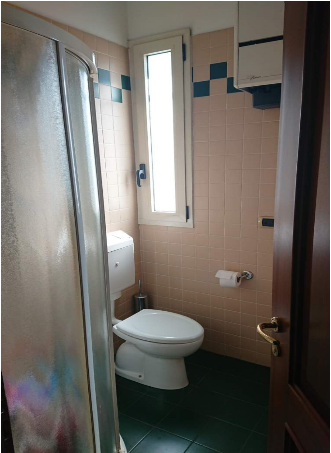
Foto n° 4 - Comune di Porcia, foglio 2, part.291, sub.18 + part.616 sub.8 – Stanza wc.