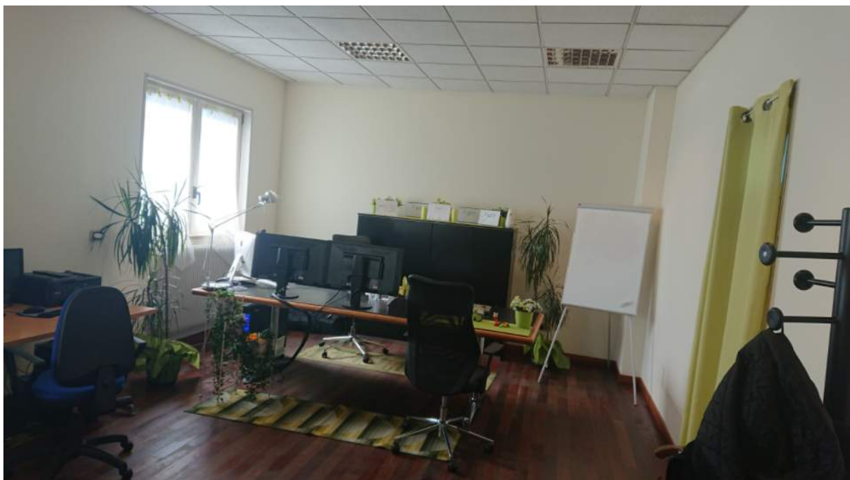
Foto n° 1 - Comune di Porcia, foglio 2, part.291, sub.18 + part.616 sub.8 – Visione interna del bene pignorato.