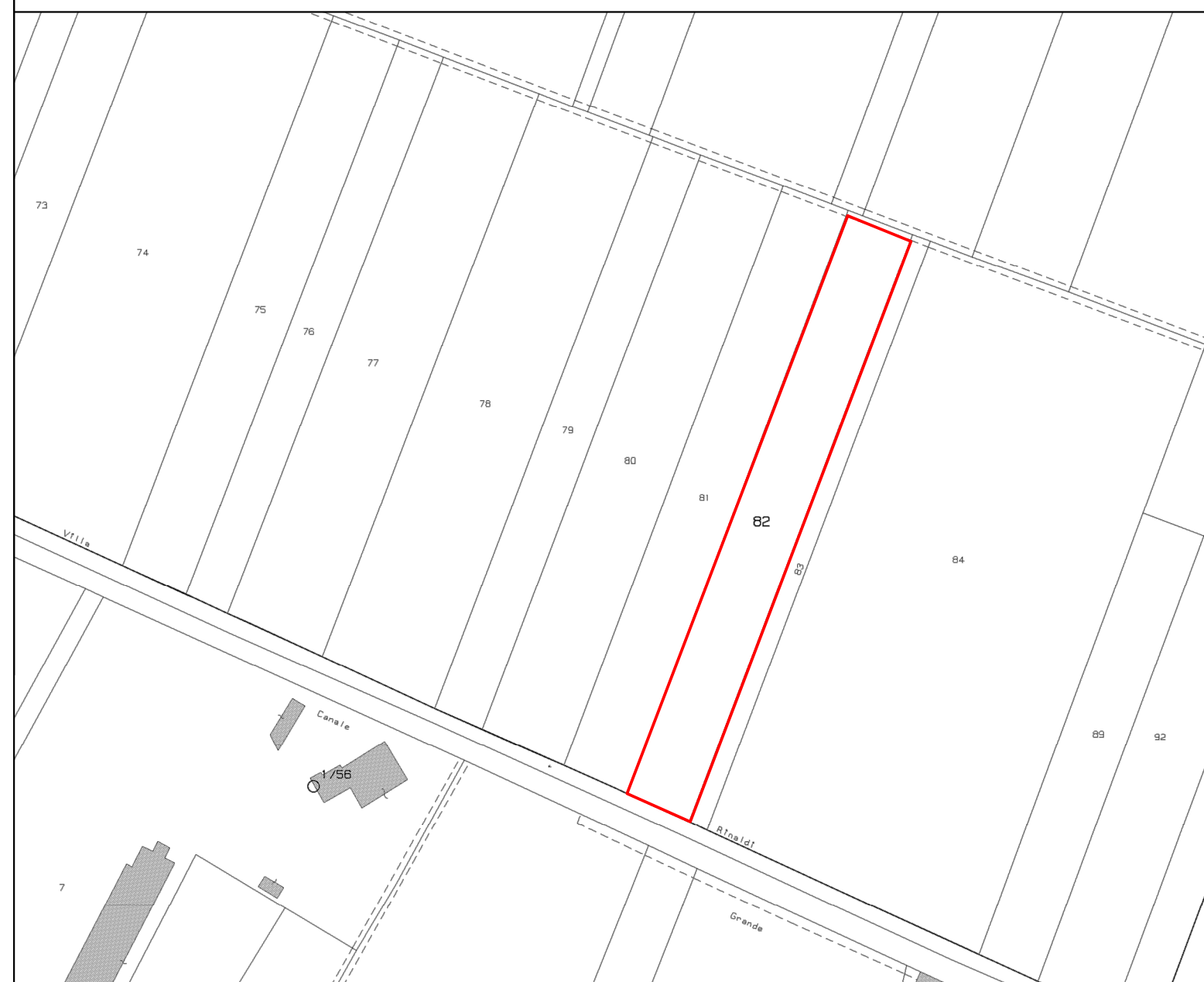
ESTRATTO DI MAPPA FG 61 MAP 82 Scala 1:2000