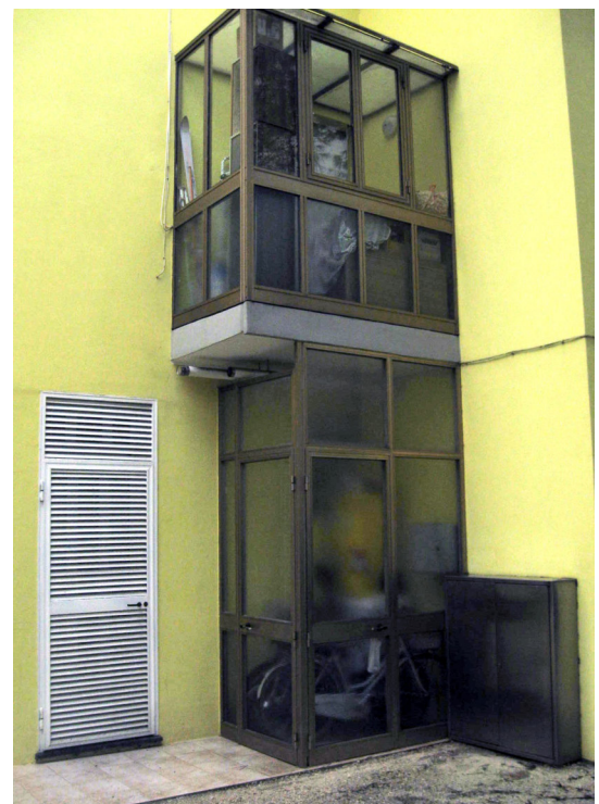
Particolare dei manufatti privi di concessione edilizia posti sul lato ovest dell'edificio