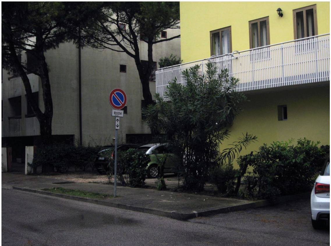
Secondo accesso carraio su Via Corona del Sud