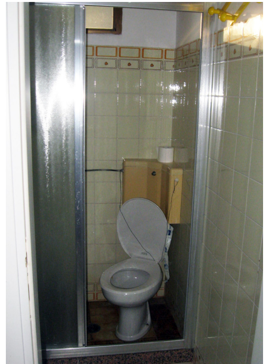
Il bagno con la nicchia nella quale è inserito il lavabo e il box doccia con il vaso a sedere al suo interno