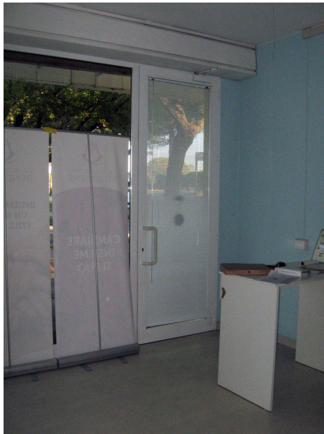
Particolare della porta di ingresso all'immobile