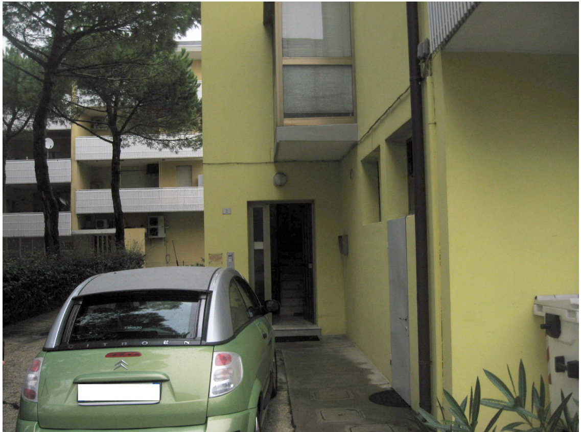
Accesso al vano scale