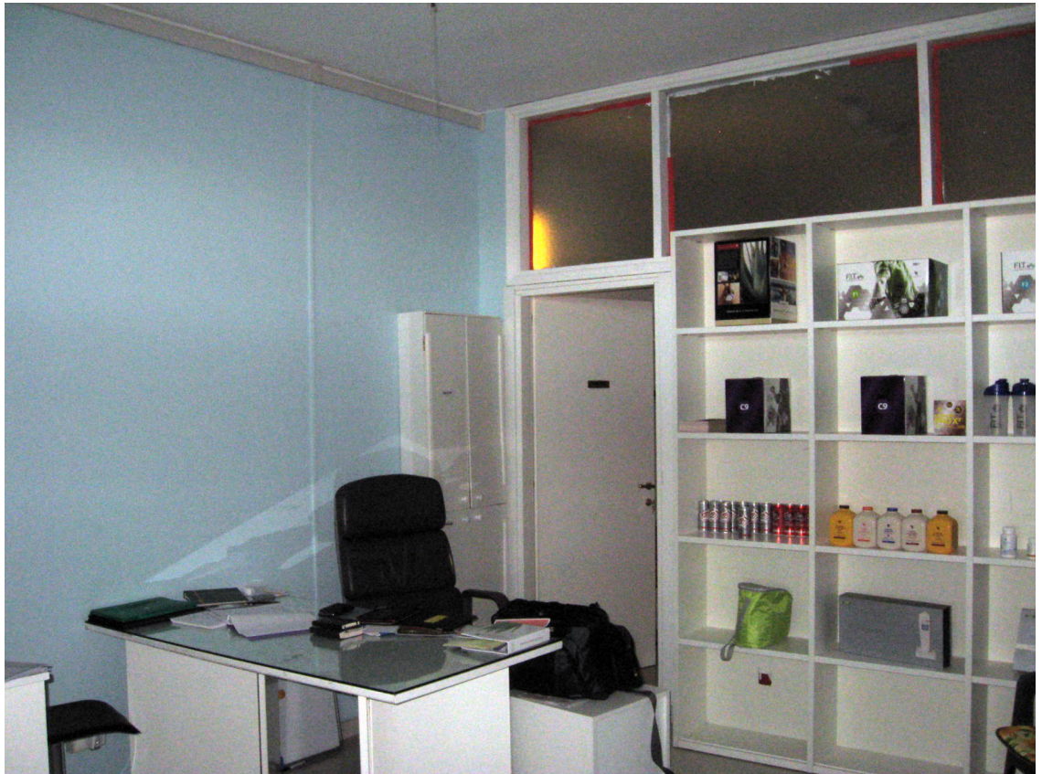
Il vano di ingresso e l'accesso al vano posteriore