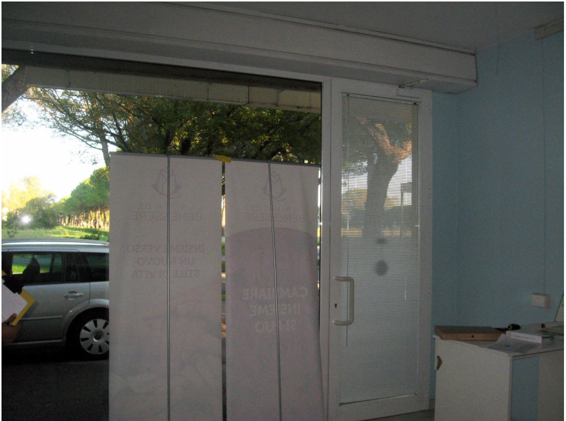
La vetrata di ingresso