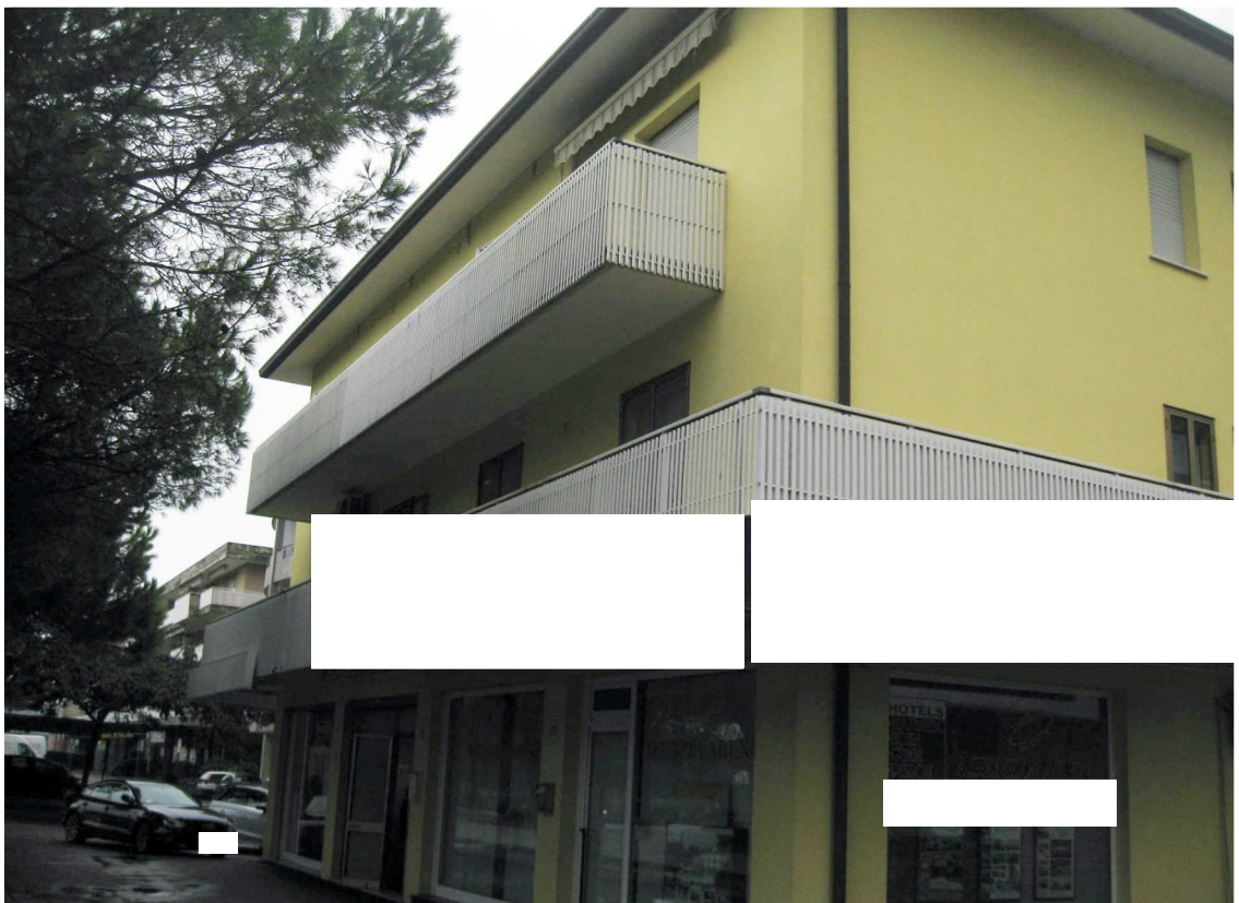
Condominio visto da nord-est