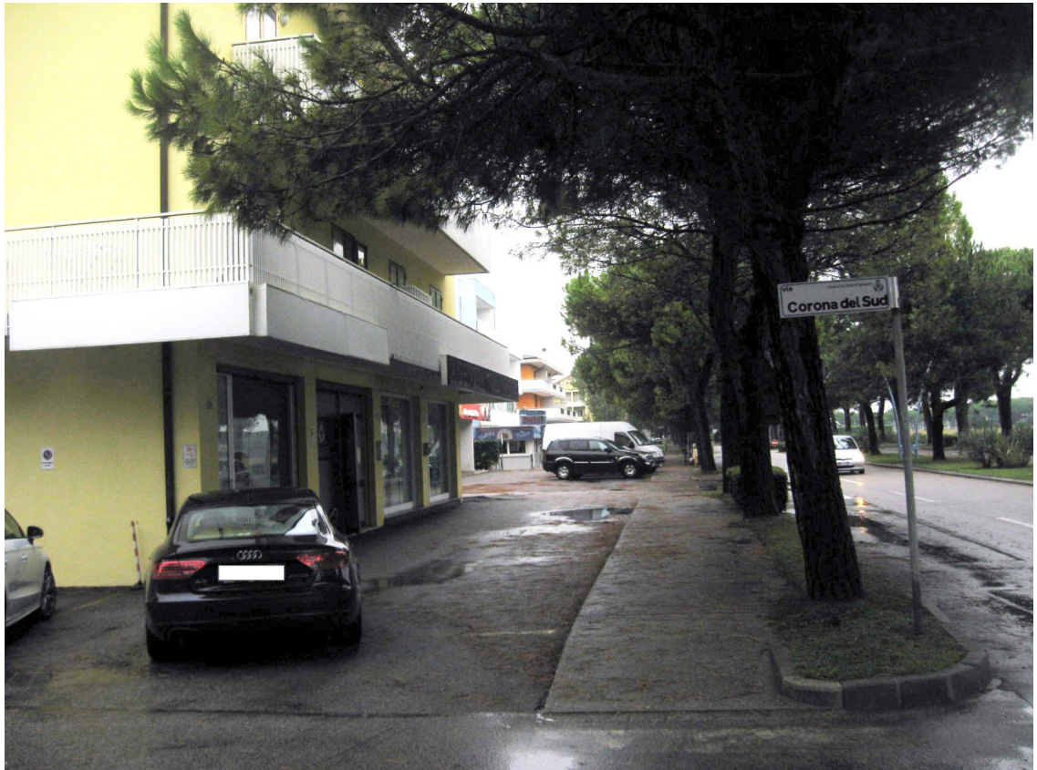
Primo accesso carraio su Via Corona del Sud