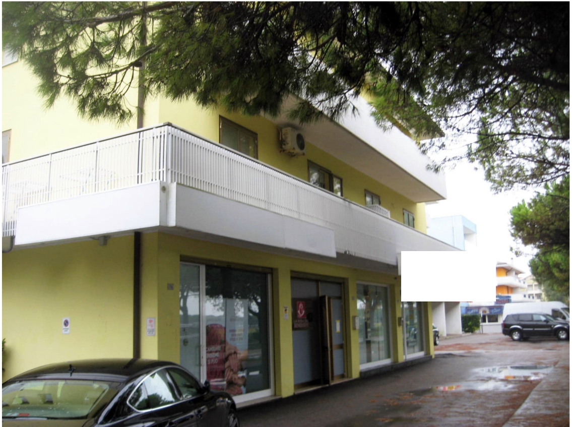
Condominio visto da sud-est