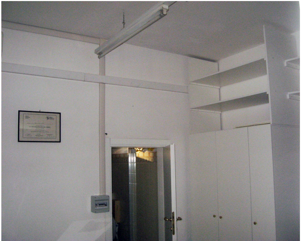
Il vano posteriore con l'accesso al bagno