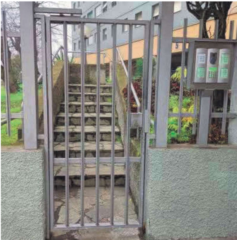
Ingresso del civico numero 5 con citofono condominiale