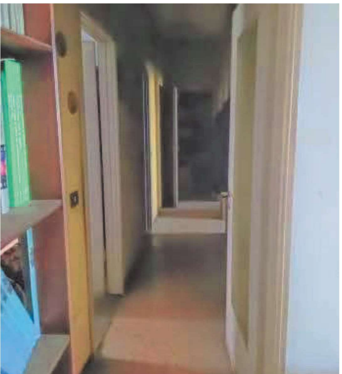
Corridoio di distribuzione