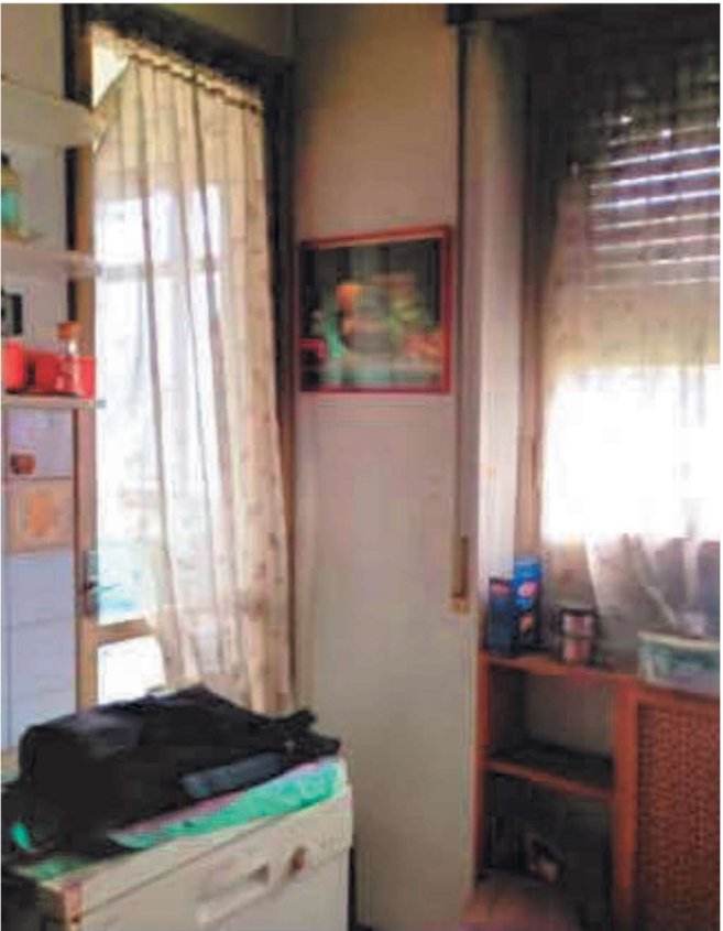
Cucina con terrazzino