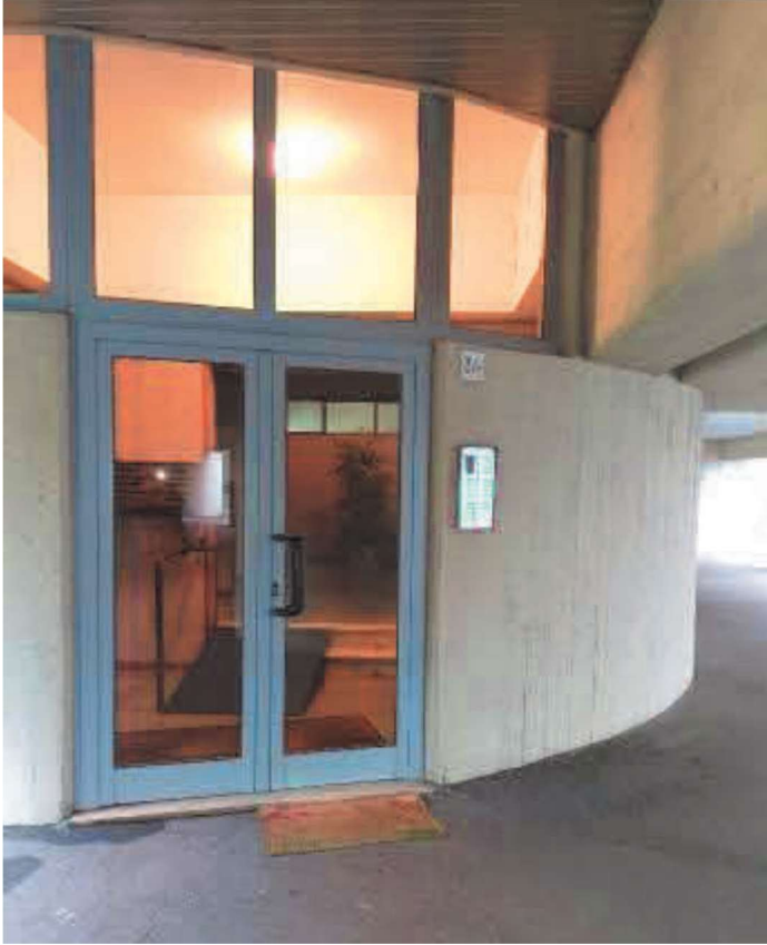
ingresso condominiale posto al Piano Terreno