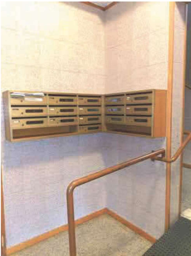
Cassetta delle lettere condominiale