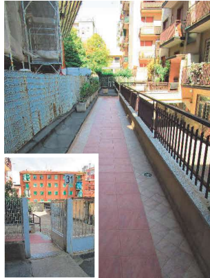
Accesso e andito condominiale