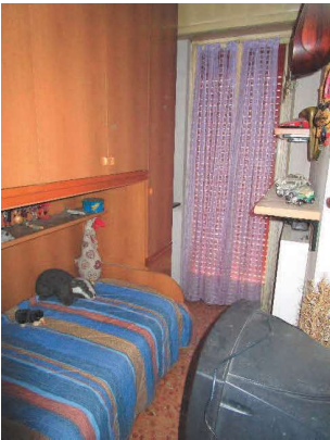
Vano di servizio (non abitabile)

Arch. Francesco Tedone - Appendice - Bresso (MI) - Via Eugenio Villoresi, civ. 31