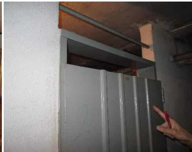
21 locale cantina