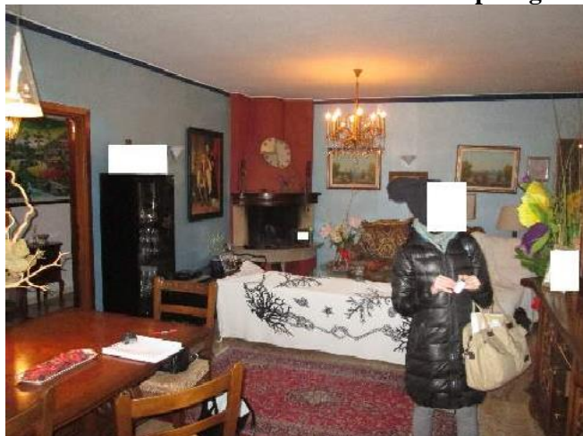
20 soggiorno con camino