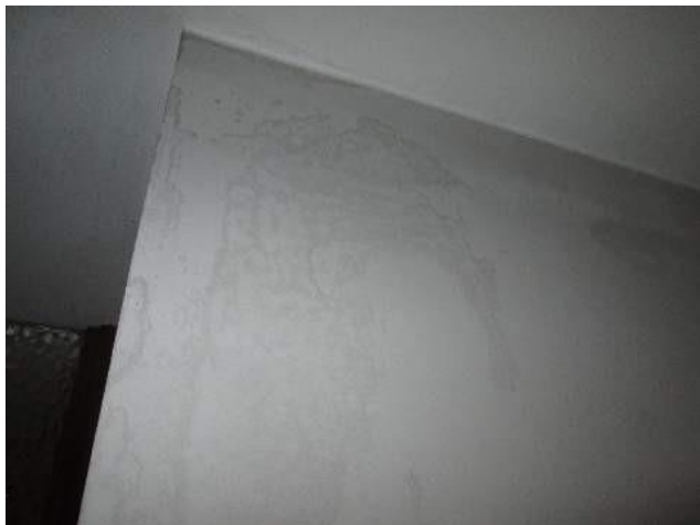
16 umidità/infiltrazione su parete/solaio