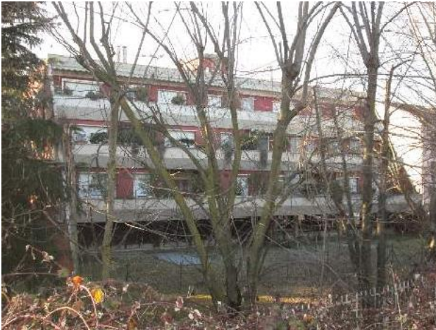
3 prospetto sul retro