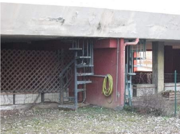
5 scala a chiocciola per il collegamento all'area esclusiva