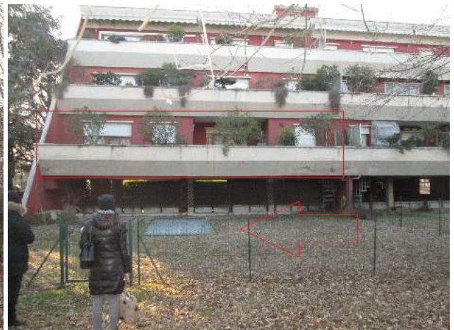
4 localizzazione unità ed area esclusiva