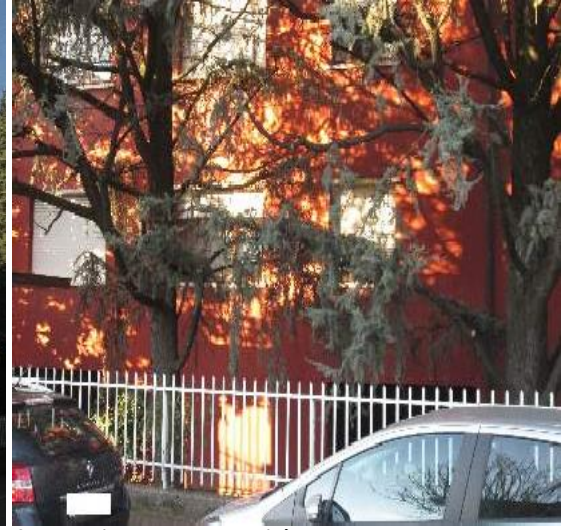
2 scorcio laterale unità