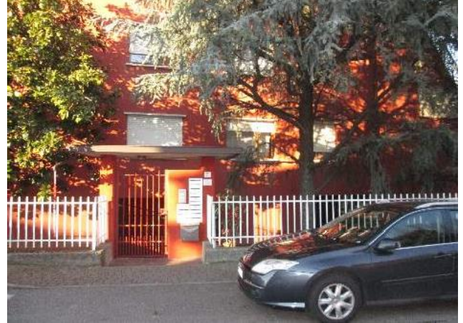
6 ingresso comune dalla pubblica Via esclusiva