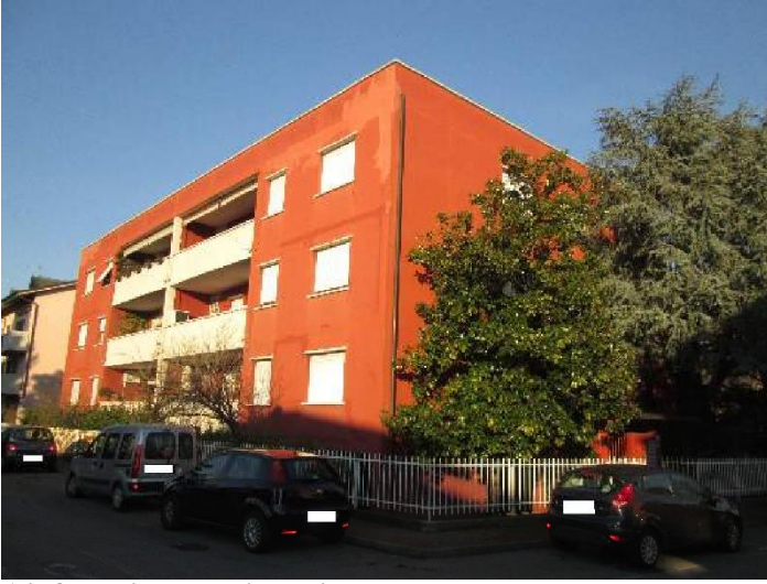
1 il fabbricato residenziale