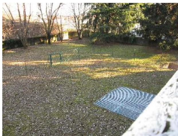
12/13 scala a chiocciola per il collegamento all'area esclusiva