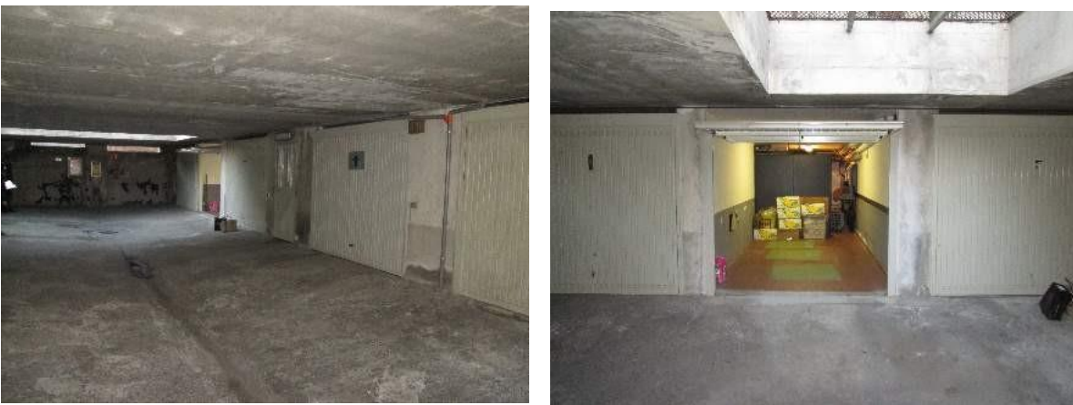
23 localizzazione box ed interno