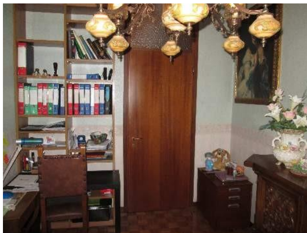
17 locale usufruito ad ufficio