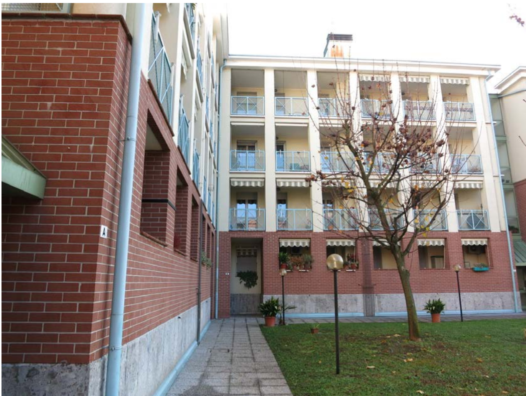
Viste esterne del complesso immobiliare