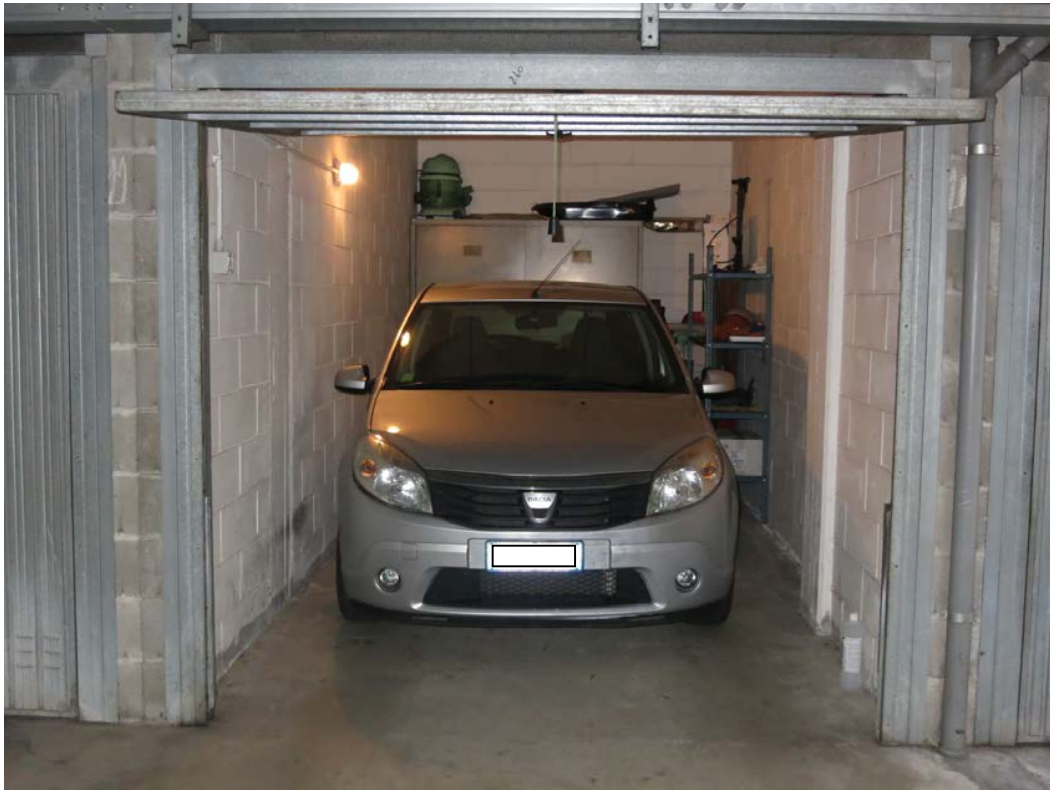
Vista interna del box