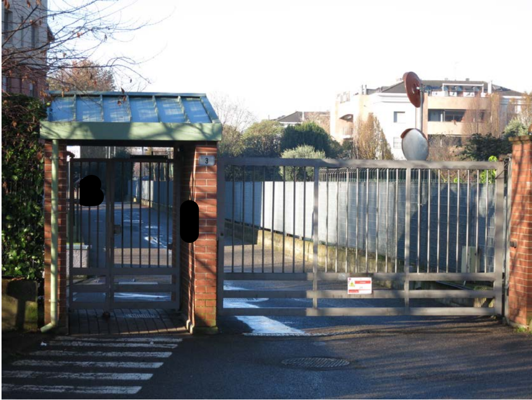
Ingresso al complesso