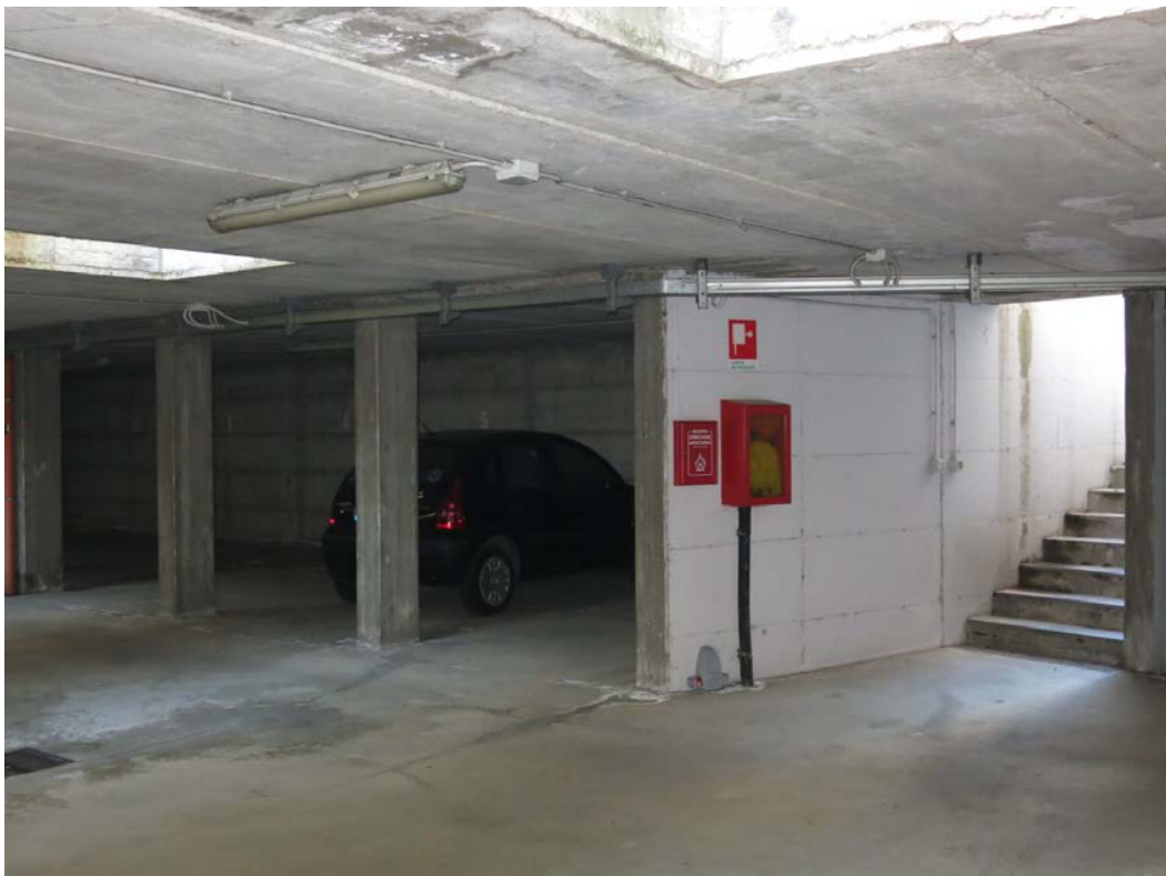
Corsello di accesso al posto auto