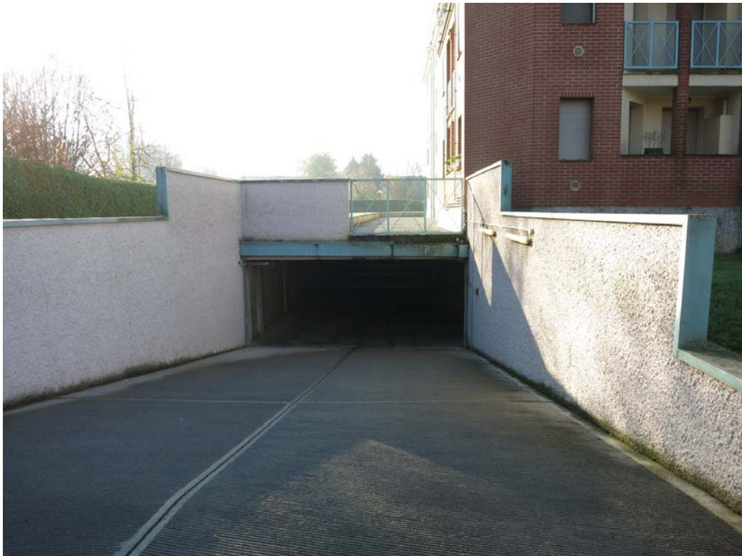
Rampa di accesso al piano parcheggi