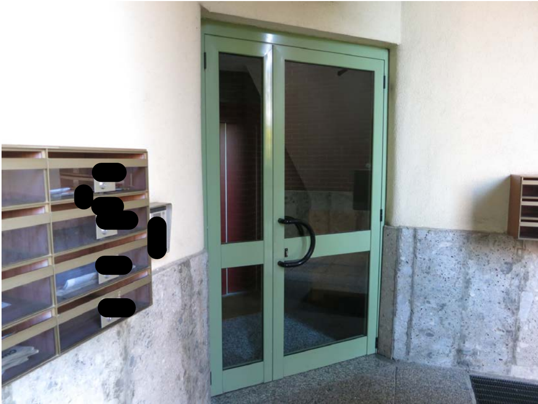
Ingresso al vano scala