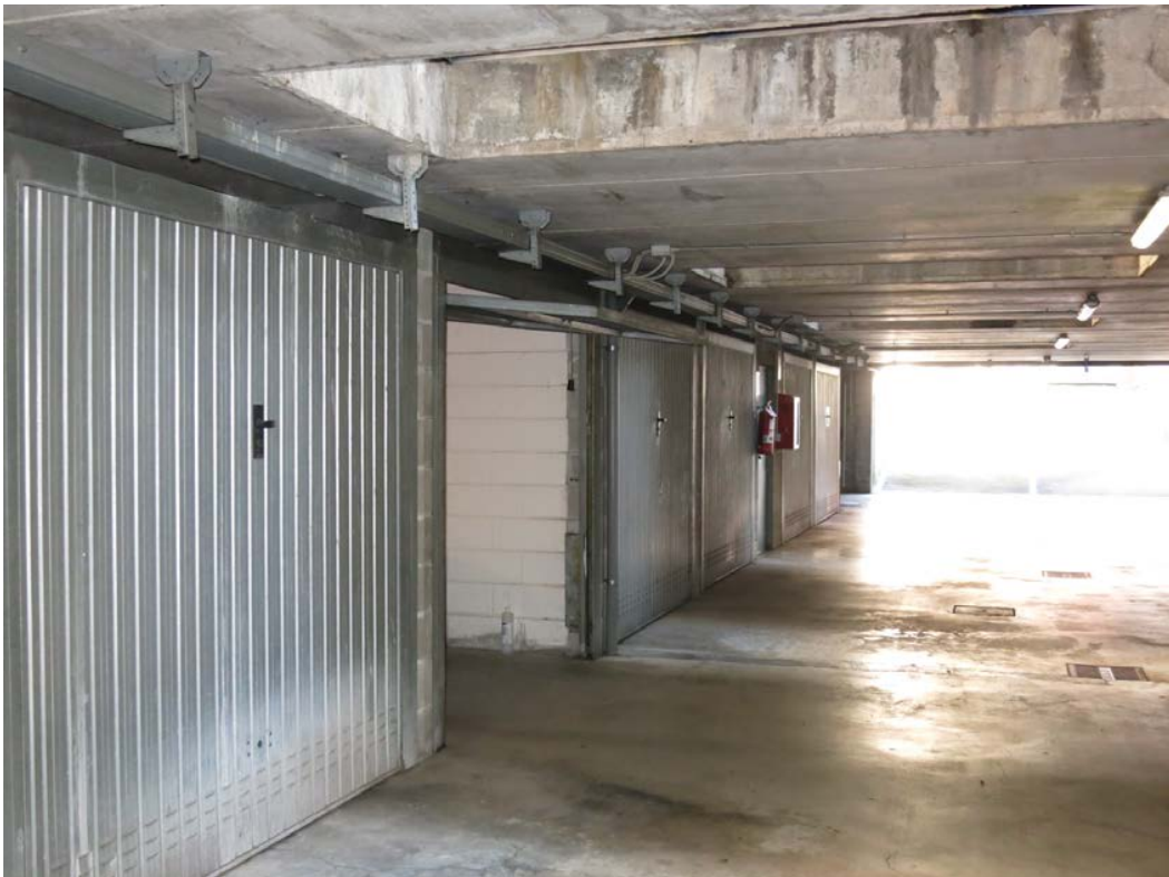
Corsello di accesso al box