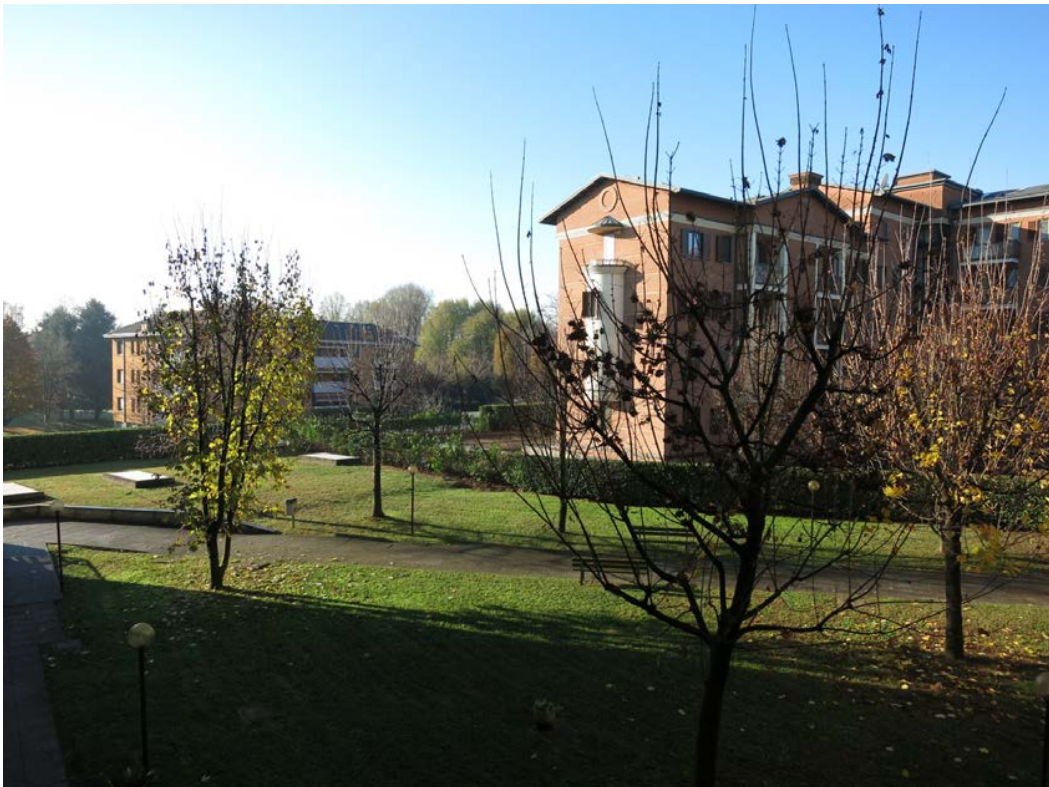
Vista dal balcone