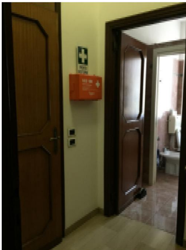
Foto 19 - Disimpegno bagno