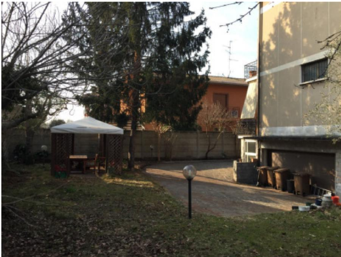
Foto 33 - Il retro del fabbricato con il giardino