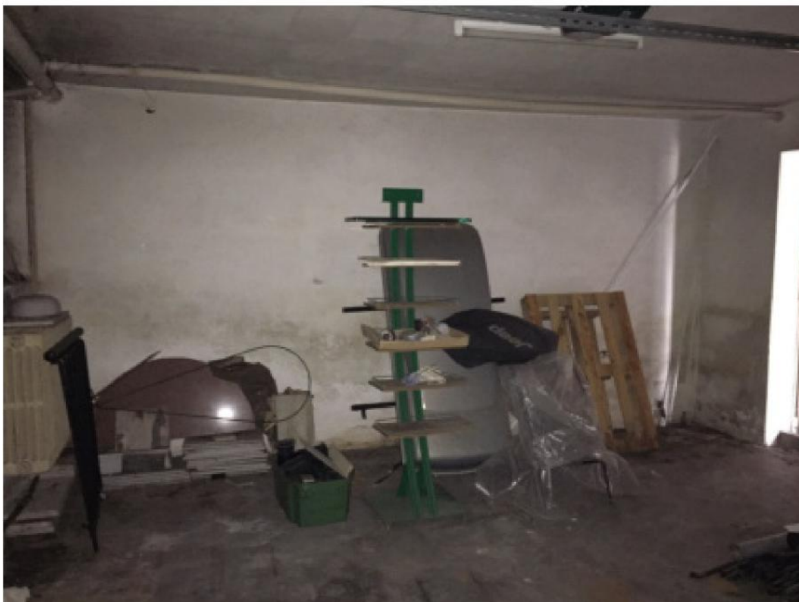
Foto 38 - Box doppio