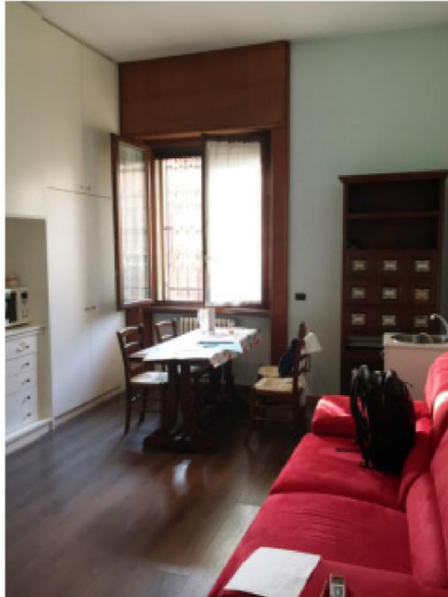
Foto 23 - Laboratorio