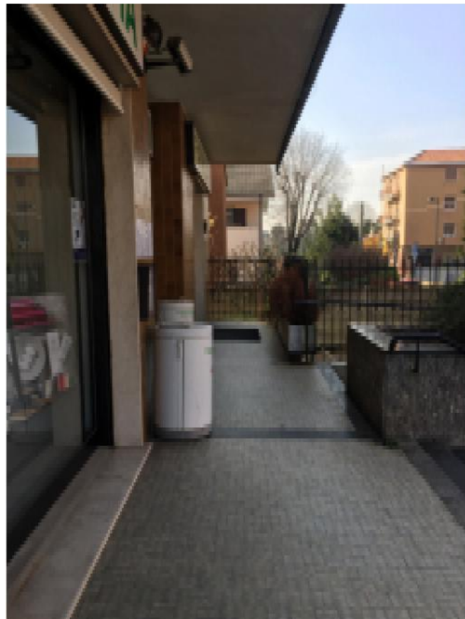
Foto 08 - Terrazza di accesso all'unità