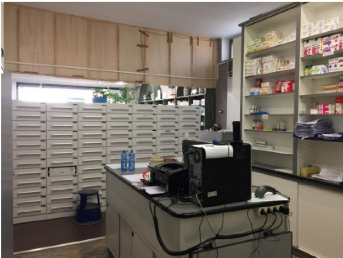
Foto 17 - Retro negozio