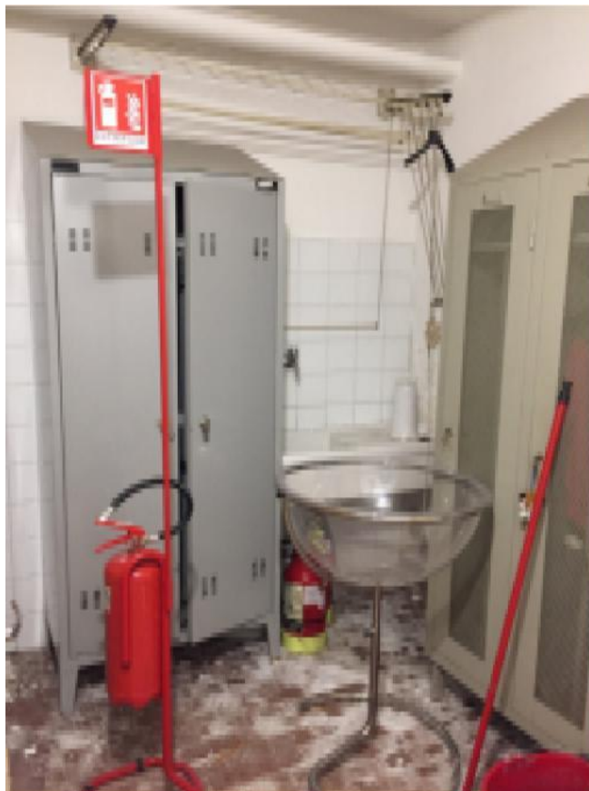
Foto 29 - Disimpegno al primo piano interrato