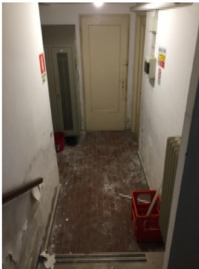
Foto 28 - Disimpegno al primo piano interrato