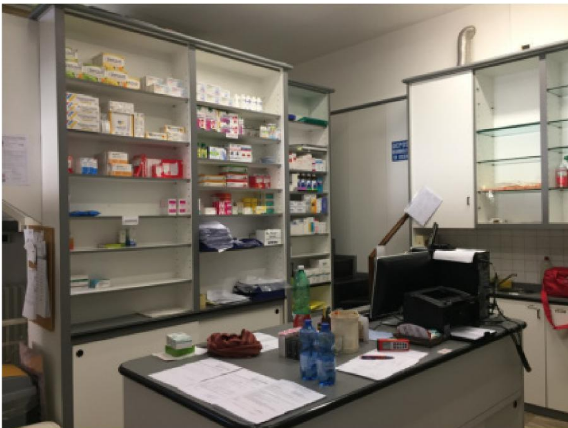
Foto 18 - Retro negozio