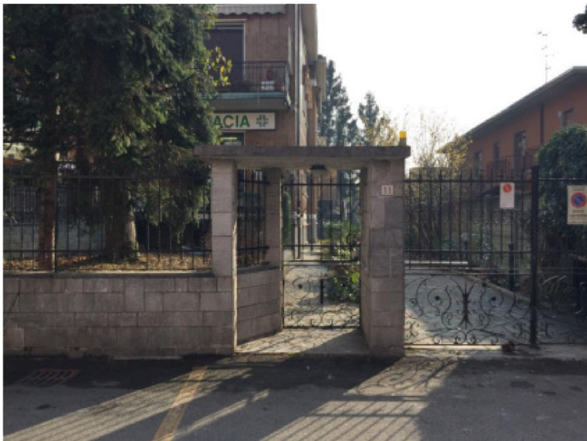
Foto 03 - L'accesso del fabbricato al civico 11 di via Trieste