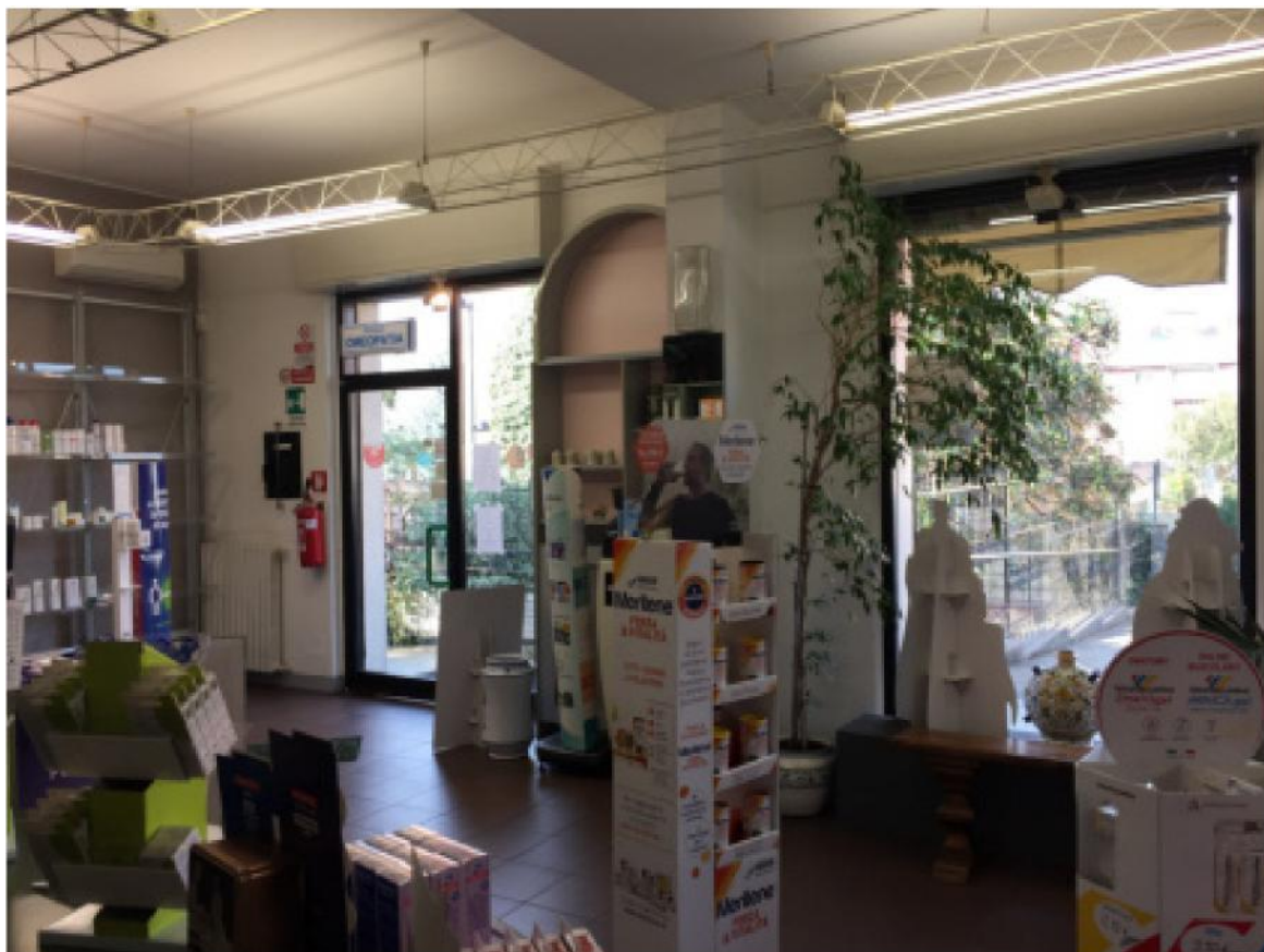
Foto 09 - Ingresso al negozio