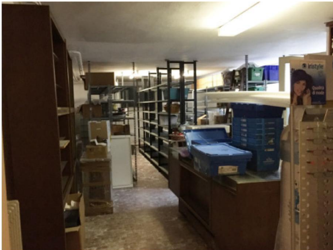
Foto 31 - Cantina al primo piano interrato