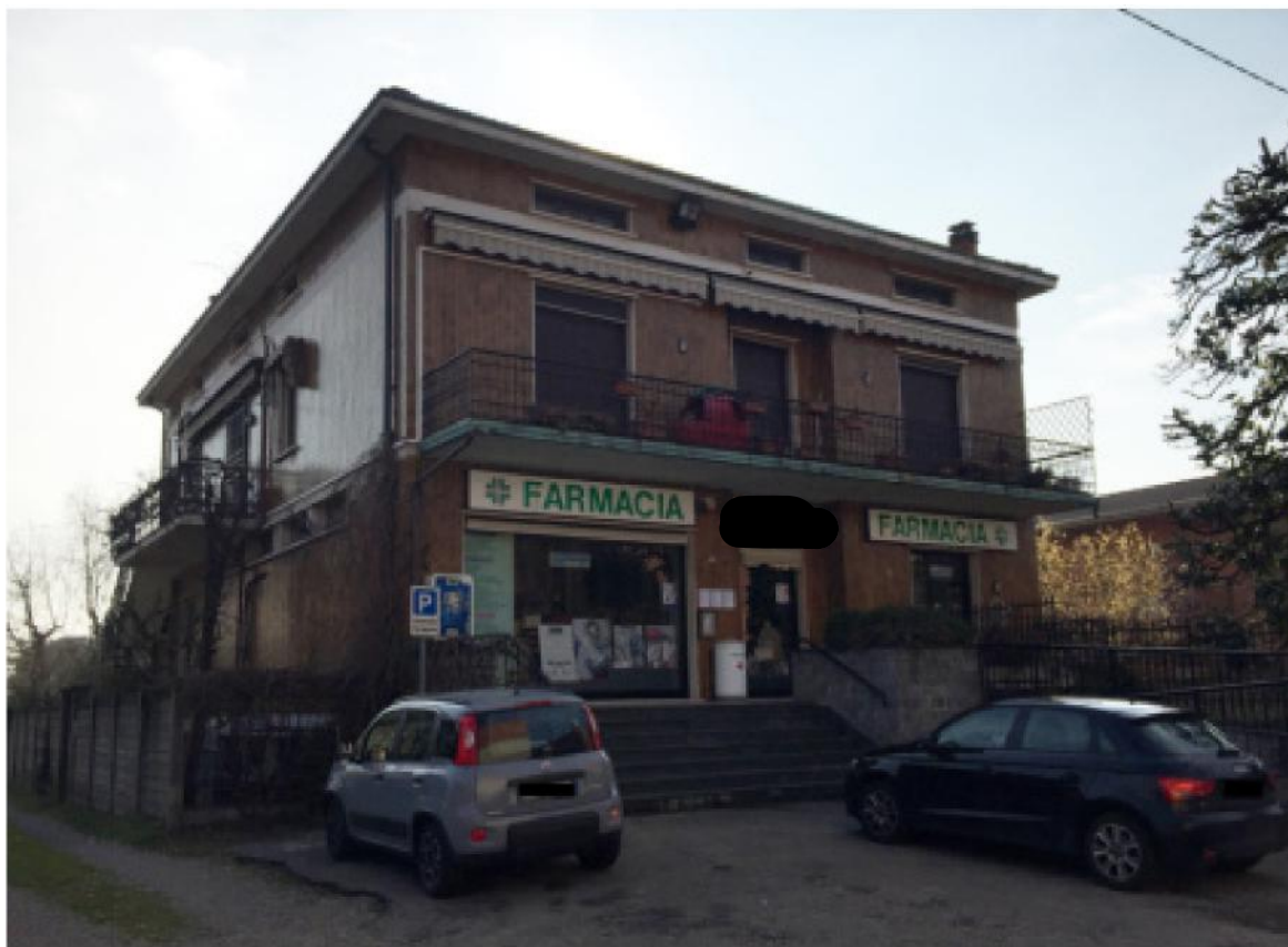
Foto 01 - Il fabbricato su via Trieste