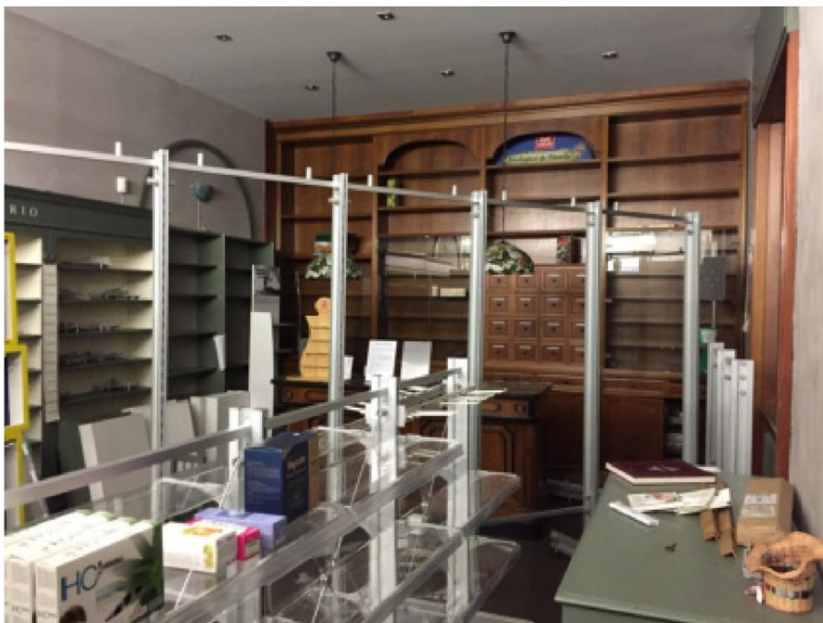
Foto 12 - Negozio