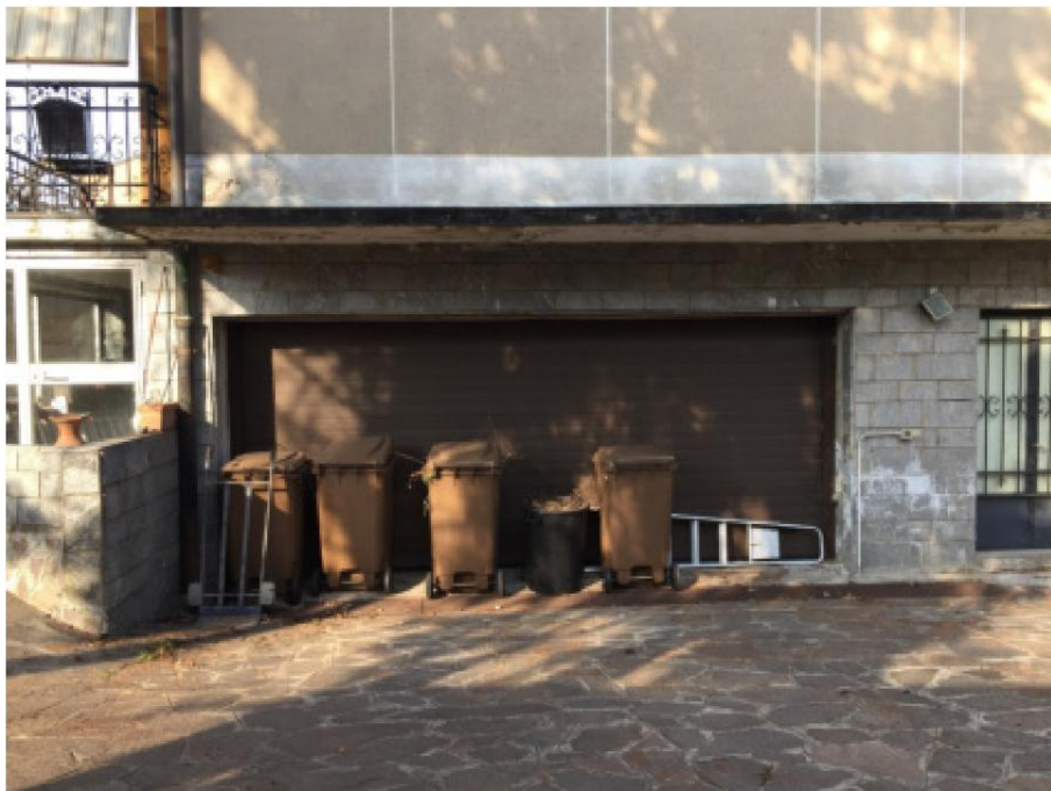
Foto 35 - Box doppio sul retro del fabbricato