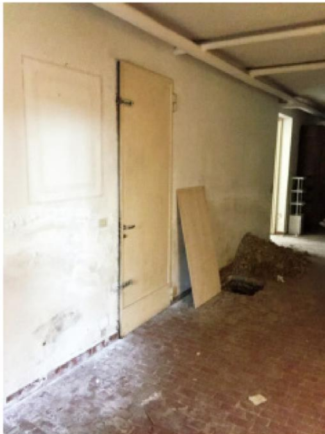
Foto 39 - Accesso al box dal corridoio al primo piano interrato