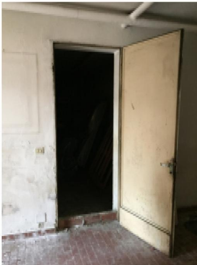
Foto 40 - Accesso al box dal corridoio al primo piano interrato