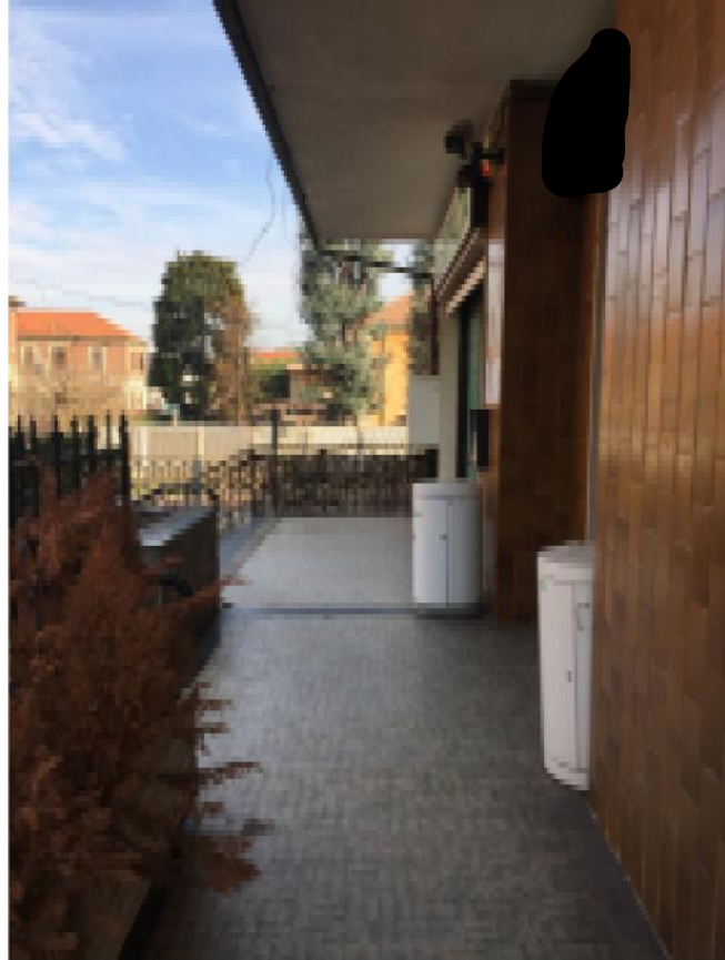
Foto 07 - Terrazza di accesso all'unità