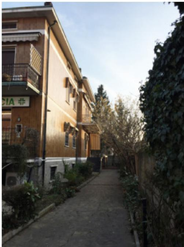
Foto 05 - Vialetto interno laterale del fabbricato