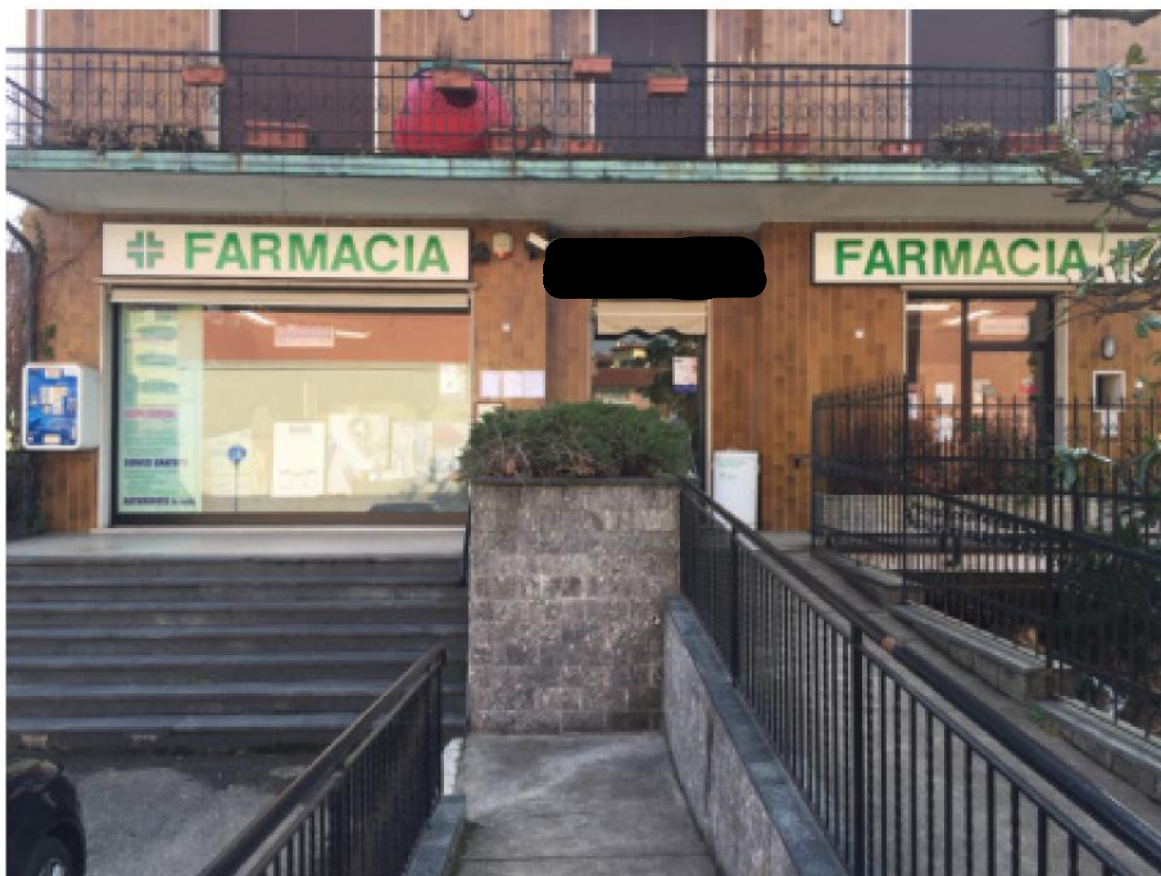
Foto 04 - Prospetto del fabbricato con accesso all'unità su via Trieste