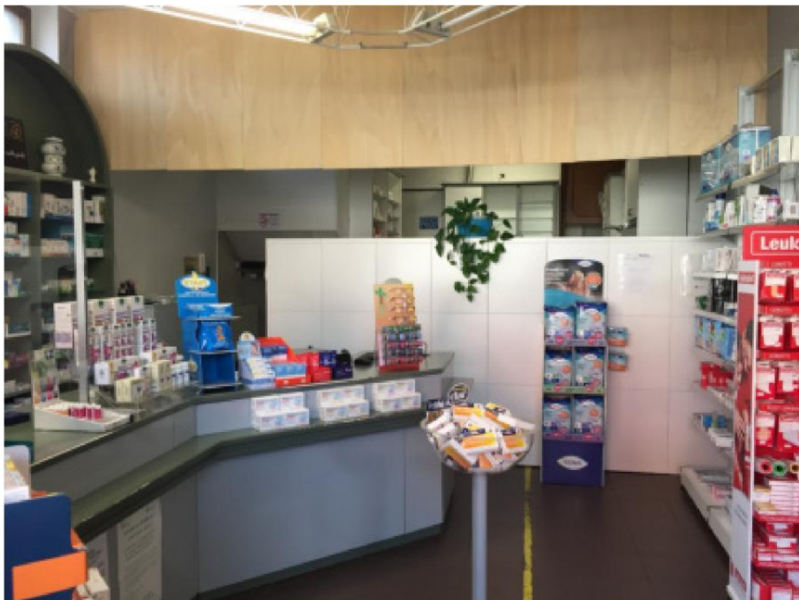
Foto 15 - Negozio