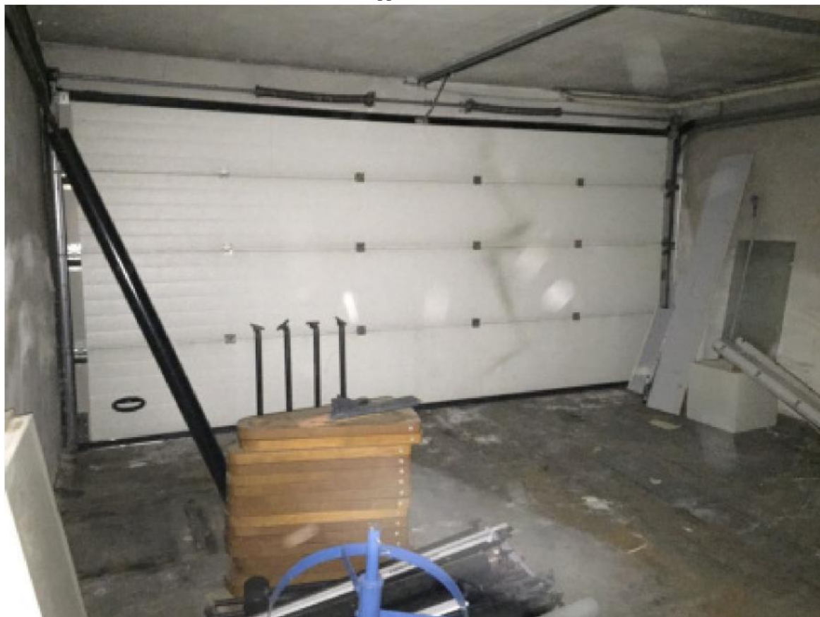
Foto 36 - Box doppio