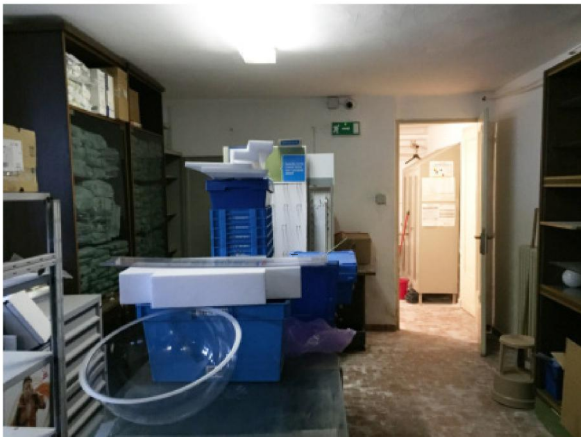
Foto 32 - Cantina al primo piano interrato