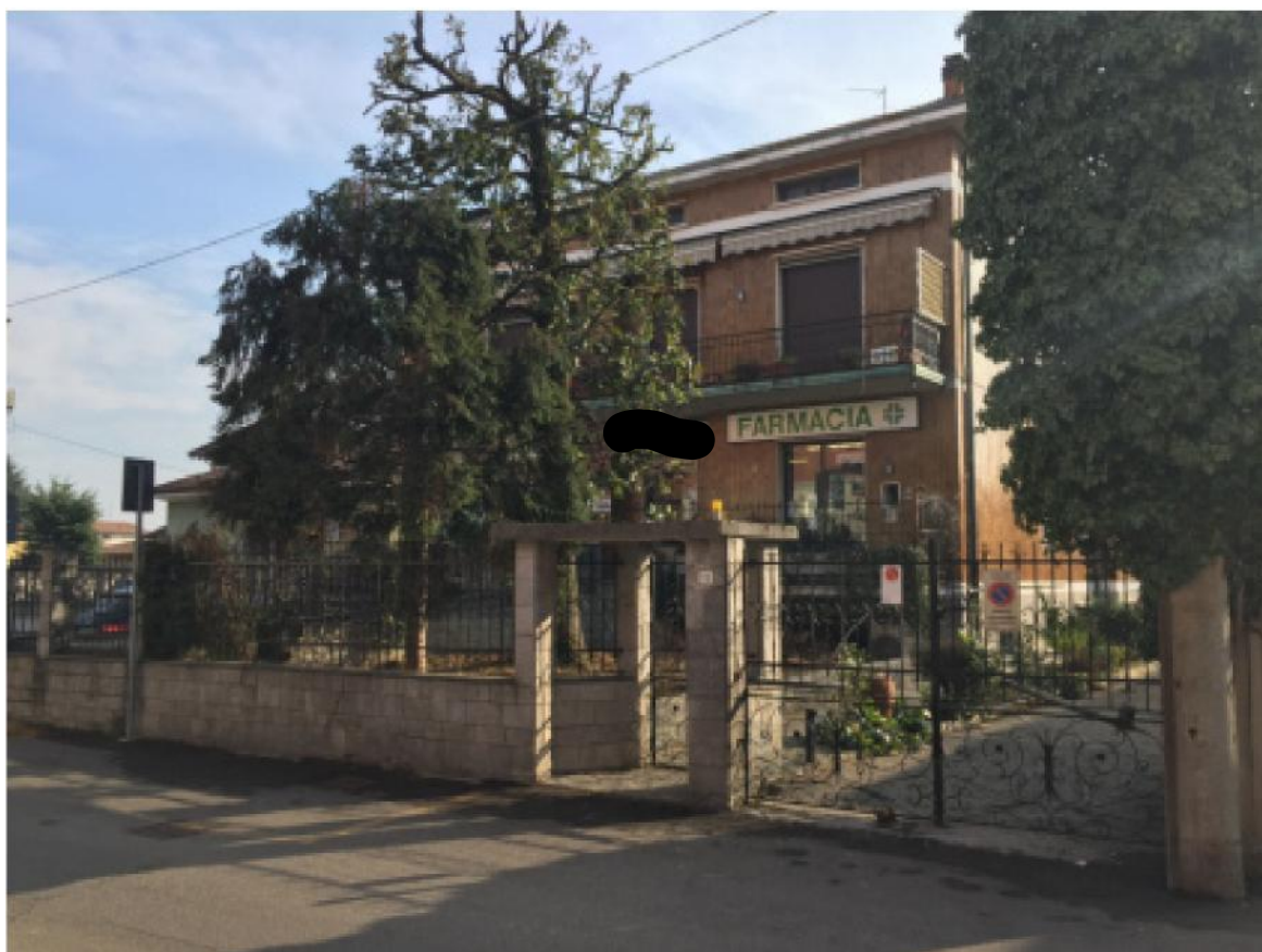
Foto 02 - Il fabbricato su via Trieste