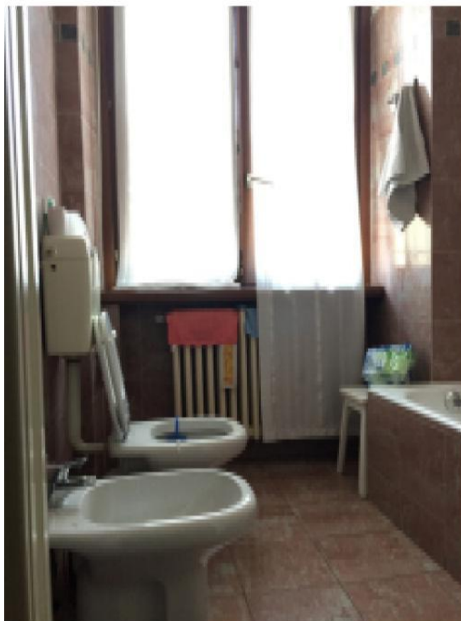
Foto 20 - Bagno