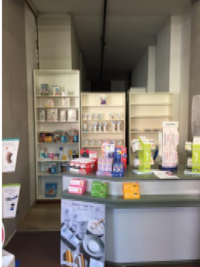
Foto 13 - Negozio