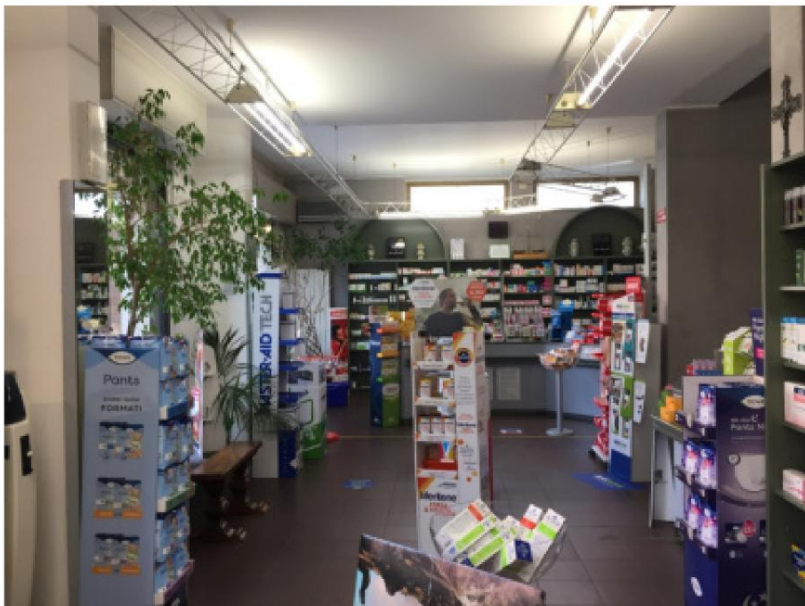
Foto 10 - Negozio