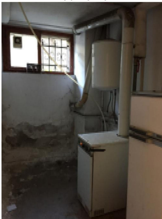
Foto 30 - Caldaia al primo piano interrato