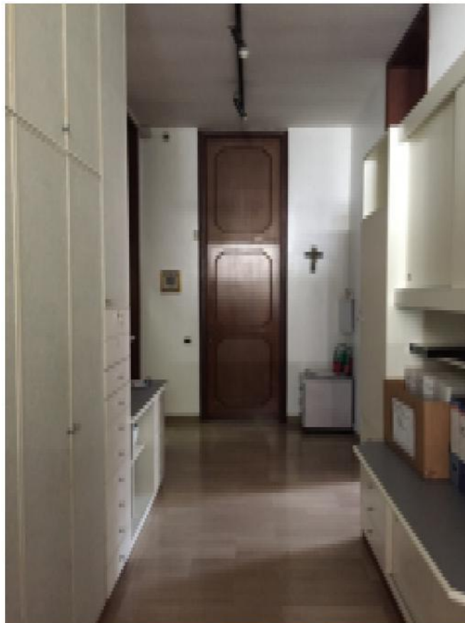
Foto 21 - Disimpegno