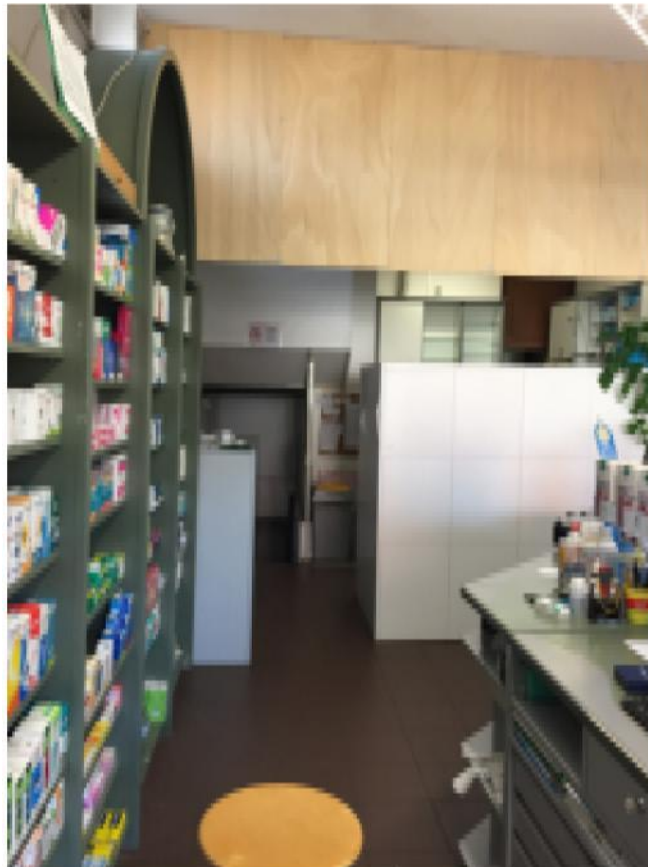
Foto 14 - Negozio