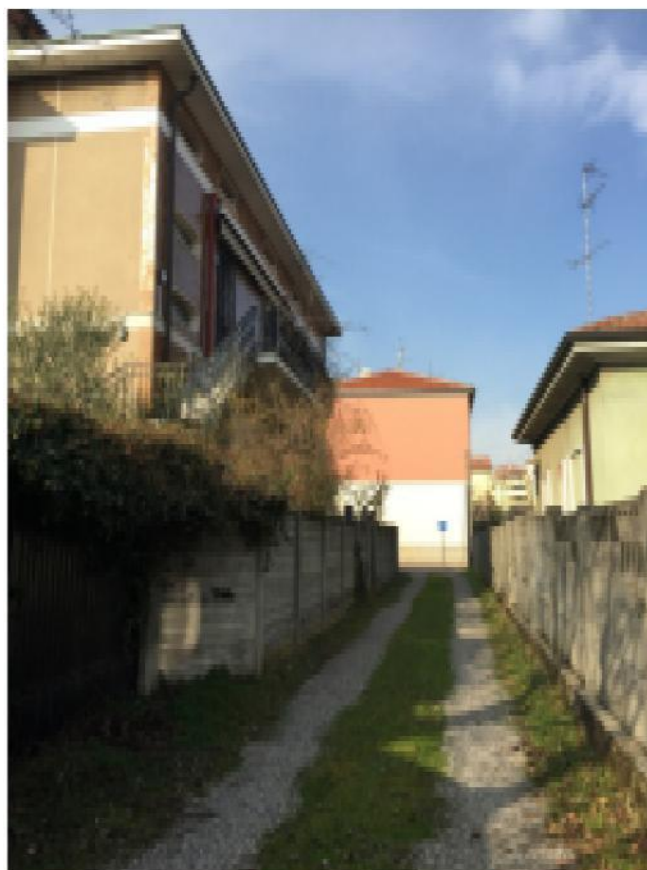
Foto 06 - Vialetto esterno laterale del fabbricato