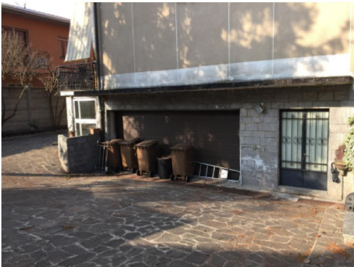
Foto 34 - Accesso al box doppio