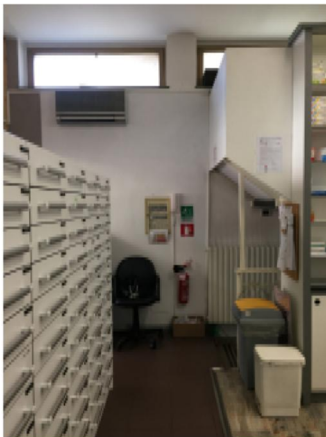
Foto 26 - Negozio