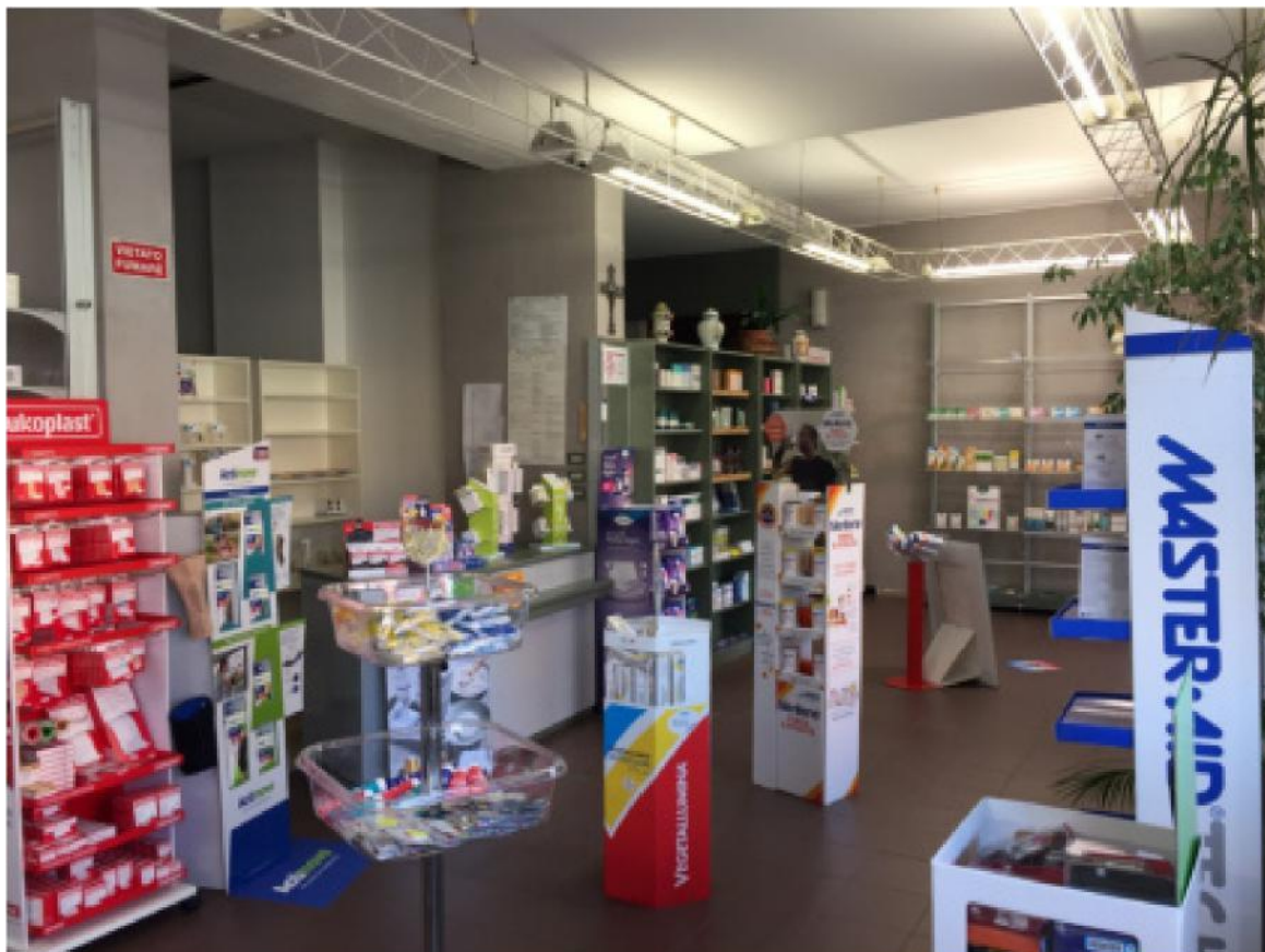
Foto 11 - Negozio