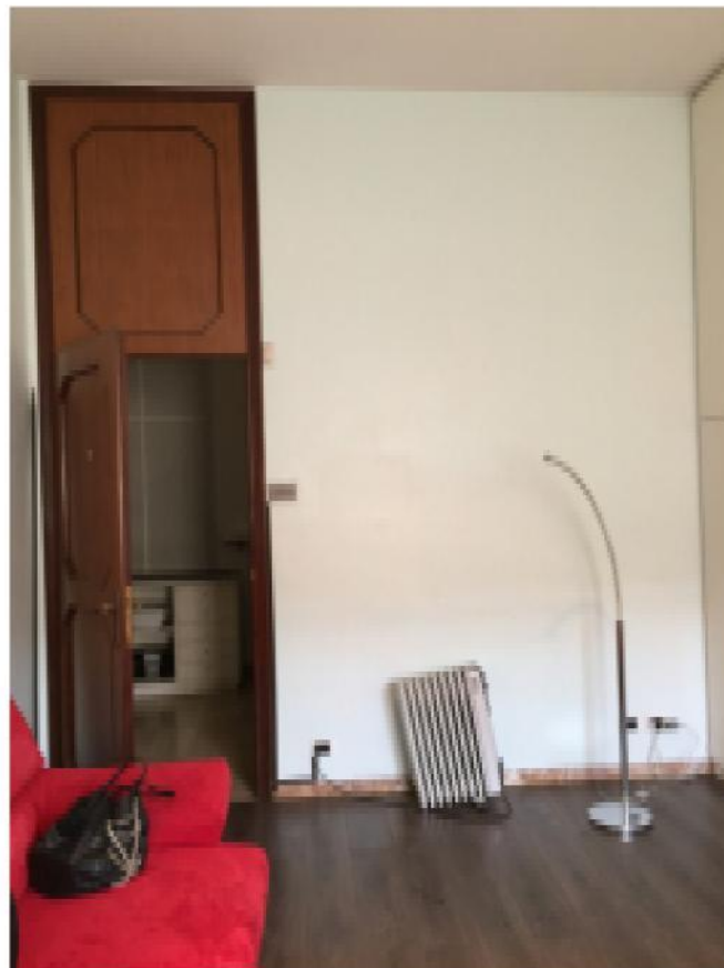
Foto 24 - Laboratorio