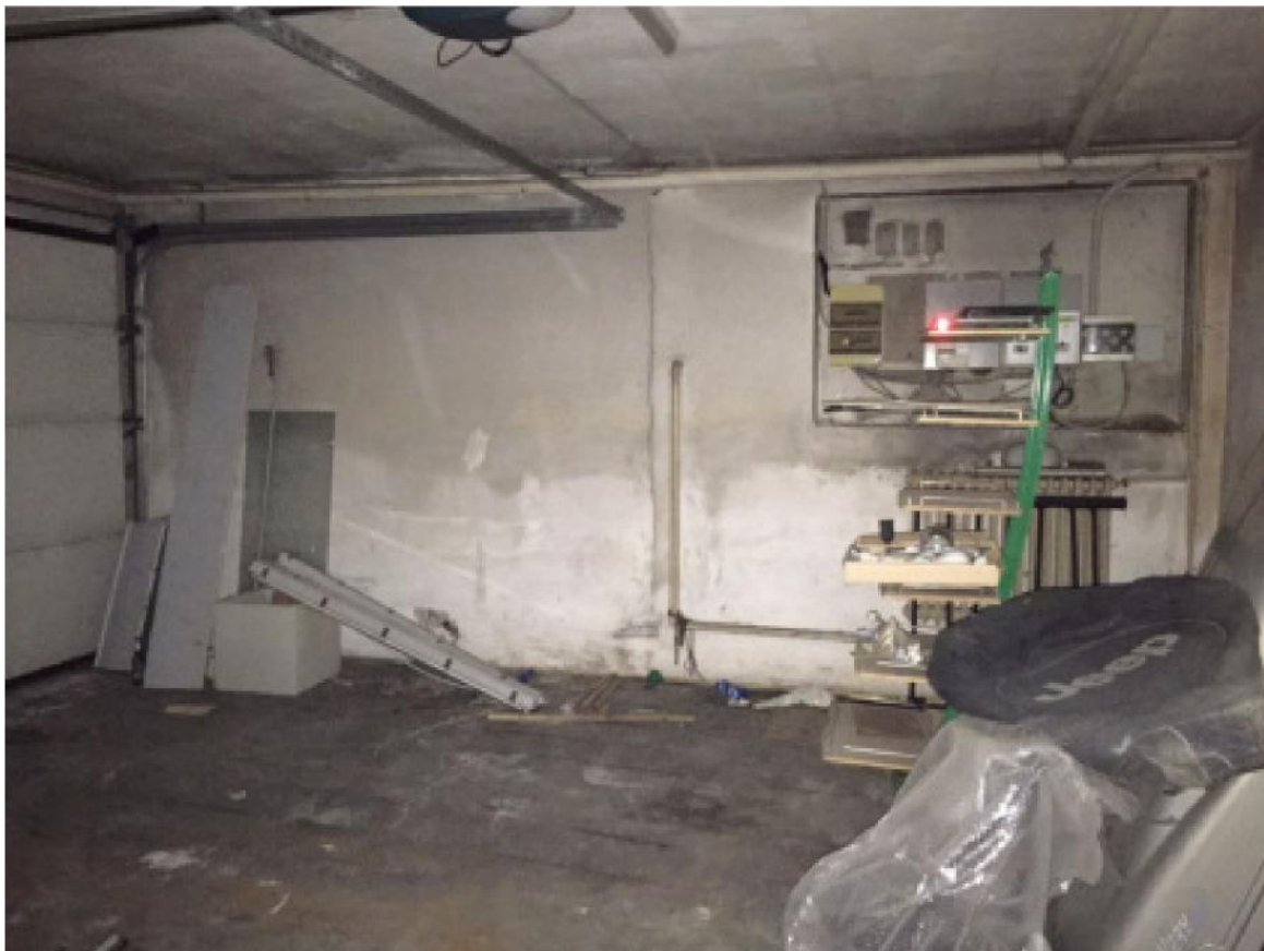
Foto 37 - Box doppio