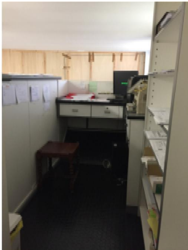
Foto 25 - Soppalco interno