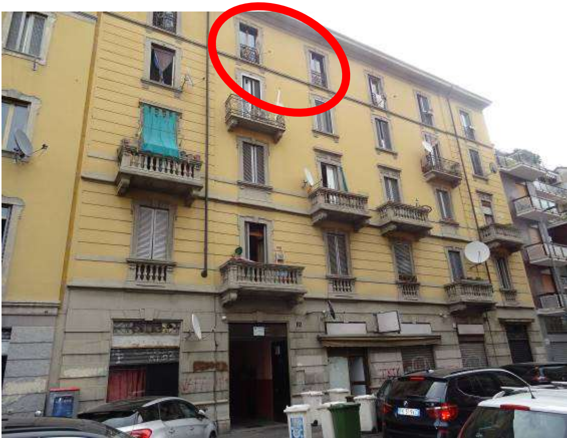
Milano Via Arquà 16 complesso condominiale - individuazione dell'unità