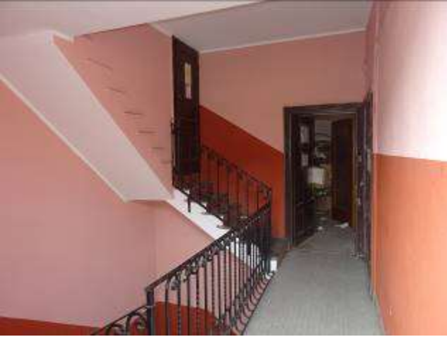
Scala di accesso ai solai