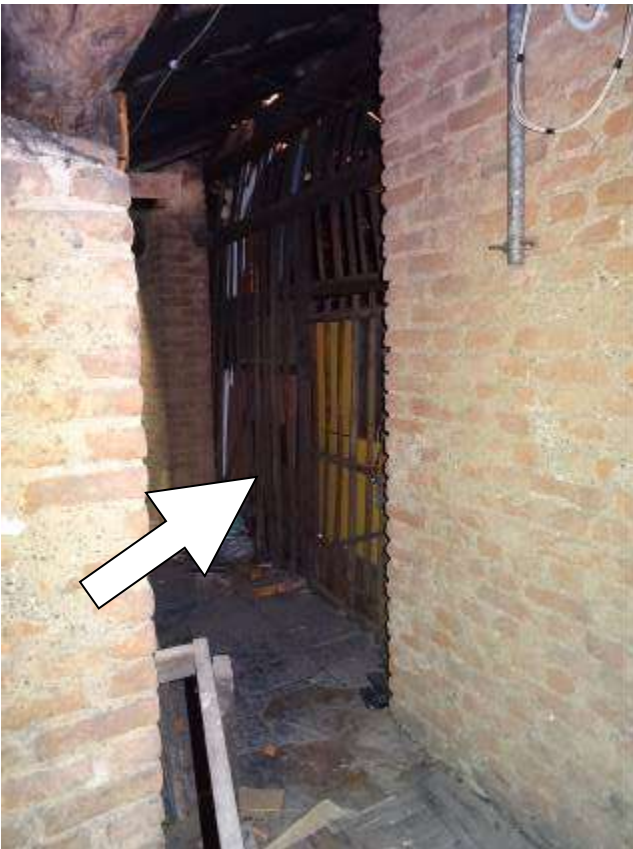
Solaio di pertinenza