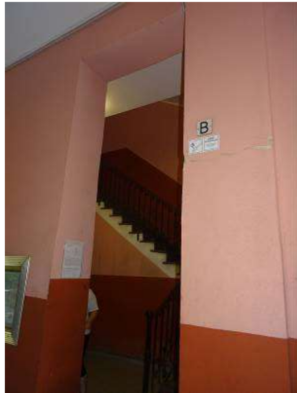
Corpo scala B