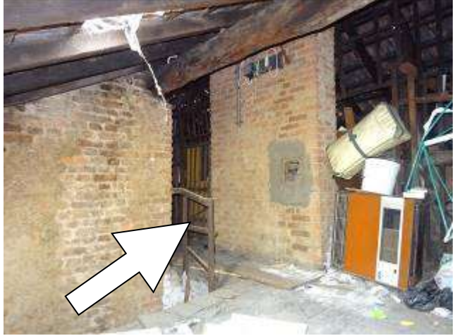
Individuazione del solaio di pertinenza