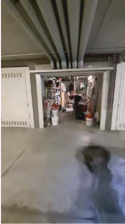
BOX SUB 46