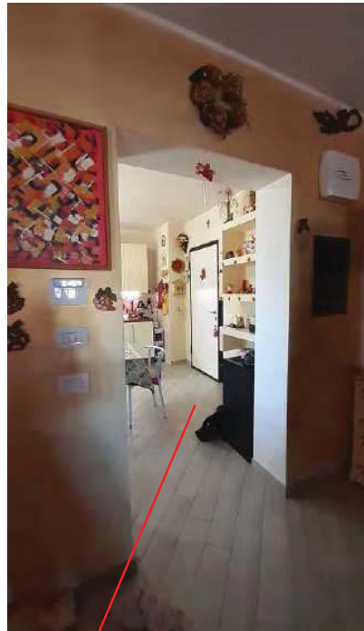
PASSAGGIO CUCINA/SOGGIORNO ( CHE DOVREBBE ESSERE L'INGRESSO