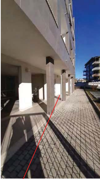
AREA DI PERTINENZA