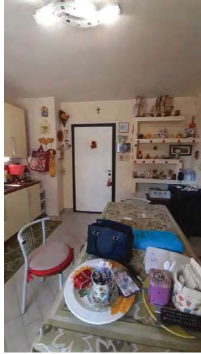
INGRESSO /CUCINA ( ABUSIVO AL POSTO DEL PORTICO DA PRATICA EDILIZIA)