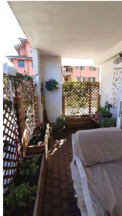
PORTICO ( SECONDO PORTICO DA PRATICA EDILIZIA)