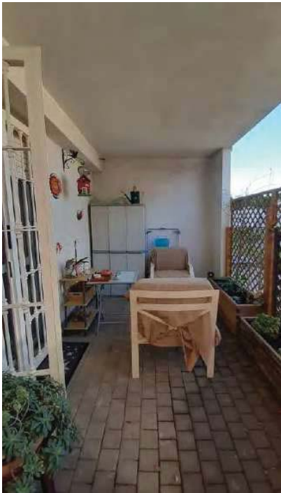
PORTICO ( SECONDO PORTICO DA PRATICA EDILIZIA)