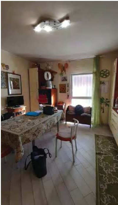
INGRESSO/CUCINA ( AL POSTO DEL PORTICO DA PRATCA EDILIZIA)