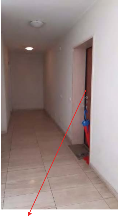
SUB 704 INGRESSO