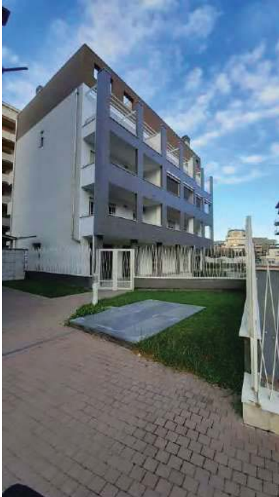
VIA DON MINZONI,5C - FRONTE

BUCCINASCO (MI) – VIA DON MINZONI, 5C DATA SOPRALLUOGO 04/11/2022 APPARTAMENTO FG. 5, PART. 393, SUB. 704 + BOX- FG. 5, PART. 393, SUB. 46