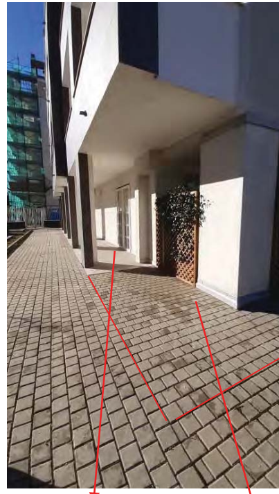
AREA DI PERTIENZA ( VEDI SCHEDA CATASTALE)