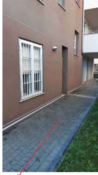
AREA DI PERTINENZA