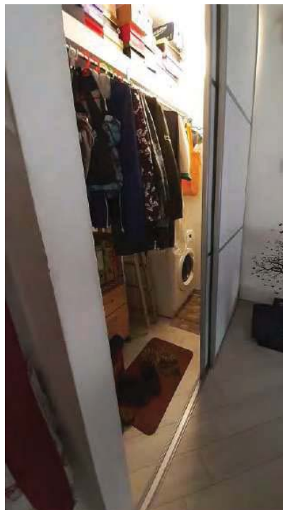
ANGOLO LAVATRICE ( DOVREBBE ESSERE L'ANGOLO COTTURA DA PRATICA EDILIZIA)