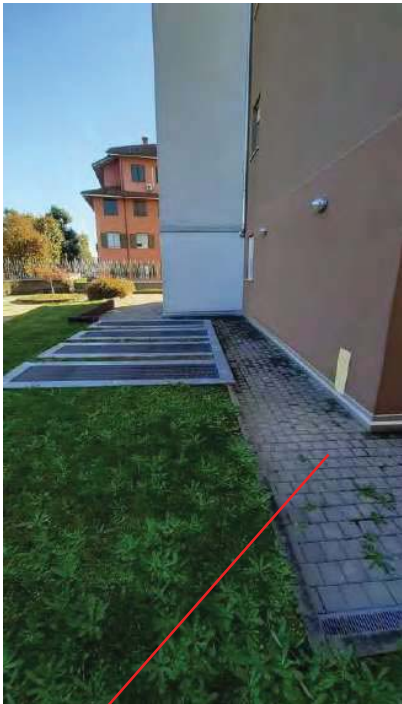
AREA DI PERTINENZA