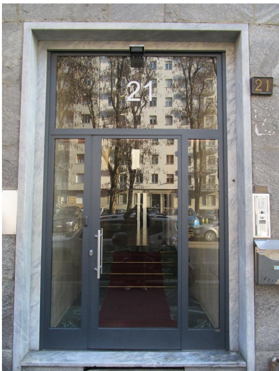
Foto 1/2 - Vista dello stabile di via Pisanello 21