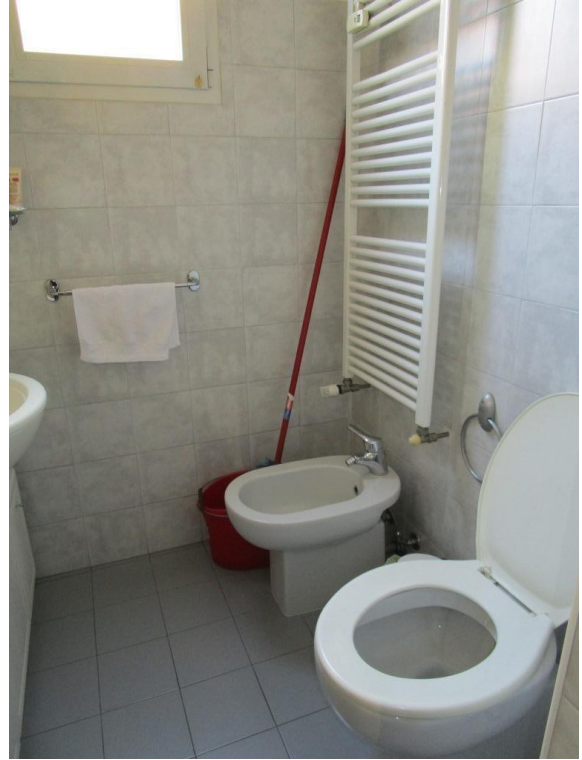
Foto 12 - Bagno