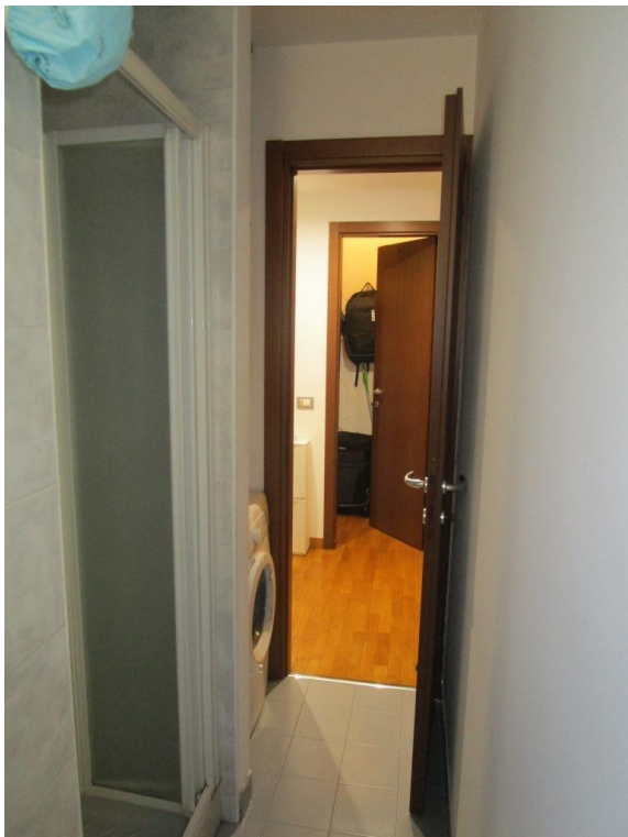
Foto 13 - Bagno