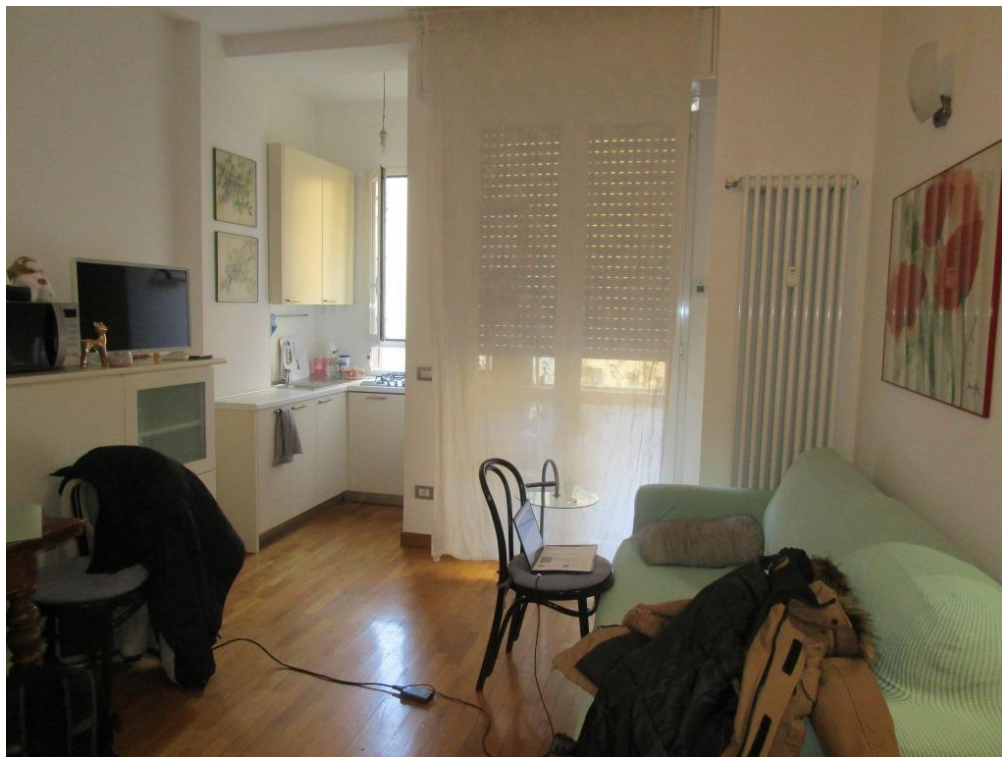
Foto 7 - Soggiorno con angolo cottura e accesso al balcone