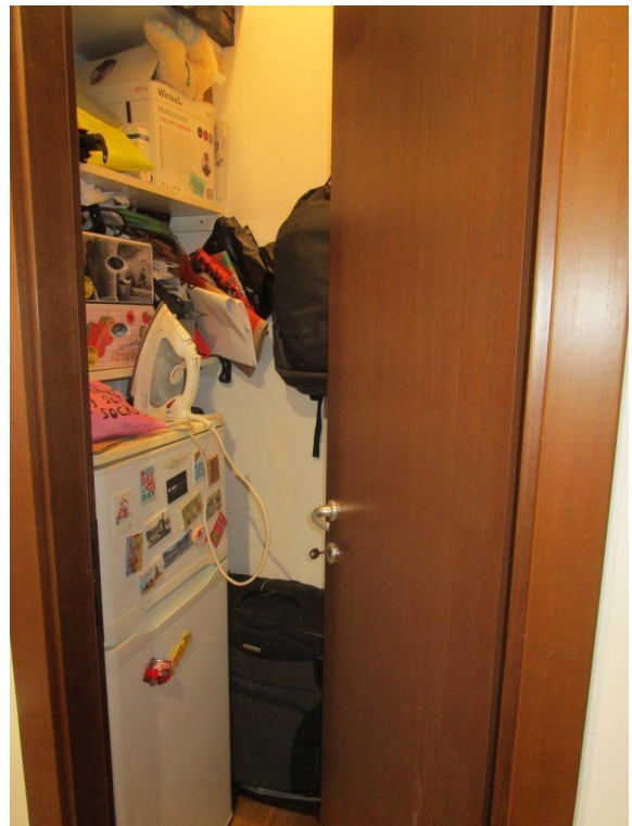
Foto 14 - Ripostiglio