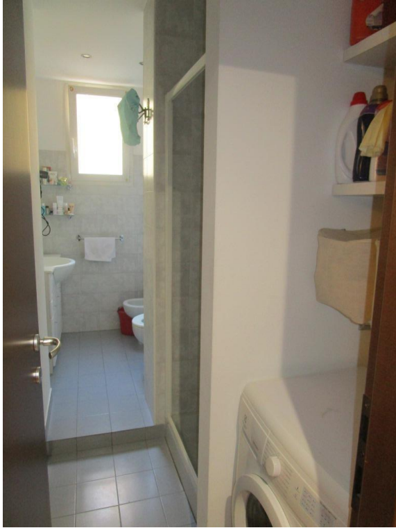
Foto 11 - bagno