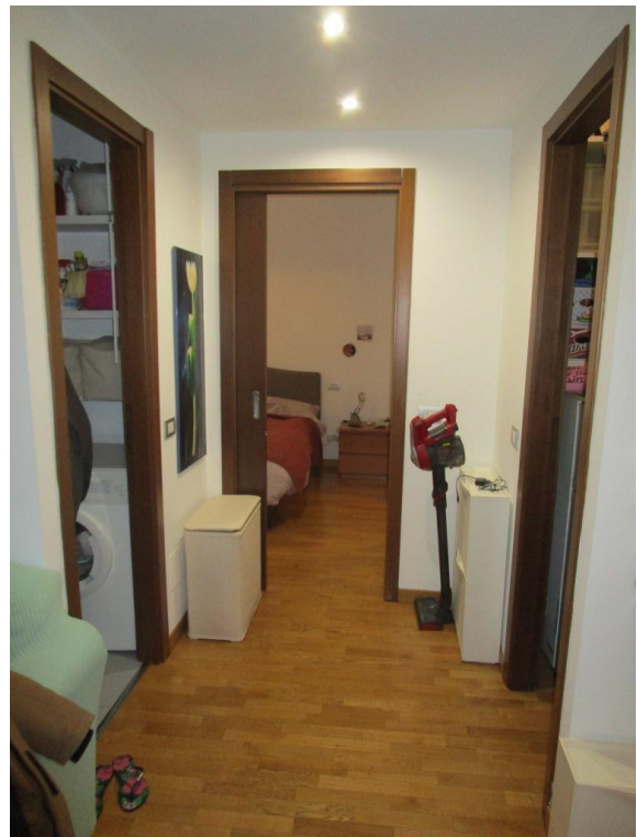
Foto 10 - Disimpegno