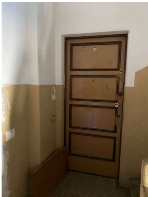
Porta d'ingresso all'appartamento sulla scala