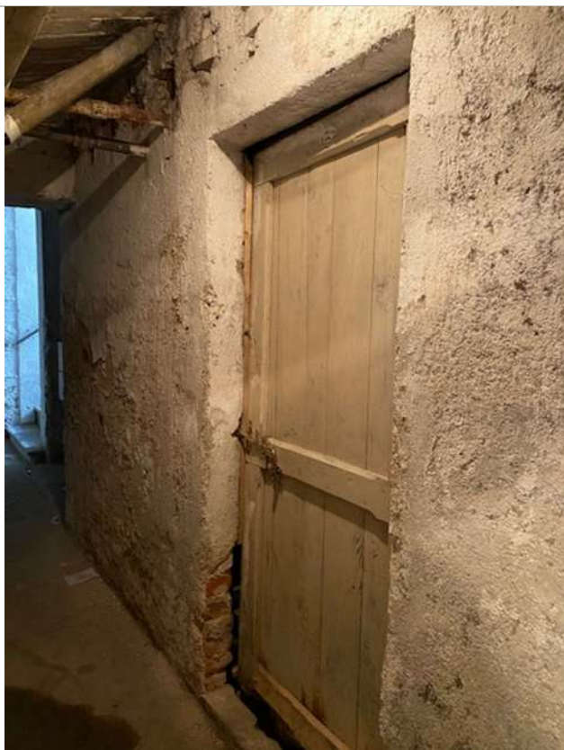
Porta della cantina di pertinenza