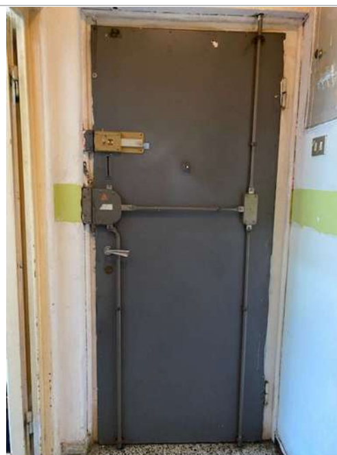
Interno della porta d'ingresso