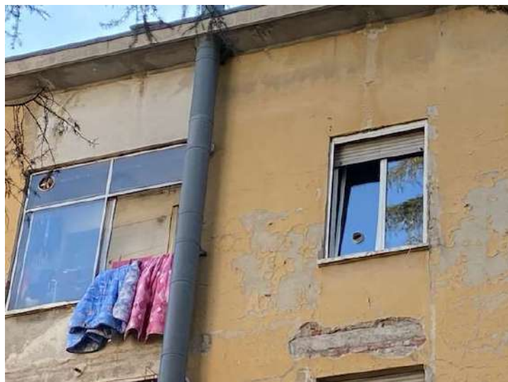
Particolare su serramenti abusivi a chiusura del balcone dell'esecutata.