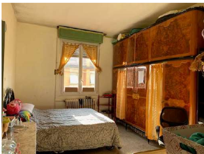
Camera da letto.