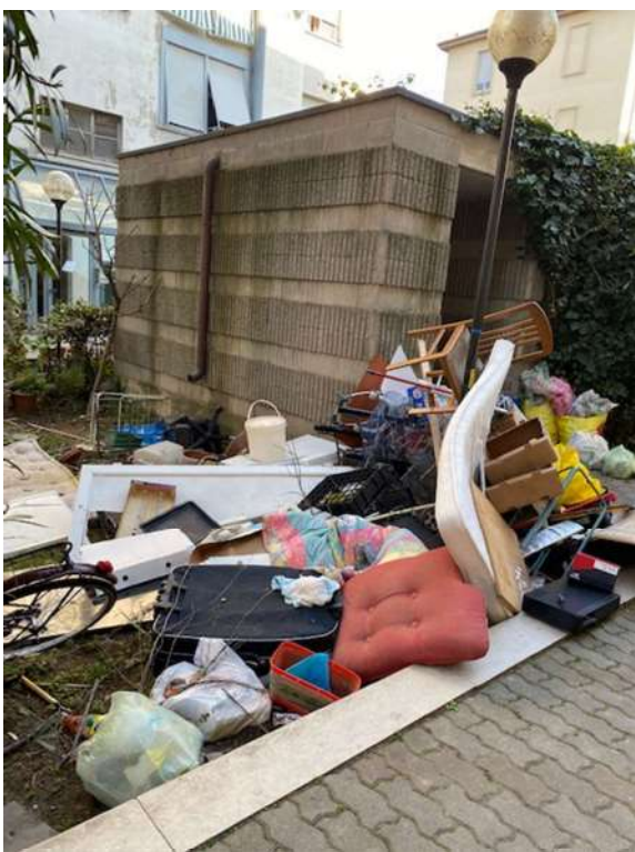
Stato dei locali immondizie nel cortile