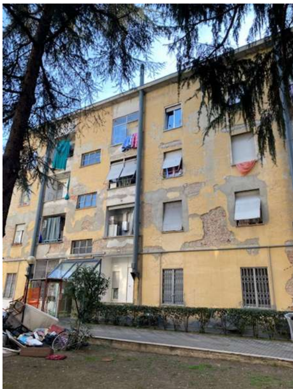
Condizioni facciata su cortile scala F