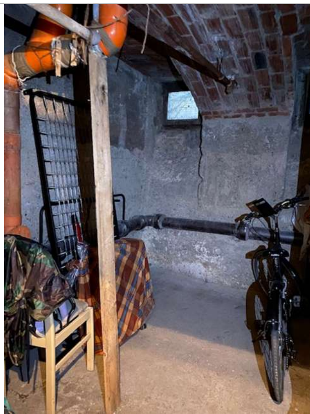
Cantina con vista su impianti passanti all'interno