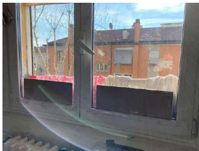
Infissi esterni in pvc e doppio vetro