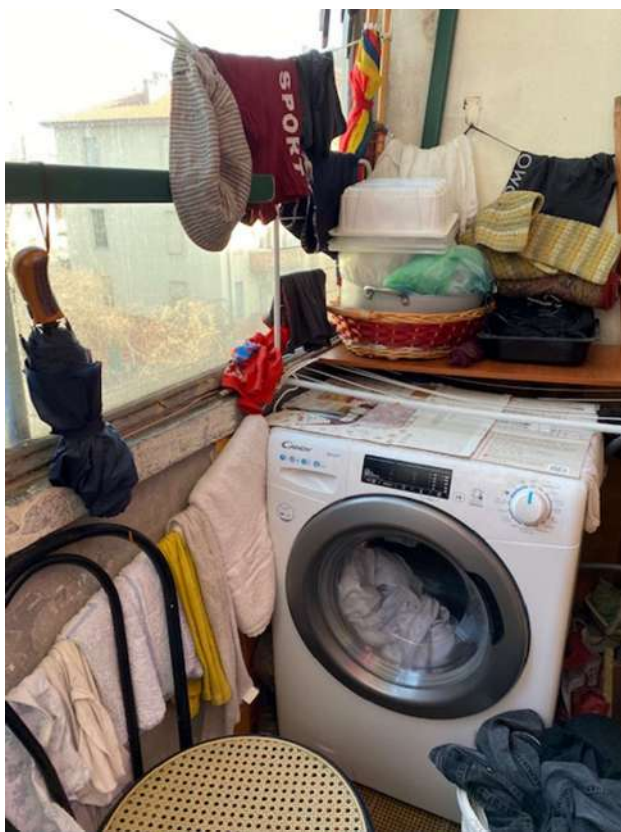
Balcone con serramento a chiusura abusiva