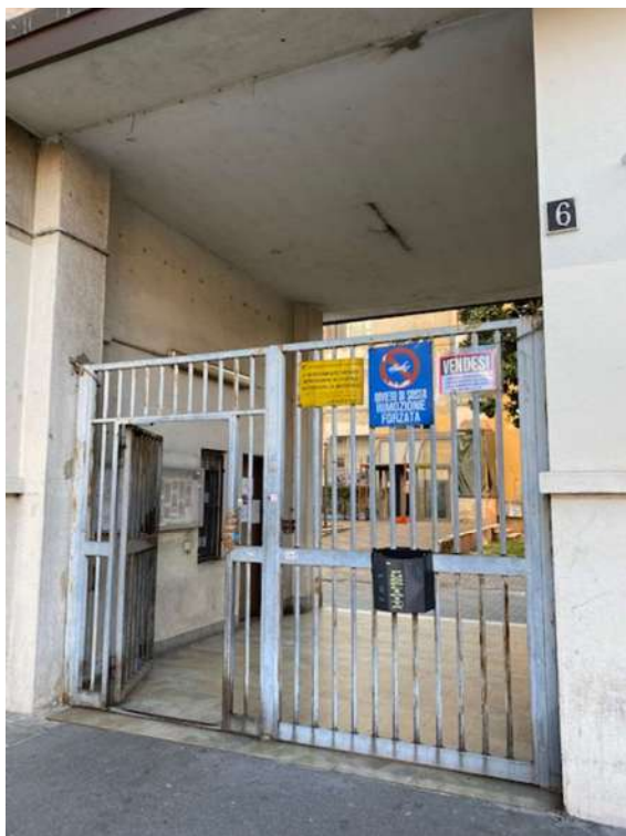
Cancello d'ingresso su strada.