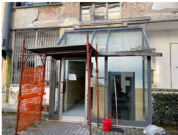
Ingresso scala F