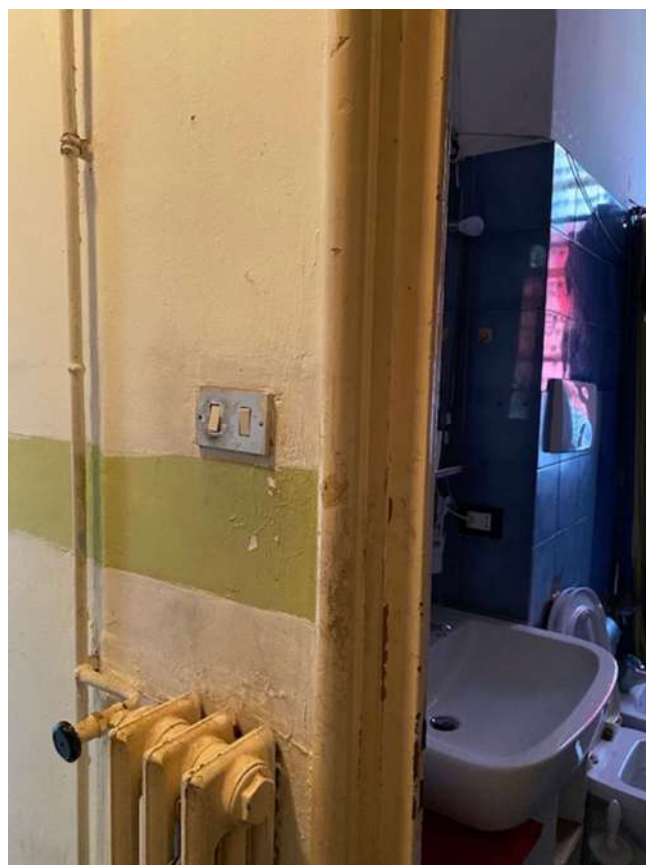
Condizioni stipiti porta del bagno