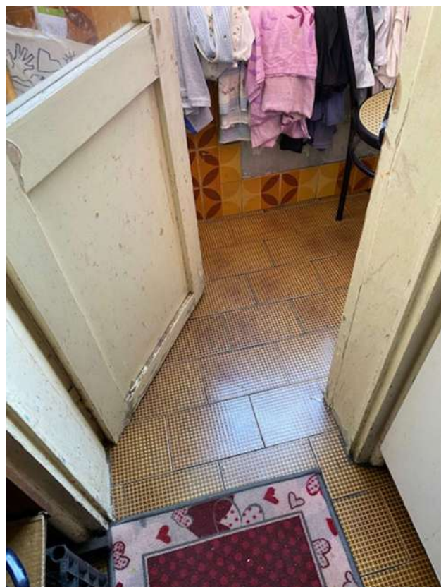
Pavimento e serramento della cucina verso il balcone