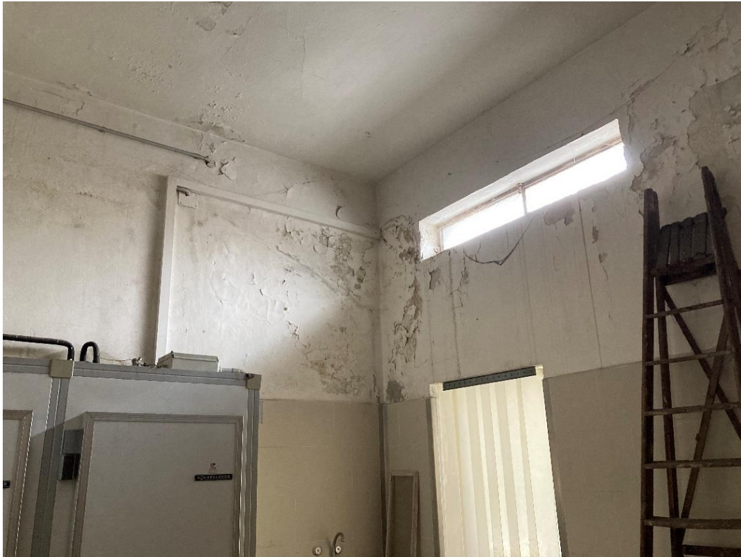
Foto n. 5: visuale generale ammaloramenti alle pareti e al soffitto – locale principale.