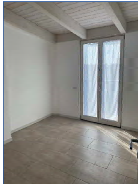
Foto 16 - camera 1