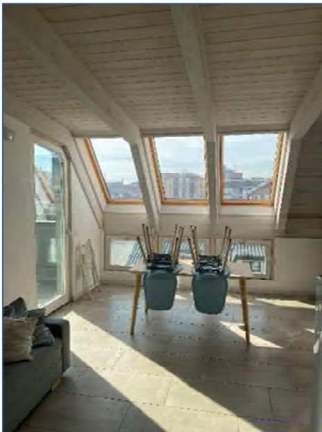
Foto 15 - soggiorno con angolo cottura