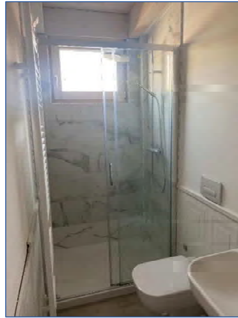
Foto 22 - bagno 2