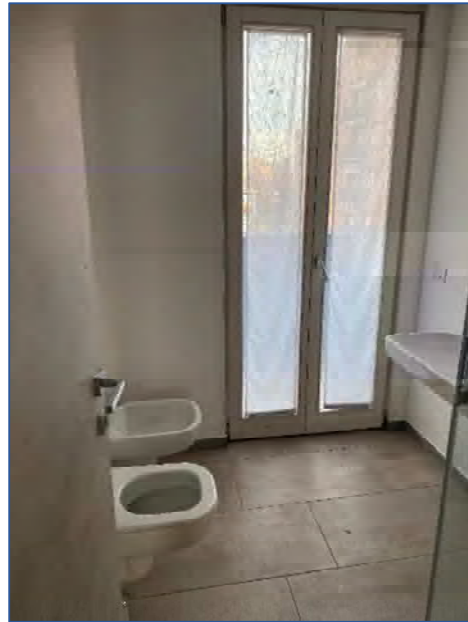
Foto 20 - bagno 1