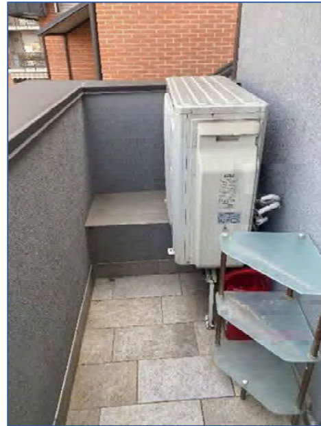
Foto 24 - dettaglio impianto