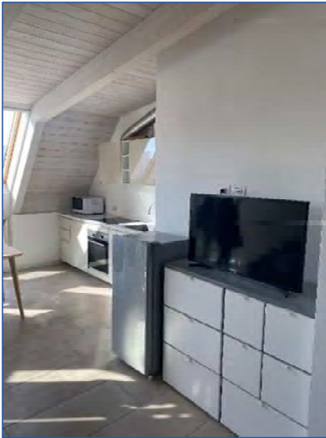
Foto 13 - soggiorno con angolo cottura