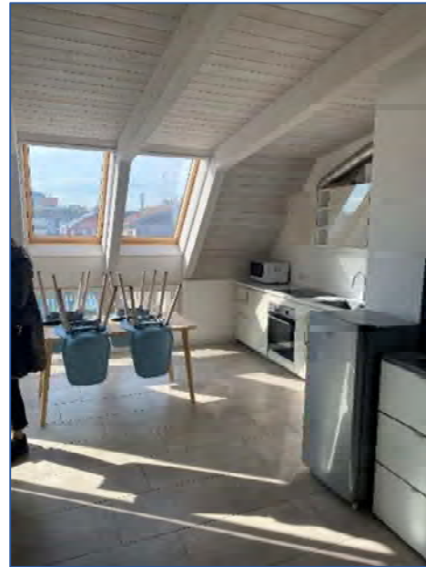
Foto 14 - soggiorno con angolo cottura