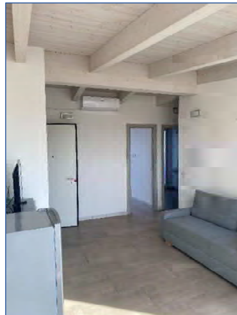
Foto 12 - ingresso su soggiorno