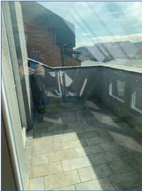
Foto 23 - terrazzo