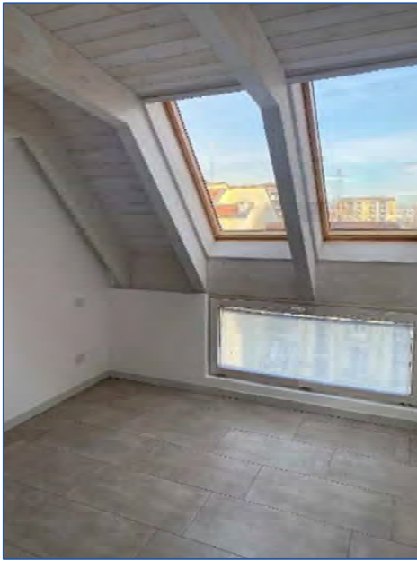
Foto 17 - camera 2