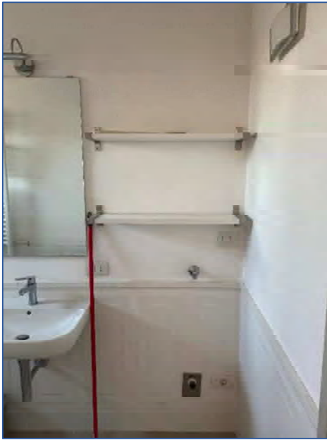
Foto 21 - bagno 2