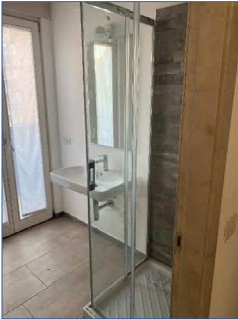
Foto 19 - bagno 1