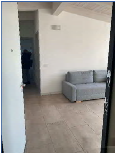
Foto 11 - ingresso appartamento