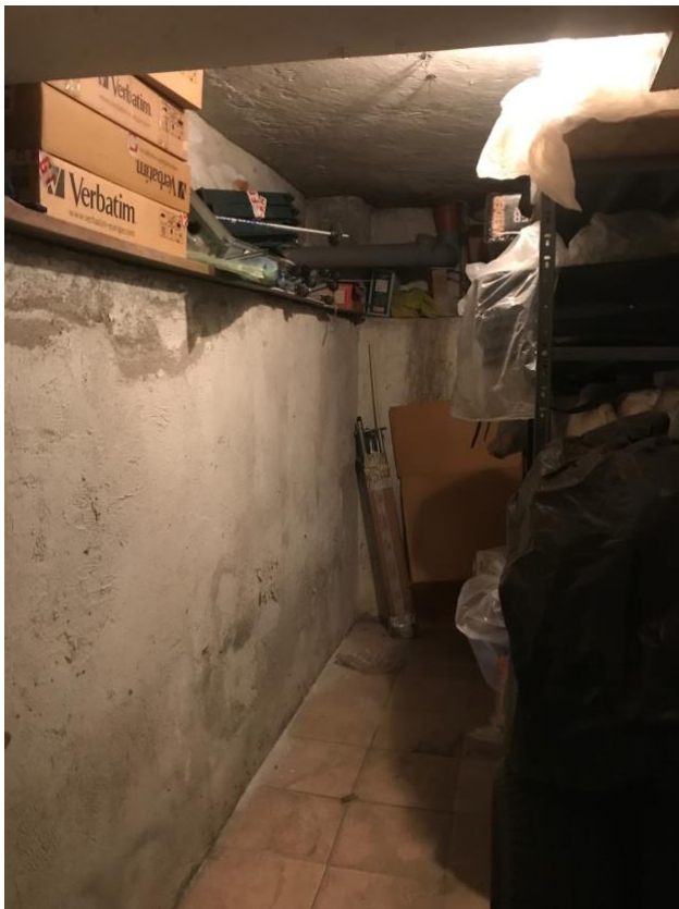
Immagine 18. La cantina.