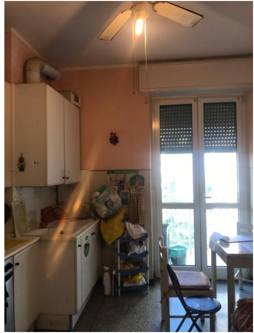
Immagini 12 e 13. Il locale giorno, attualmente adibito a cucina pranzo che si affaccia sul parco tramite il lungo balcone.