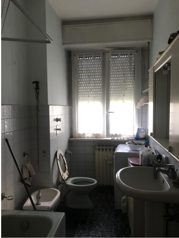
Immagine 16. Il bagno.