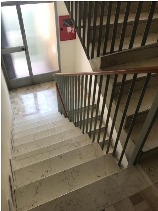
Immagine 10. Le scale condominiali.

Immagini 8 e 9. L'ascensore e l'androne visto dall'interno. L'immobile è accessibile e l'unità immobiliare raggiungibile e adattabile.