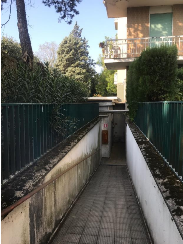
Immagine 17. La rampa posta sul retro del fabbricato che conduce alle cantine.