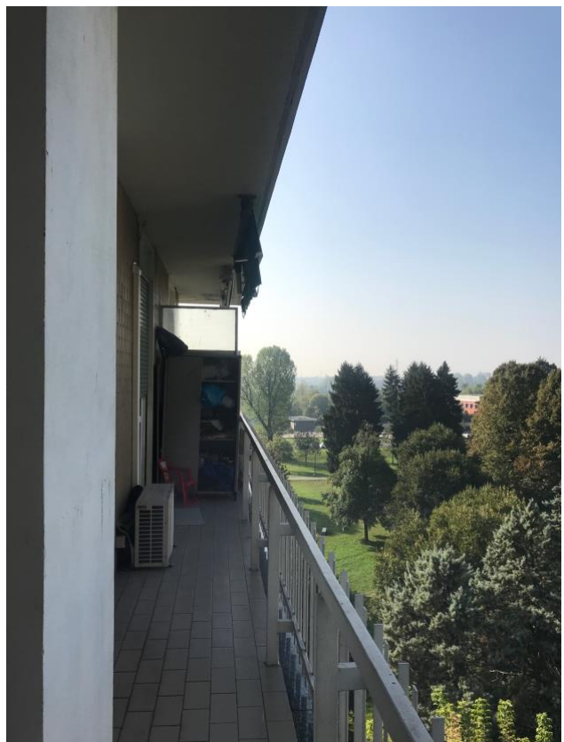
Immagine 11. Il balcone vista parco.