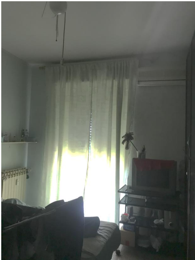
Immagine 16. La camera.