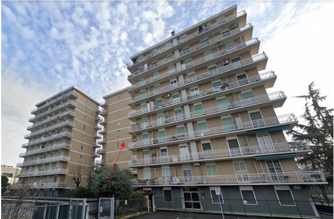
Immagine 1 Il complesso immobiliare visto dalla strada con l'indicazione del fabbricato in cui si trova l'unità oggetto di valutazione.