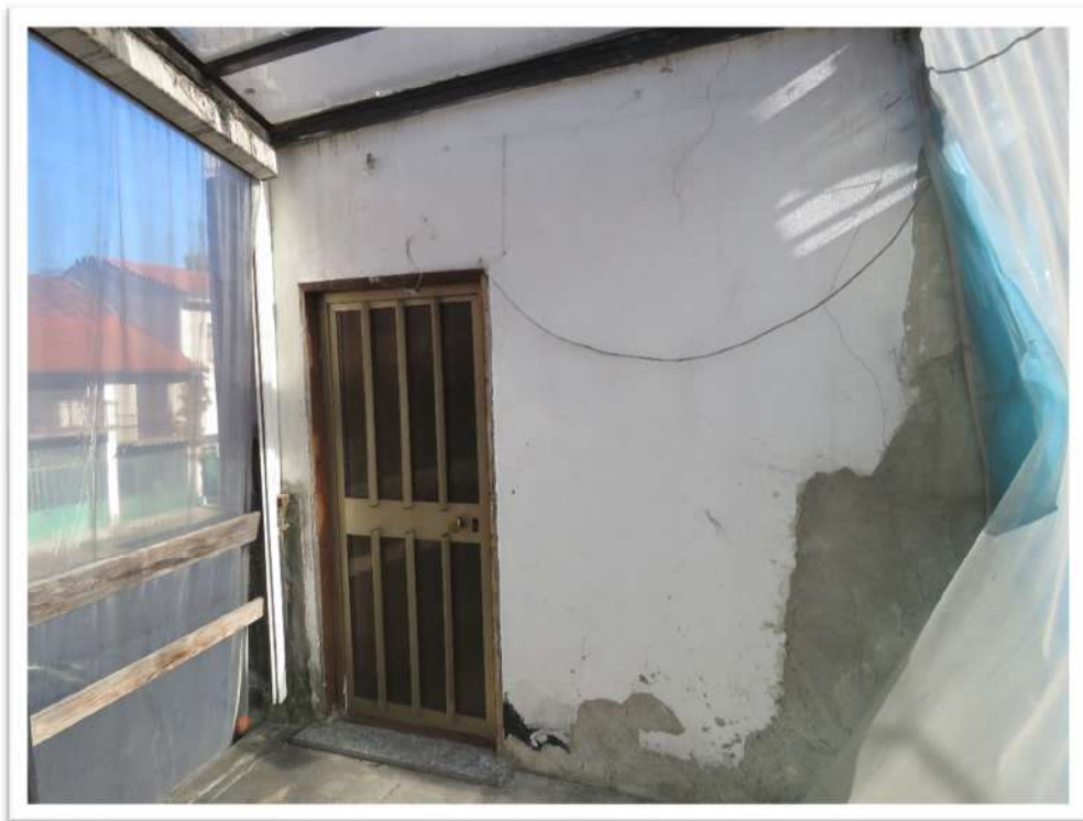
Il terrazzo di collegamento con le altre porzioni dell'immobile.