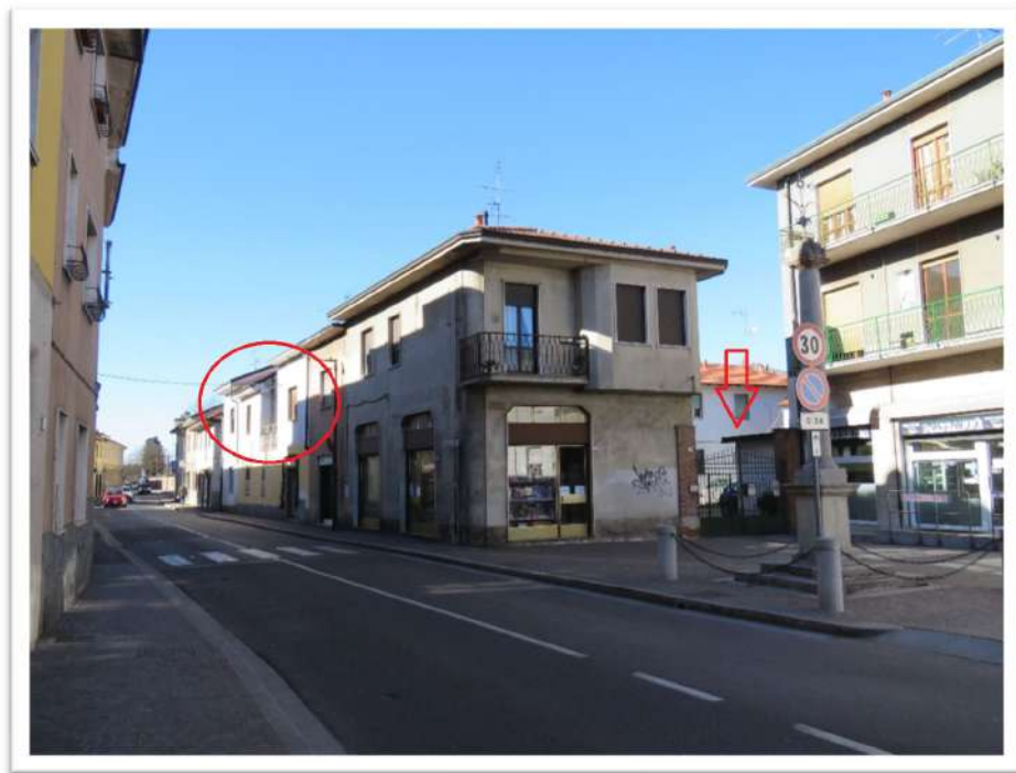
Vista del fabbricato ex rurale e dell'accesso alla corte da largo Vittorio Veneto.