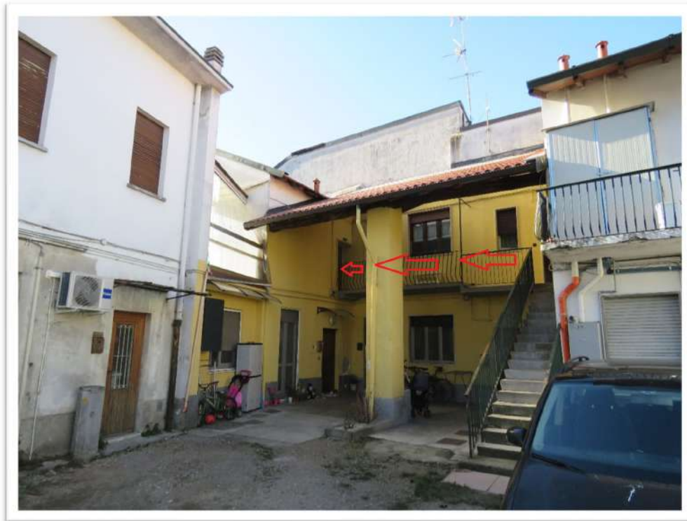
Percorso di accesso all'immobile pignorato.