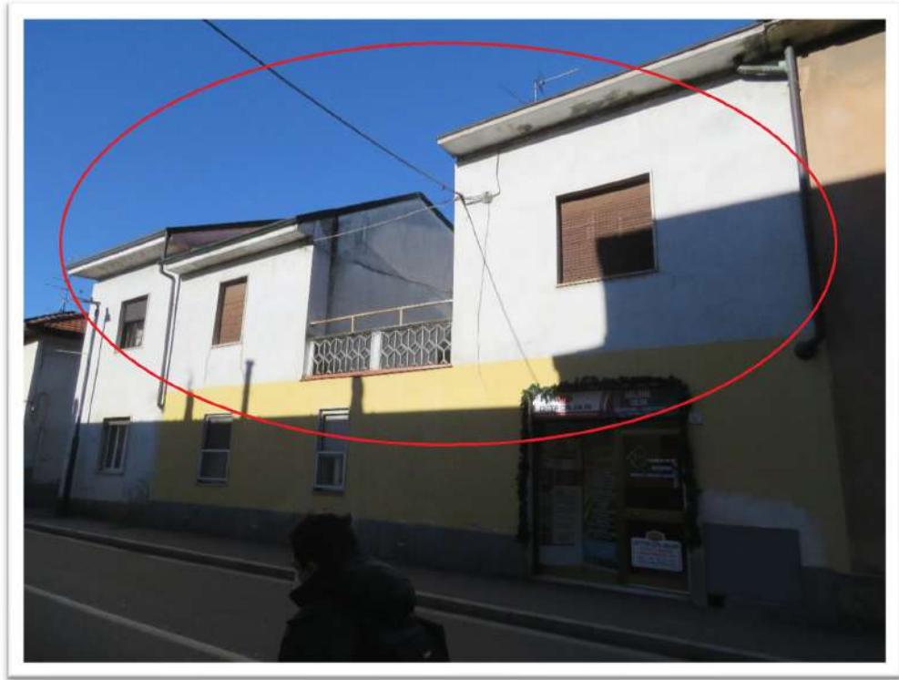
Particolari delle facciate delle porzioni in esame su via Mengato.