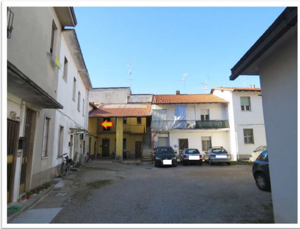
Viste della corte.