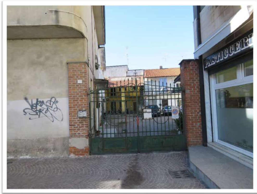
Particolare dell'ingresso alla corte ex rurale.