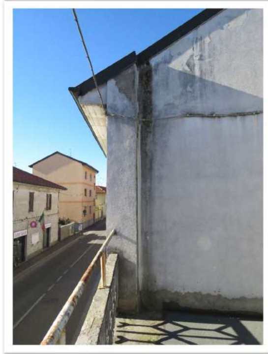
Viste del terrazzo.