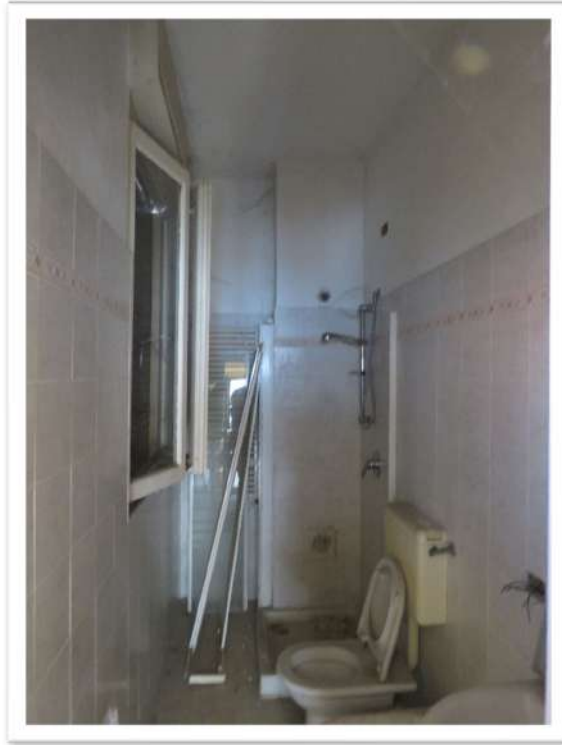
Il bagno ed il disimpegno.