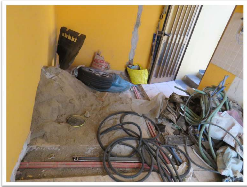
Particolari locale ingresso/cucina.