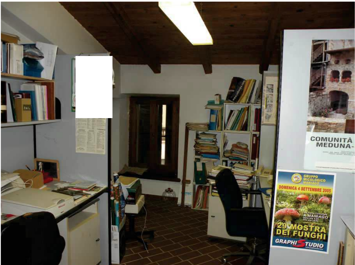
22 - CUCINA