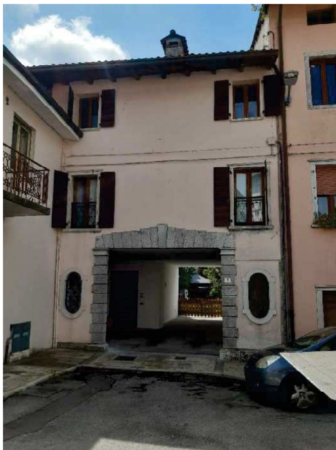
1 - FRONTE STRADA