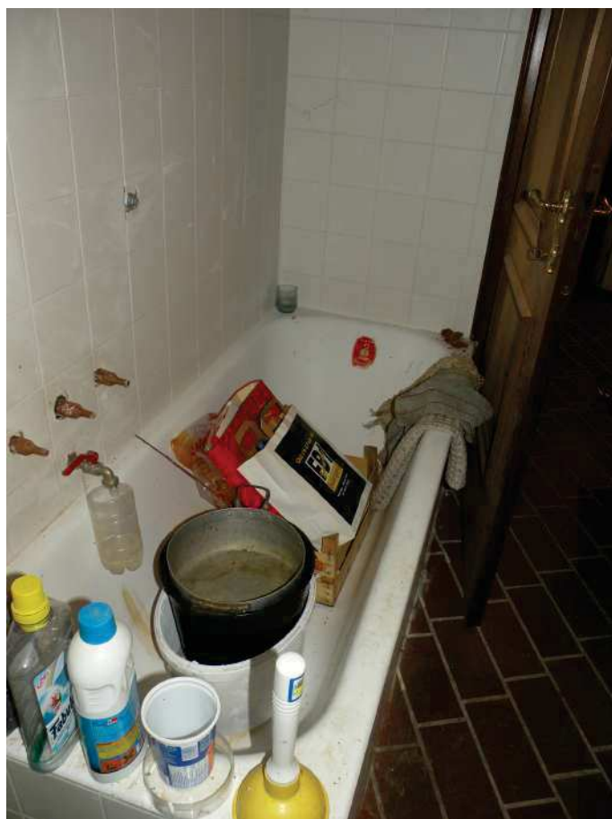
25 - BAGNO