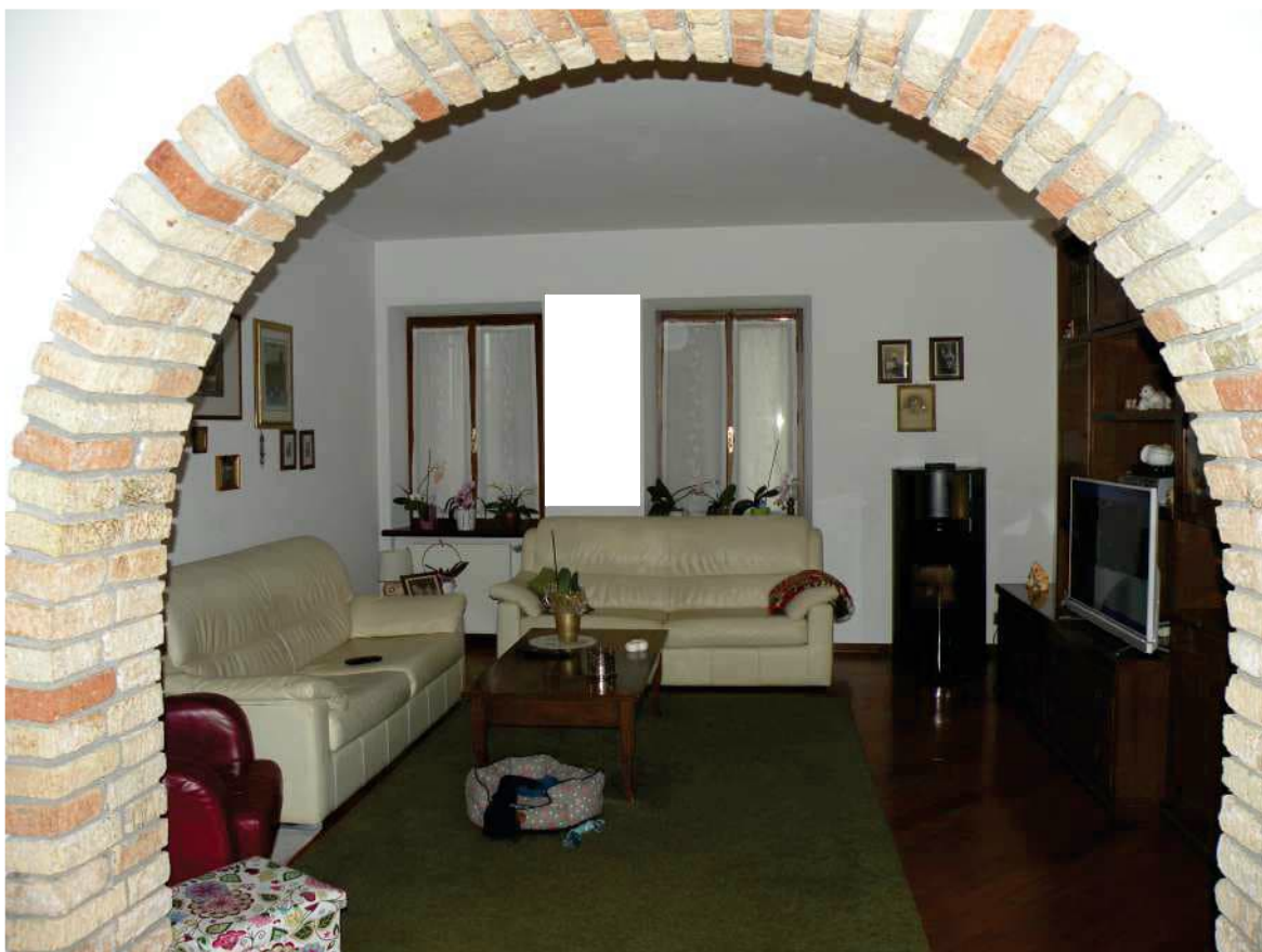
8 - SOGGIORNO