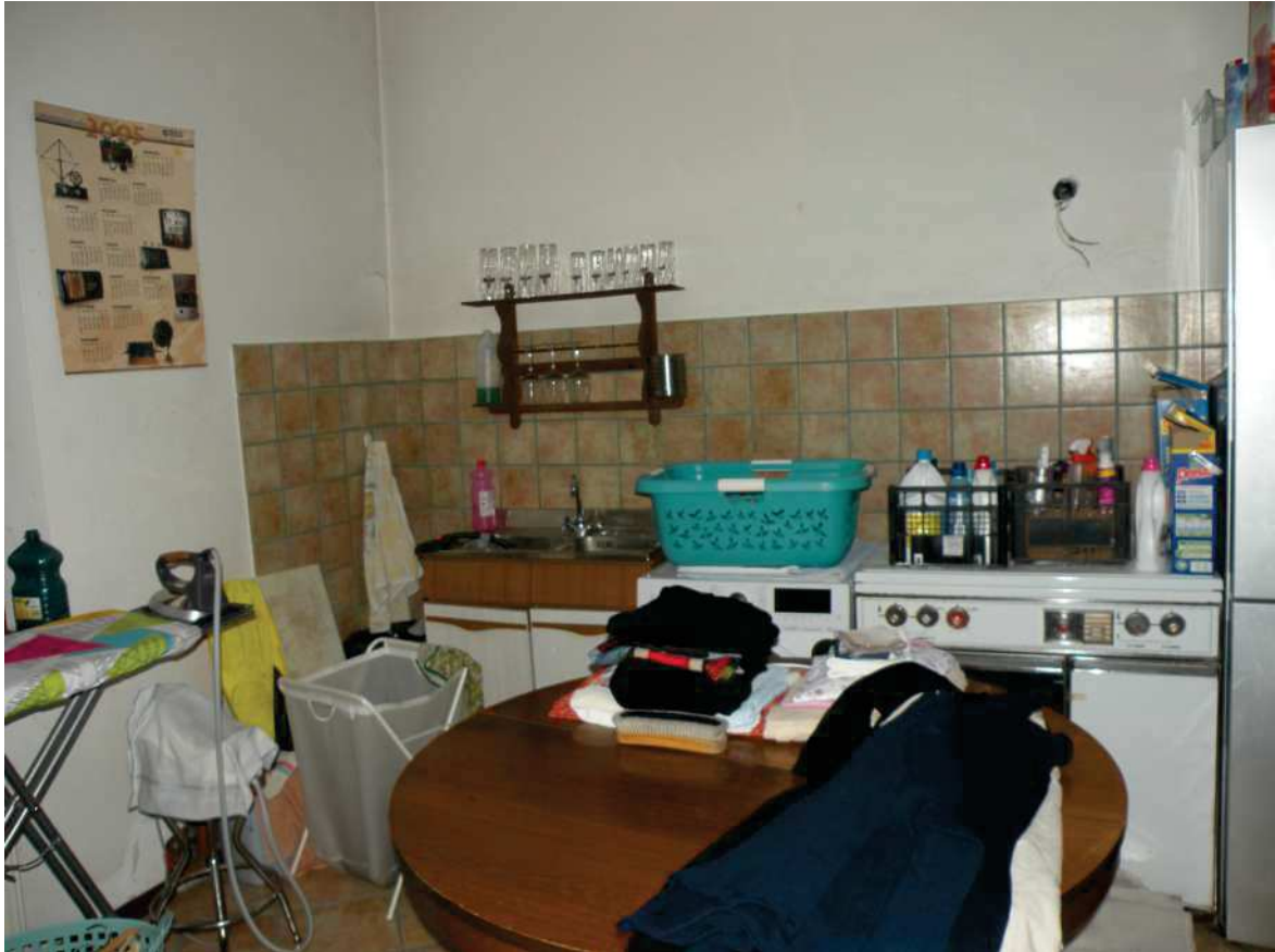
14 - DEPOSITO PIANO TERRA