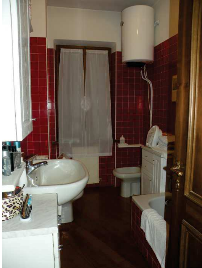
12 - BAGNO