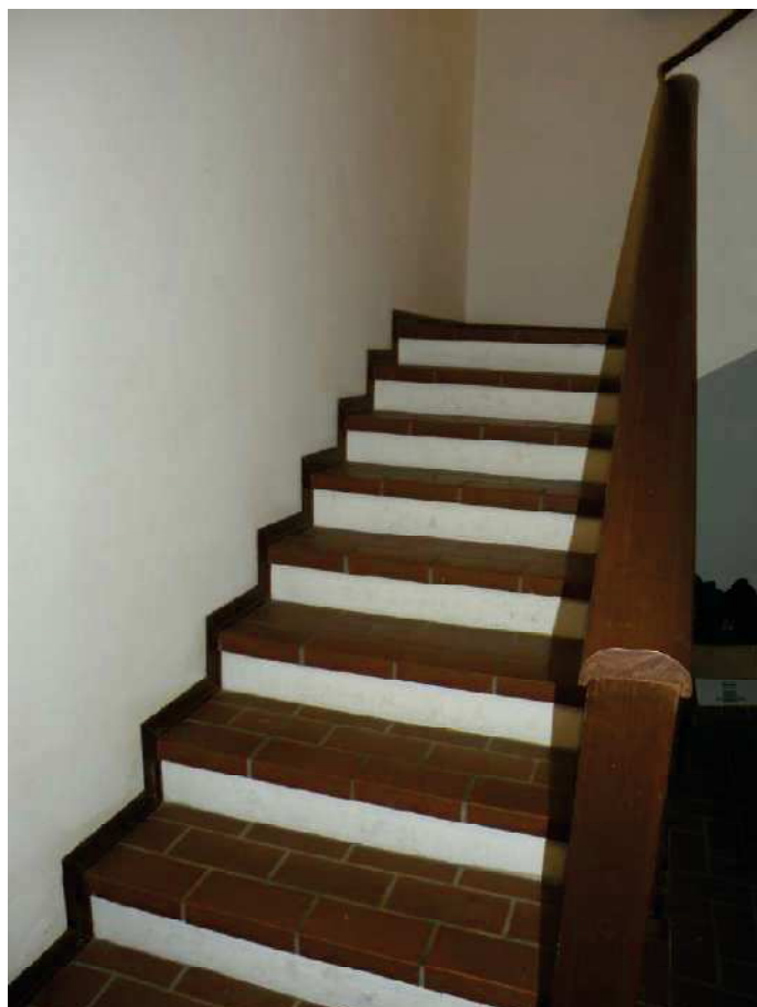
13 - VANO SCALE