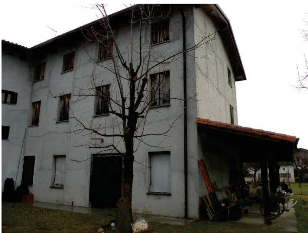
5 - LATO OVEST