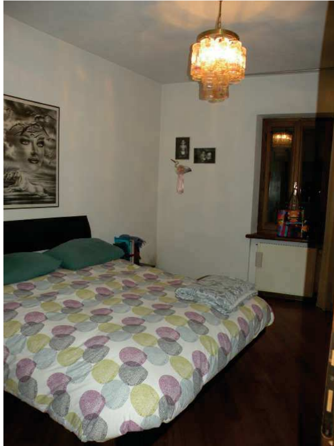
10 - CAMERA