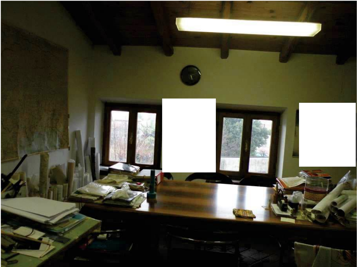
21 - SOGGIORNO