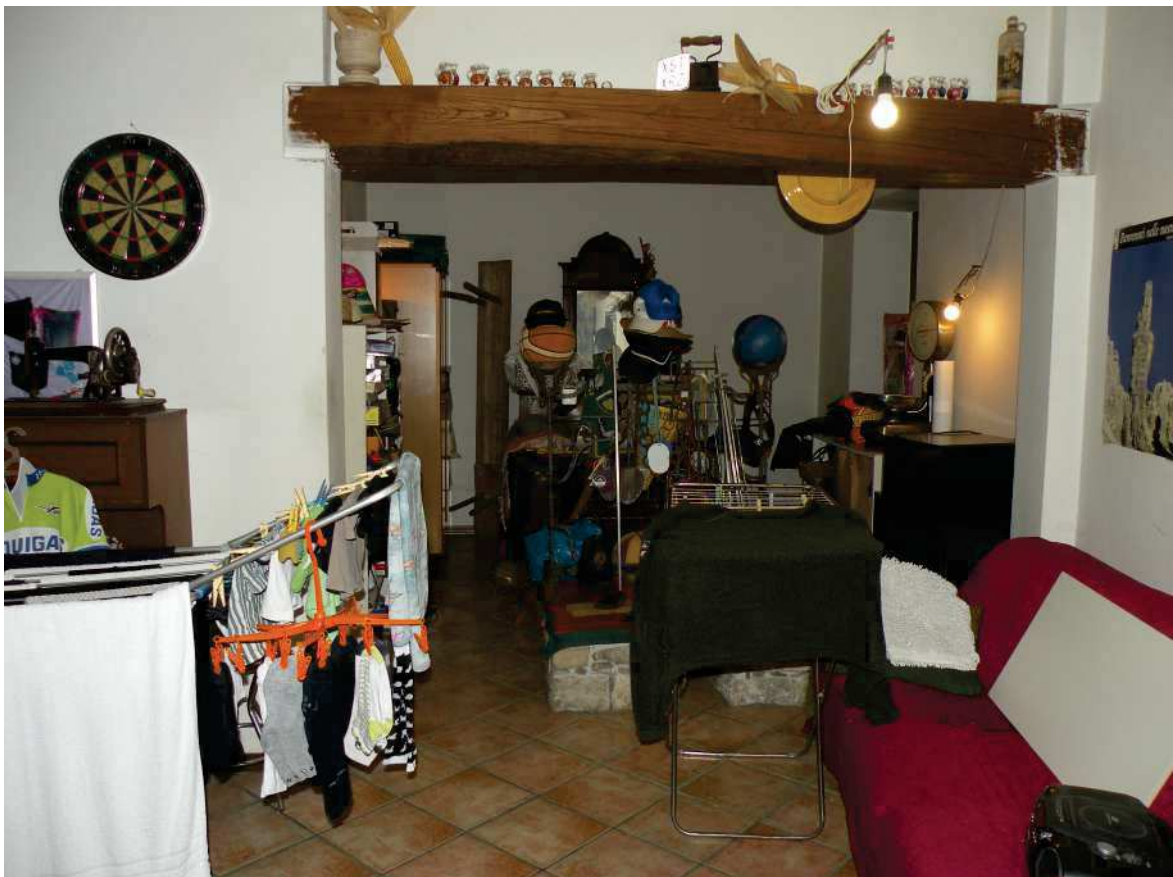
15 - DEPOSITO PIANO TERRA