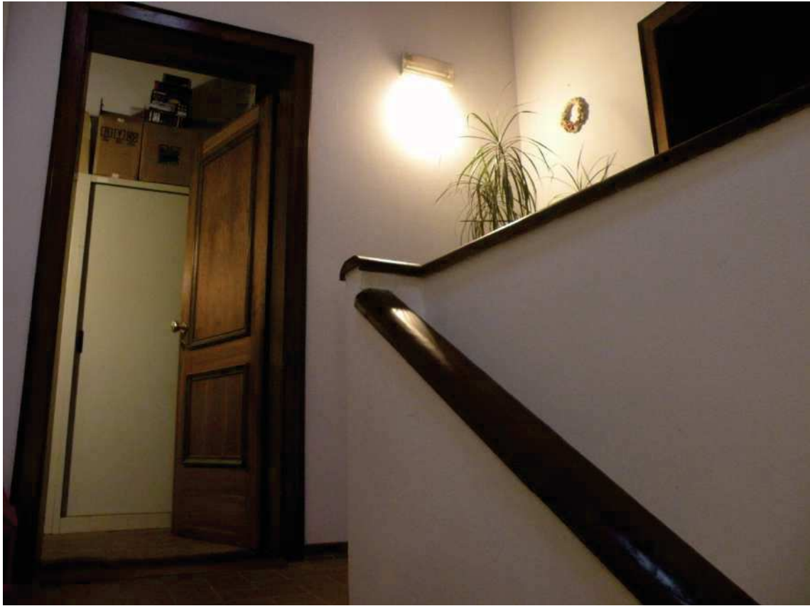
19 - INGRESSO