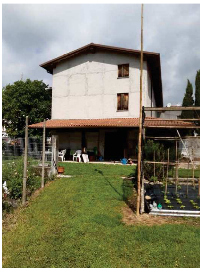
2 - LATO SUD