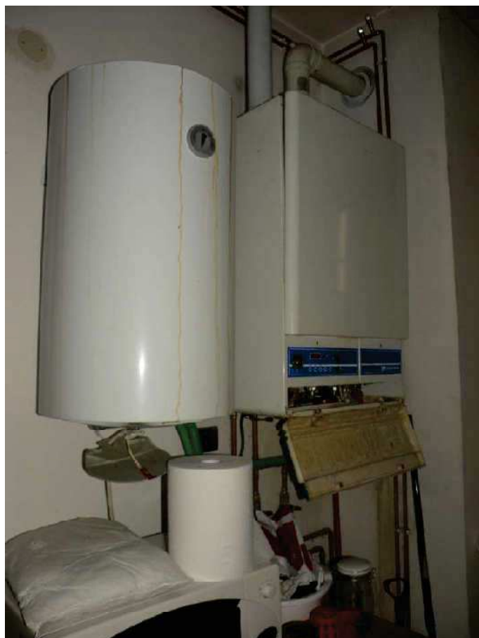
18 - CALDAIA E BOILER ELETTRICO