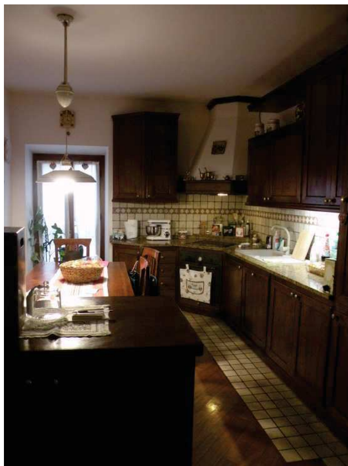
7 - CUCINA