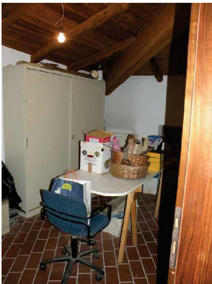
24 - CAMERA