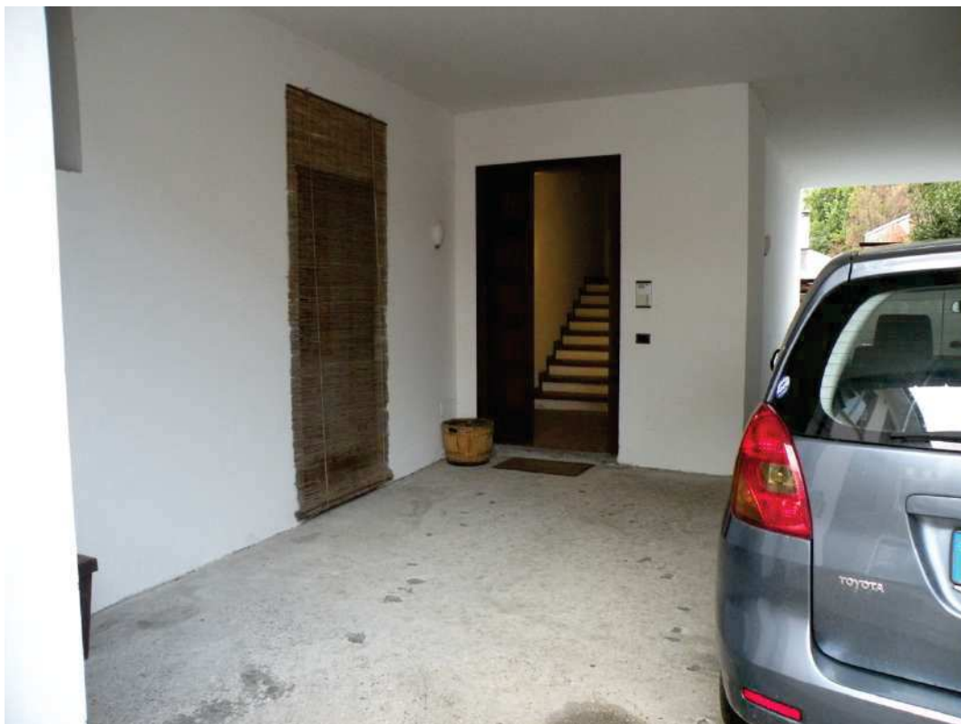
6 - ACCESSO AL VANO SCALE