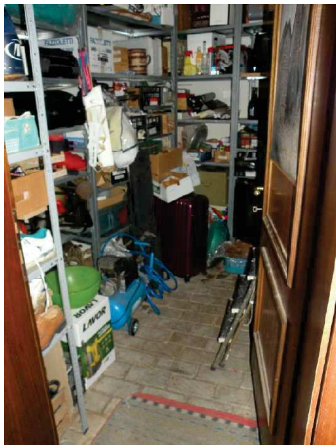
17 -DEPOSITO PIANO TERRA