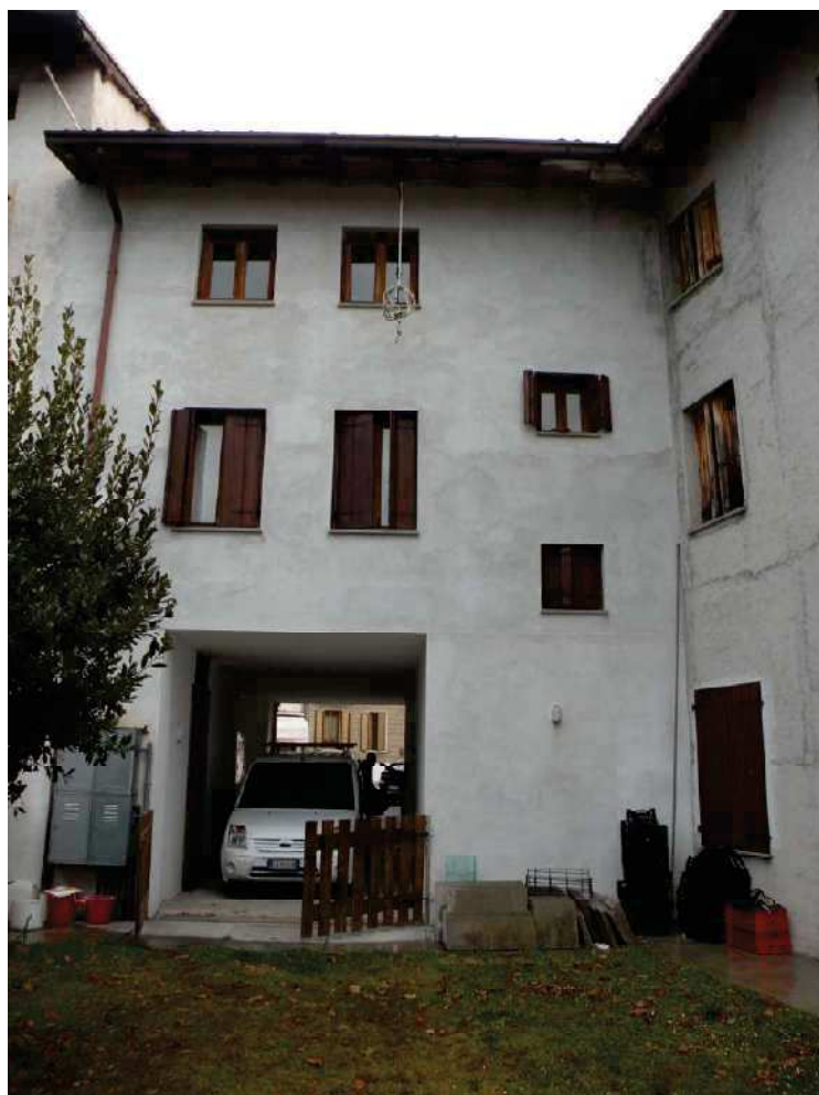
3 - SOTTOPORTICO