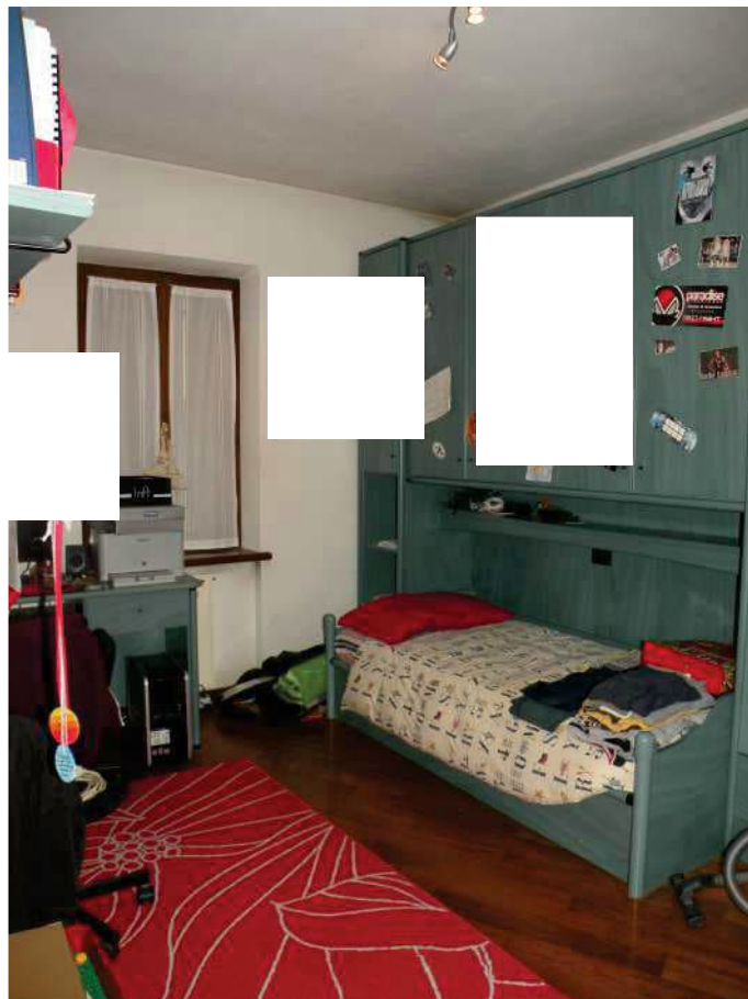
11 - CAMERA