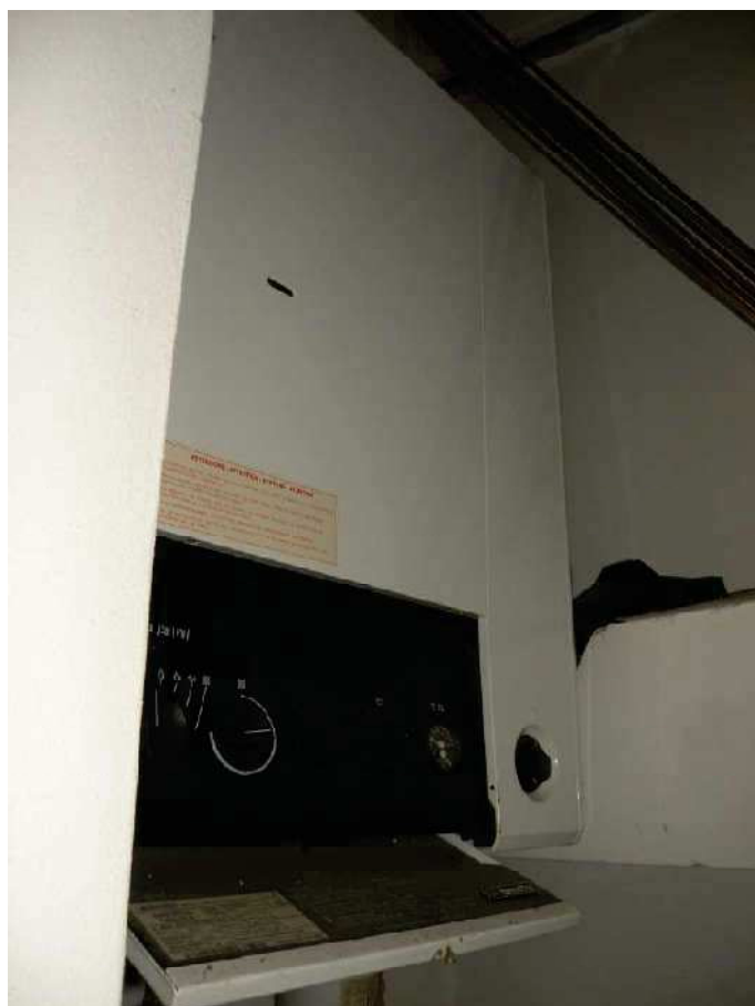
26 - RIPOSTIGLIO