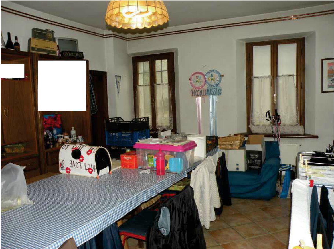
16 - DEPOSITO PIANO TERRA