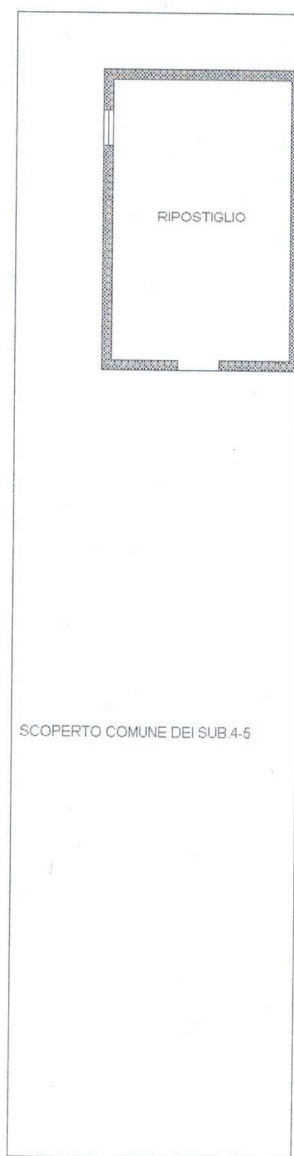
PIANTA PIANO TERRA H=2.90ml