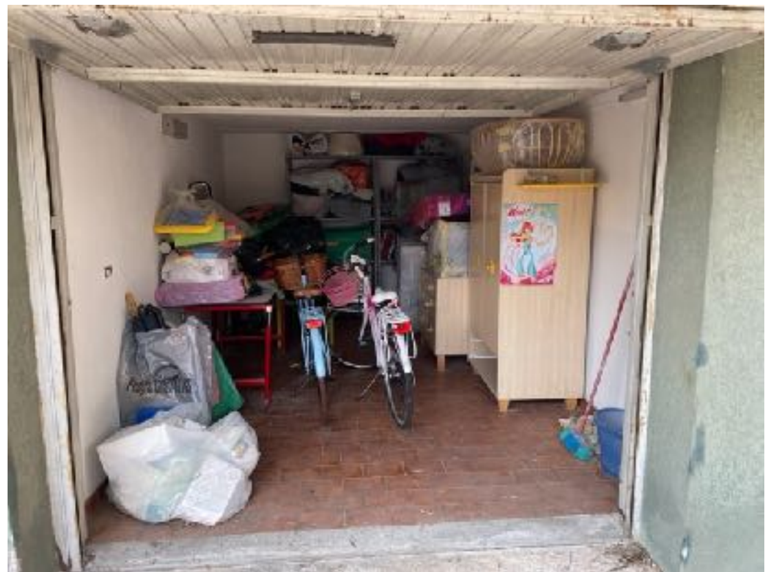
Viabilità interna accesso garages e locali tecnici condominiali