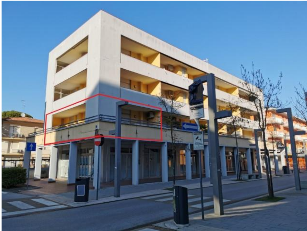
FOTO 1: PANORAMICA COND. ELETTRA ED APPARTAMENTO AL 1°P. (SUB. 5)