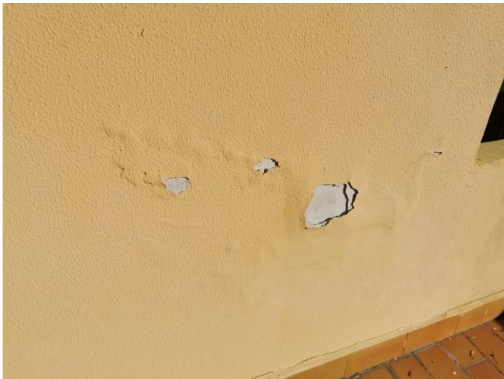
FOTO 24: PARTICOLARE RIVESTIMENTO ESTERNO (Subalterno n. 5 – 1°P.)