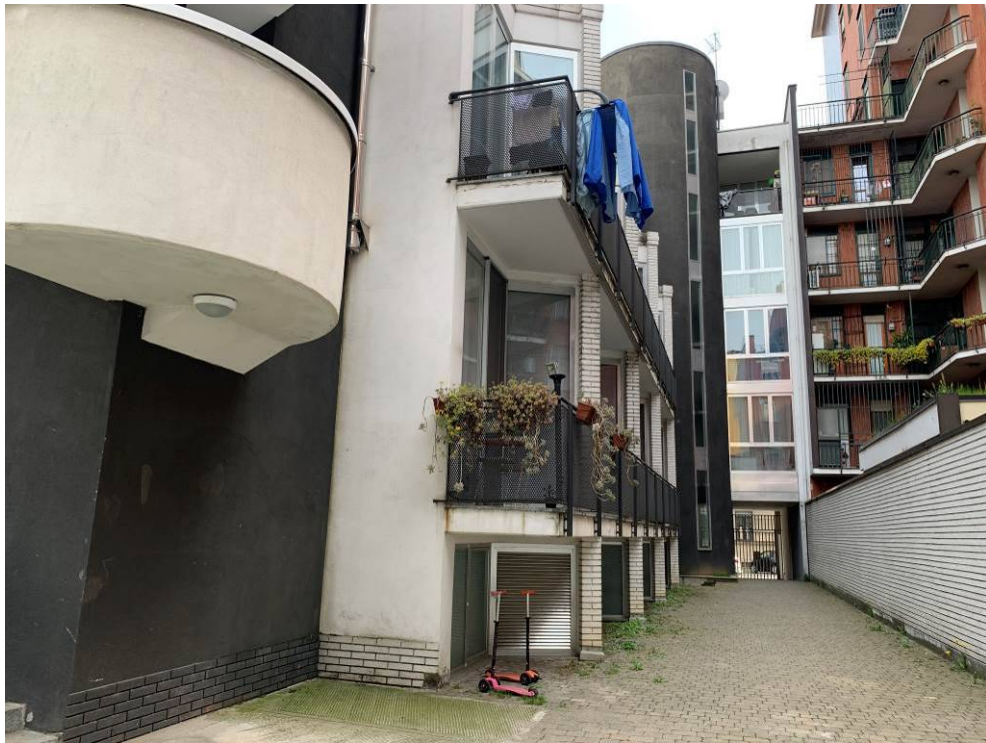
Fotografia n. 3 – Vista a sinistra dell'area delle unità immobiliari L-M (posti auto piano terra)