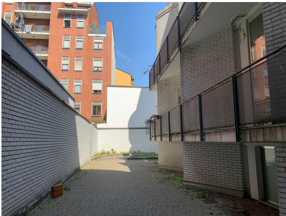
Fotografia n. 2 – Vista a destra dell'area delle unità immobiliari L-M (posti auto piano terra)