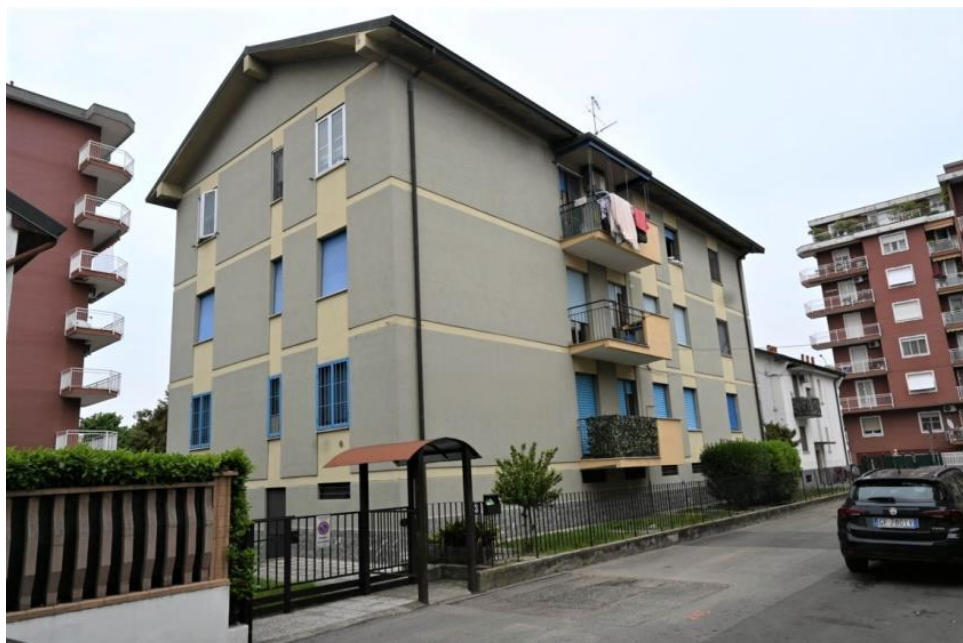
VIA PITAGORA n°3