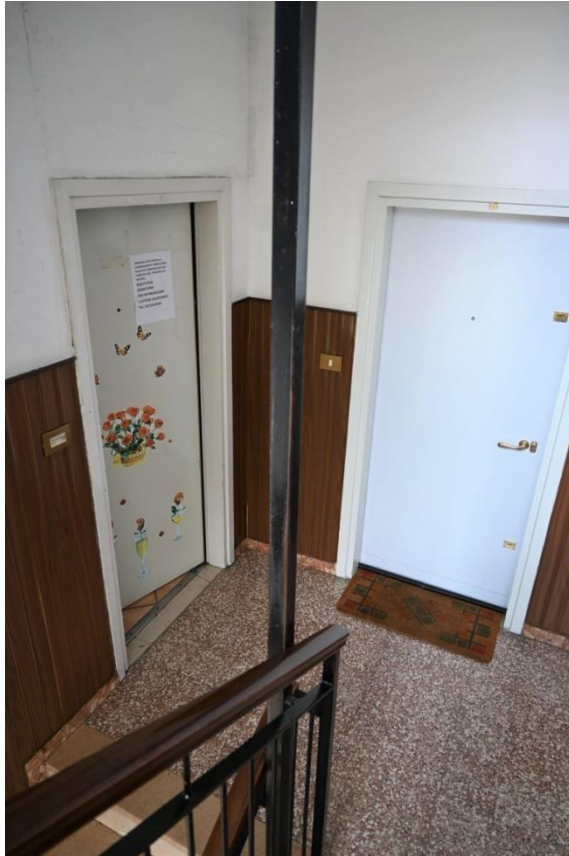
PIANEROTTOLO 1° PIANO

R.G.E. n°1198/2021 TREZZANO SUL NAVIGLIO (MI) Via Pitagora n°3 Appartamento piano 1° +cantina (S1)