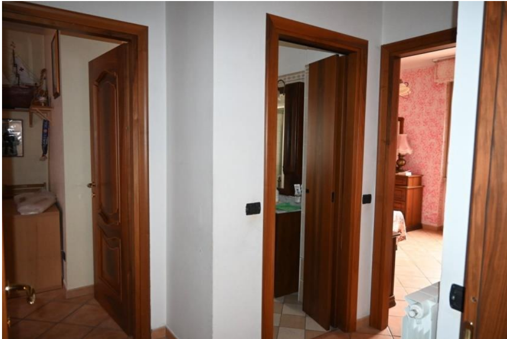
DISIMPEGNO ZONA NOTTE

R.G.E. n°1198/2021 TREZZANO SUL NAVIGLIO (MI) Via Pitagora n°3 Appartamento piano 1° +cantina (S1)