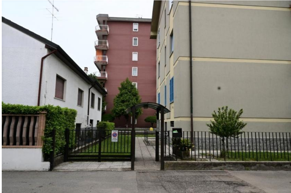
INGRESSO DA VIA PITAGORA

R.G.E. n°1198/2021 TREZZANO SUL NAVIGLIO (MI) Via Pitagora n°3 Appartamento piano 1° +cantina (S1)