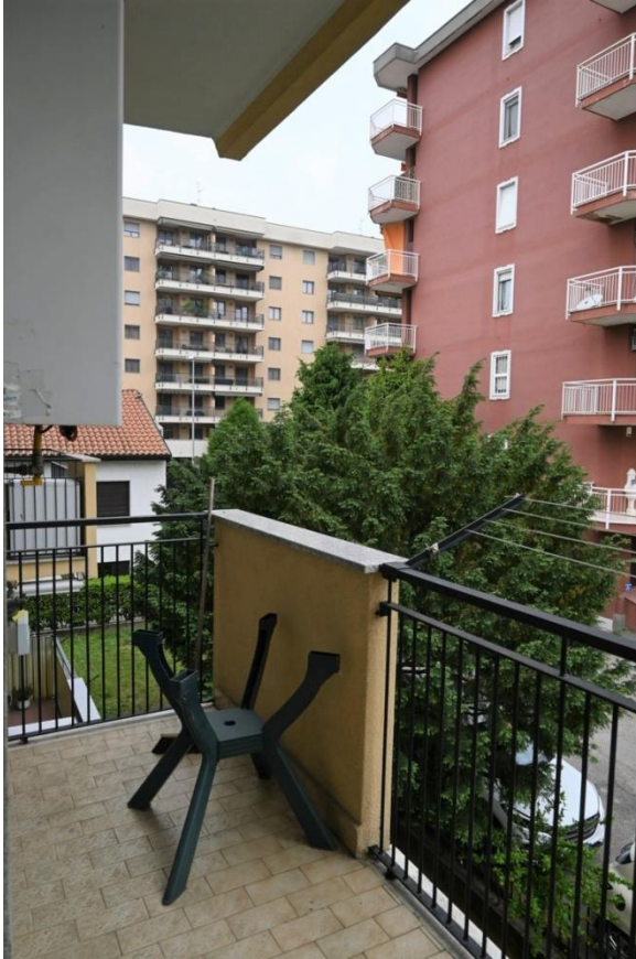
BALCONE SOGGIORNO – CUCINA

R.G.E. n°1198/2021 TREZZANO SUL NAVIGLIO (MI) Via Pitagora n°3 Appartamento piano 1° + cantina (S1)