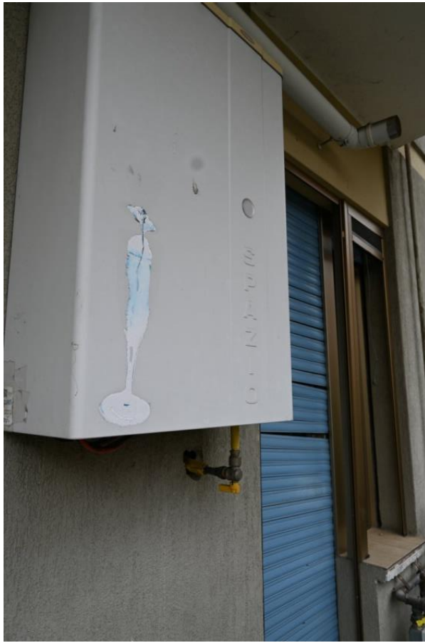
IMPIANTI - CALDAIA - QUADRO ELETTRICO - CITOFONO

R.G.E. n°1198/2021 TREZZANO SUL NAVIGLIO (MI) Via Pitagora n°3 Appartamento piano 1° +cantina (S1)