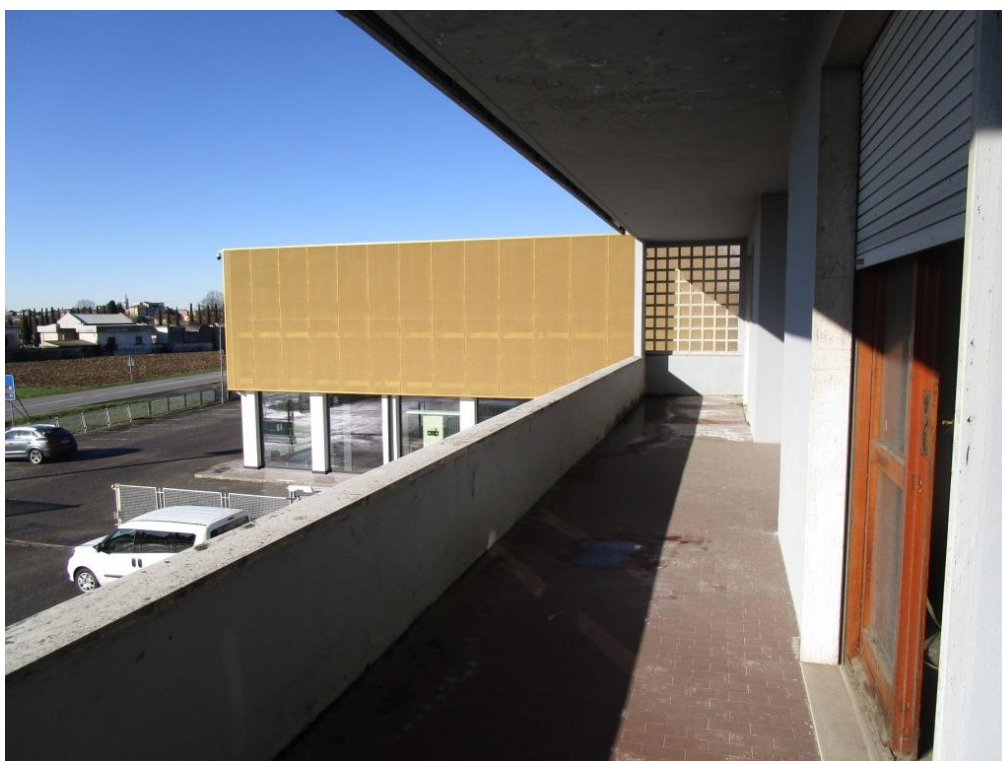
Foto 17 – Affaccio su area esterna (lato sud) prospiciente via Monza