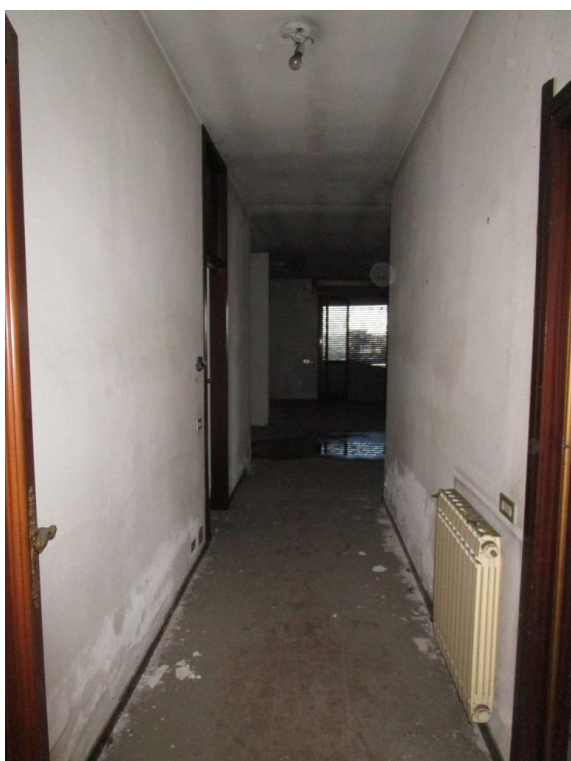
Foto 10/11 – Vano scala interno di collegamento all'appartamento (sub 2)