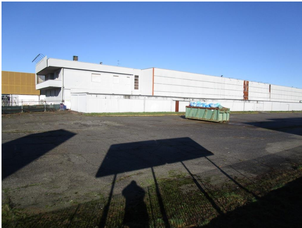
Foto 1 – Vista del capannone attualmente ad uso commerciale (lato est) e dell'area esterna

Estratto di mappa - con perimetrazione gialla vengono indicati i beni immobili LOTTO 2