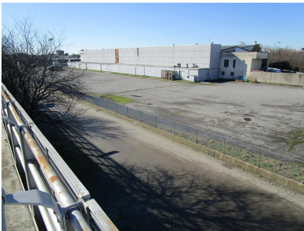
Foto 3 – Vista del capannone attualmente ad uso commerciale (lato sud-est) e dell'area esterna