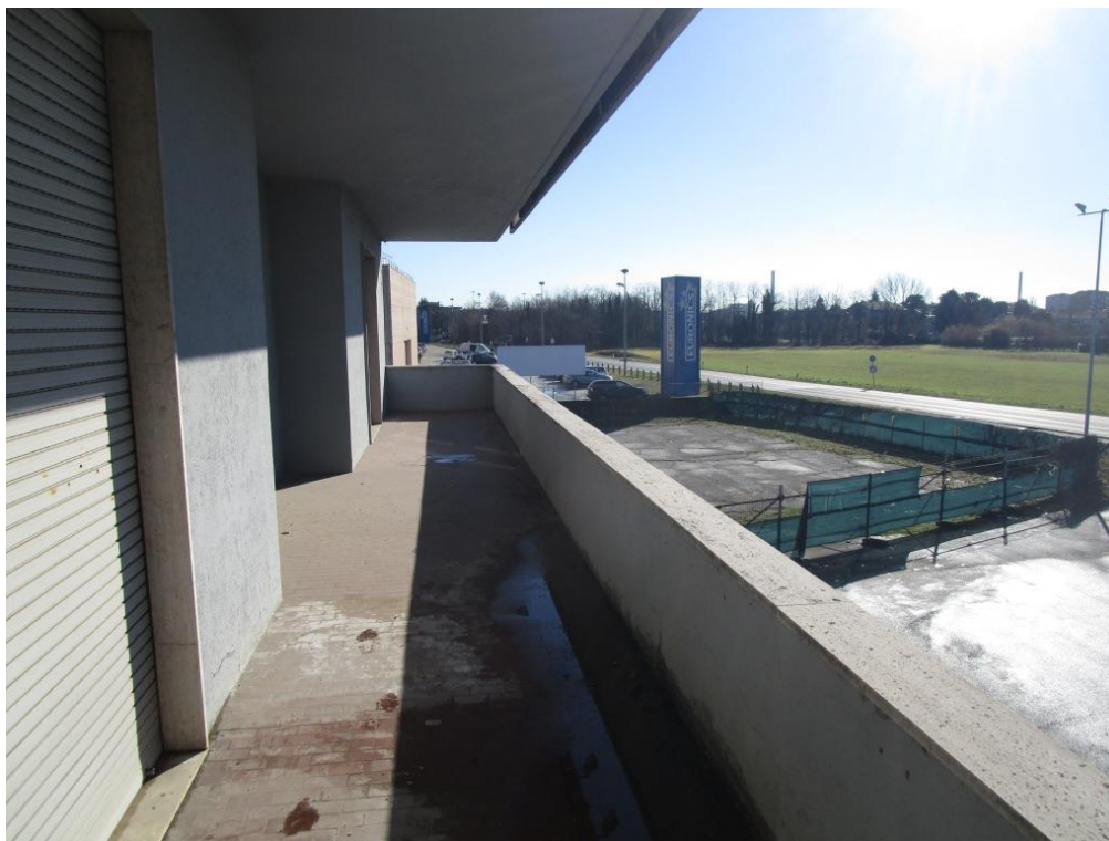
Foto 16 – Balcone con affaccio su area esterna (lato sud) prospiciente via Monza