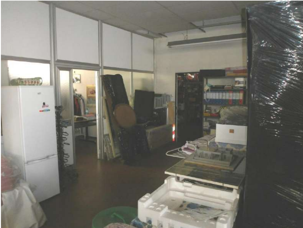
- FOTO 14 - INTERNO DEL NEGOZIO -