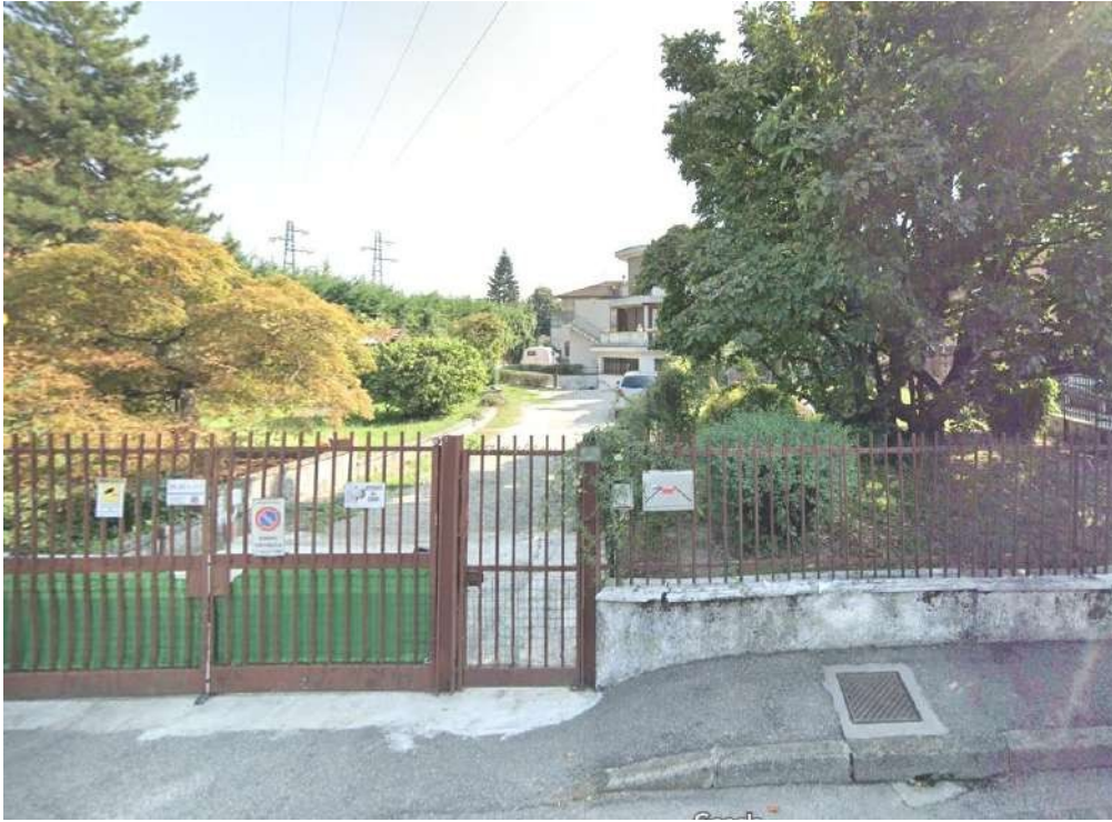
- FOTO 3 - INGRESSO DA VIA CASSANESE -