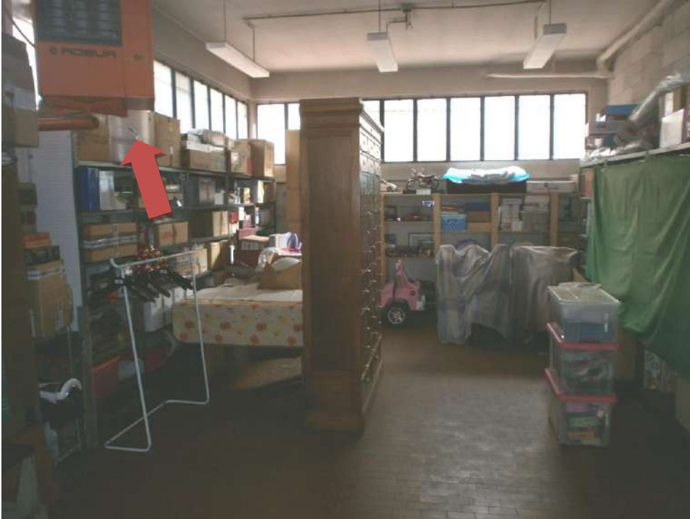
- FOTO 11 - INTERNO DEL NEGOZIO - IN EVIDENZA IL TERMOCONVETTORE -