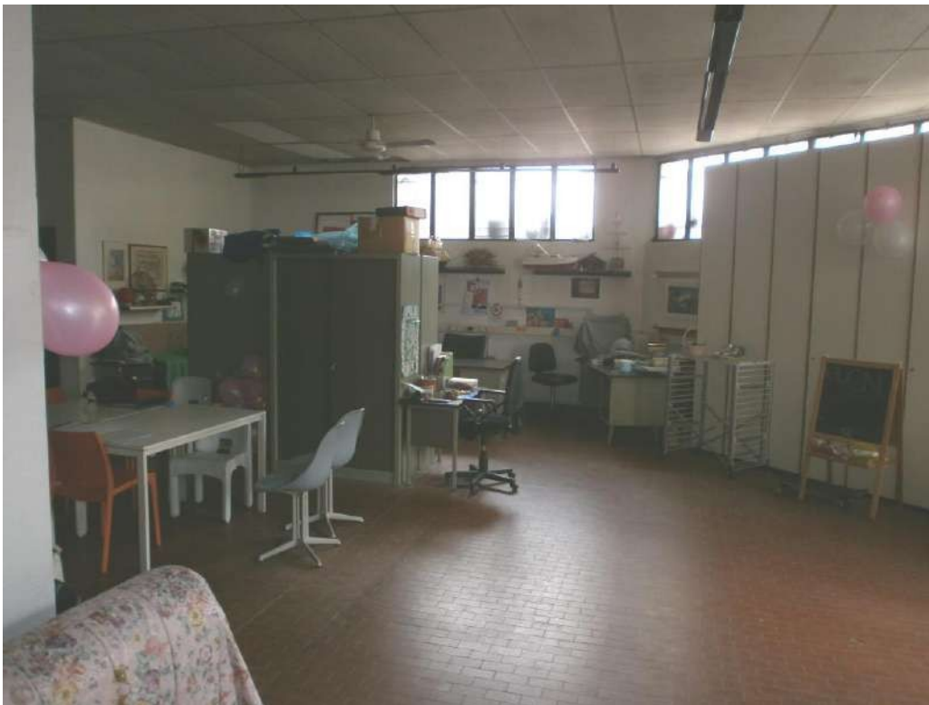
- FOTO 10 - INTERNO DEL NEGOZIO -