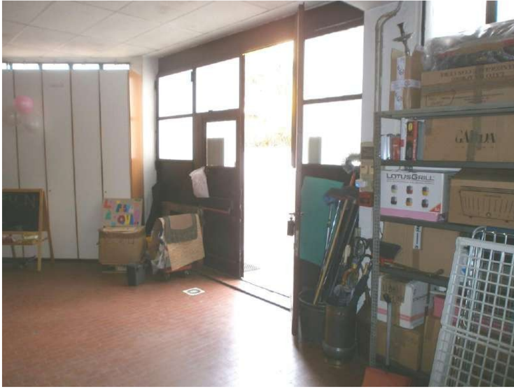
- FOTO 9 - INTERNO DEL NEGOZIO -