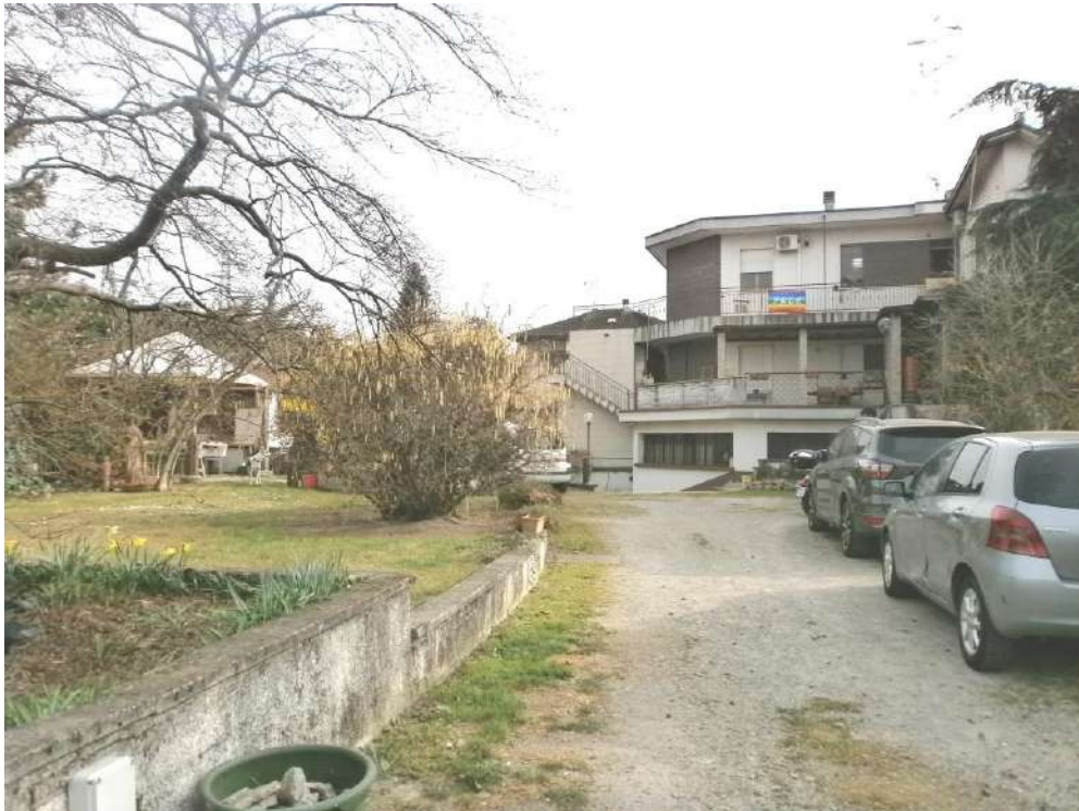
- FOTO 4 - CORTILE COMUNE -