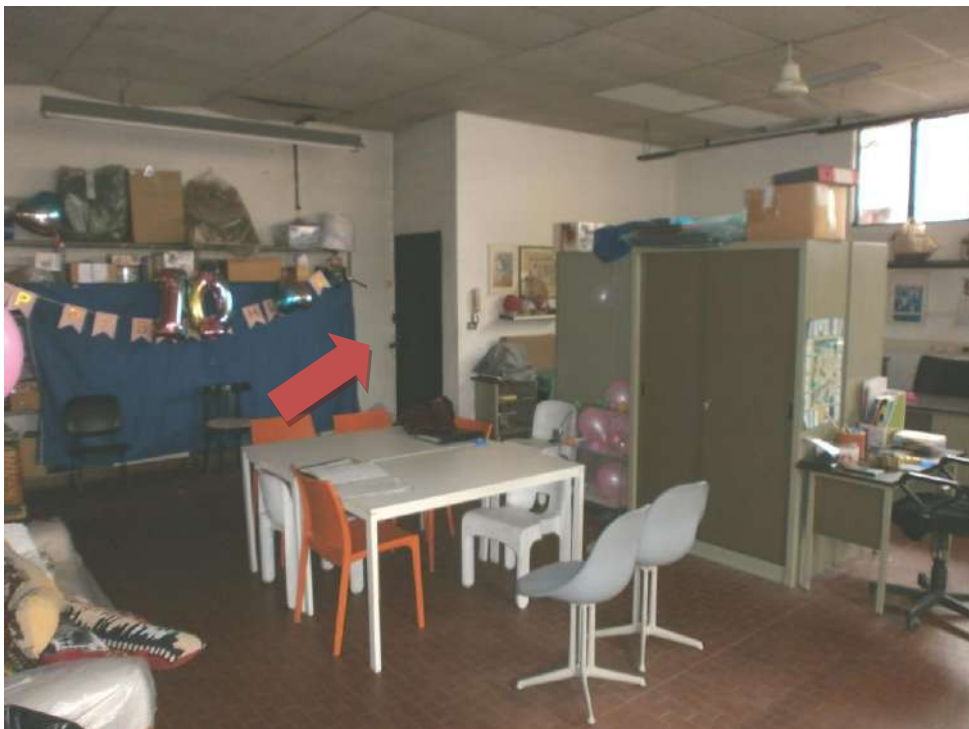
- FOTO 12 - INTERNO DEL NEGOZIO - IN EVIDENZA LA PORTA DI ACCESSO ALLA CANTINA DELL'APPARTAMENTO AL PIANO SECONDO -