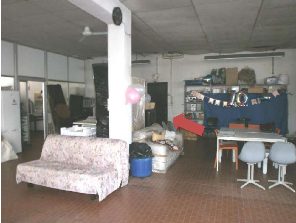
- FOTO 13 - INTERNO DEL NEGOZIO - IN EVIDENZA LA PORTA DI ACCESSO ALLA CANTINA DELL'APPARTAMENTO AL PIANO SECONDO -