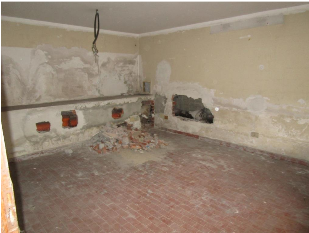
Foto 10 - Magazzino