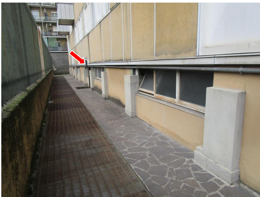
Foto 4 – Vista dal cortile lato est. Con la freccia viene indicato l'ingresso al magazzino