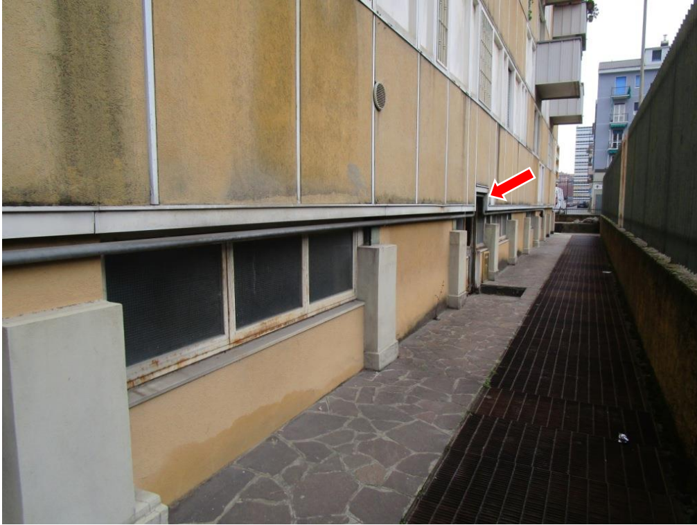
Foto 5 – Vista dal cortile lato est. Con la freccia viene indicato l'ingresso al magazzino